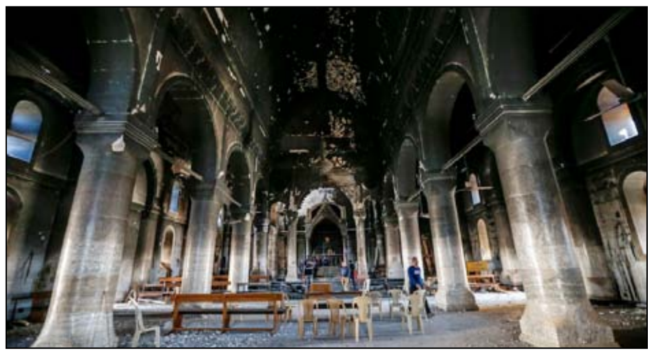
مسيحيون يتجولون في إحدى كنائس قره قوش بعد تحريرها