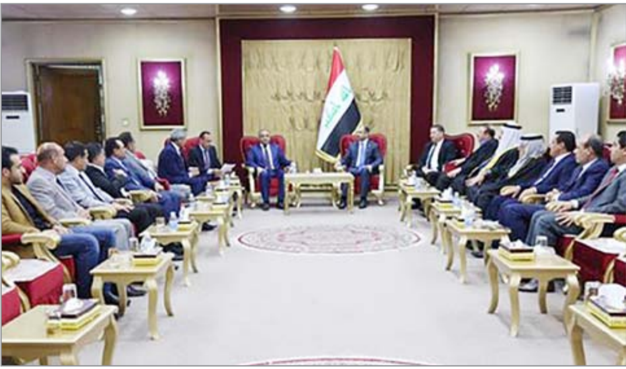
جانب من لقاء الجبوري بوفد من صلاح الدين أمس

التي من المؤمل أن يناقش تحت قبة البرلمان من أجل تعديله والتصويت عليه". وأكد الجبوري "أهمية هذه المجالس ودورها الفاعل في رصد معاناة الناس وفي التعامل المباشر مع جميع المعضلات التي ترتبط بالواقع الخدمي والإغاثي". كما بحث الجبوري مع الوفد أهمية "العمل على إعادة ما تبقى من نازحي محافظة صلاح الدين خصوصاً قضباء ببجي، وأهمية مساهمتهم الفعلية بحفظ الأمن في المناطق المحررة وفي إعادة النازحين بعد توفير كافة الاحتياجات الضرورية لهم".