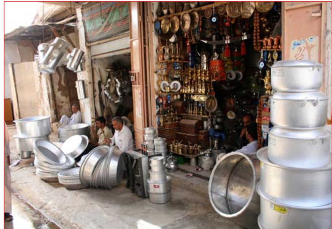
محل لبيع الأواني المنزلية وسط بغداد...

بغداد / المدى أشادت وزارة الخارجية العراقية، أمس الاثنين، بقرار الرئيس الأميركي دونالد ترامب باستثناء العراق من حظر السفر، وعدته "خطوة بالإيجاب الصحيح". وقال المتحدث باسم الوزارة أحمد جمال، في بيان تلقى (المدى) نسخة منه، إن وزارة الخارجية العراقية تعبر عن عميق ارتياحه للقرار التنفيذي الصادر عن الرئيس الأميركي دونالد ترامب، والذي تضمن استثناء العراقيين من حظر السفر للولايات المتحدة الأميركية. بغداد / المدى أضاف جمال أن "القرار خطوة هامة في الاتجاه الصحيح الذي يعزز التحالف الاستراتيجي بين بغداد وواشنطن في العديد من المجالات وفي مقدمتها محاربة الإرهاب". جاء ذلك رداً على خطوة الرئيس الأميركي دونالد ترامب بتوقيع نسخة جديدة من مرسومه حول الهجرة الذي علقه القضاء كما أعلنت مستشارته كيليان كونواي. وتحدثت كونواي، بحسب فرانس برس، عن "مرسوم جديد اليوم"، مضيفة ان موعد دخوله حيز التنفيذ سيكون ١٦ آذار، وكانت النسخة السابقة تنص على