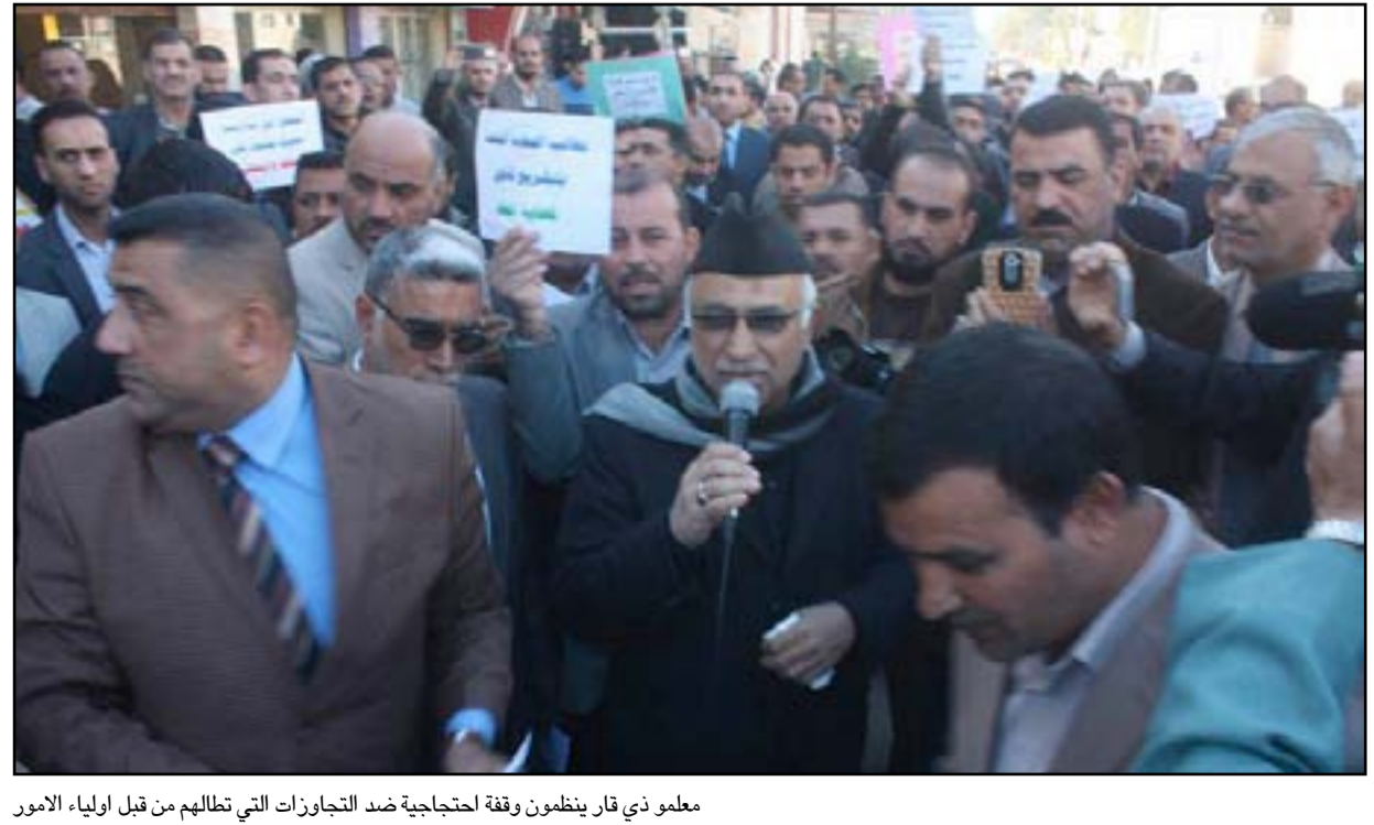
معلمو ذي قار ينظمون وقفة احتجاجية ضد التجاوزات التي تظلمهم من قبل اولياء الامور