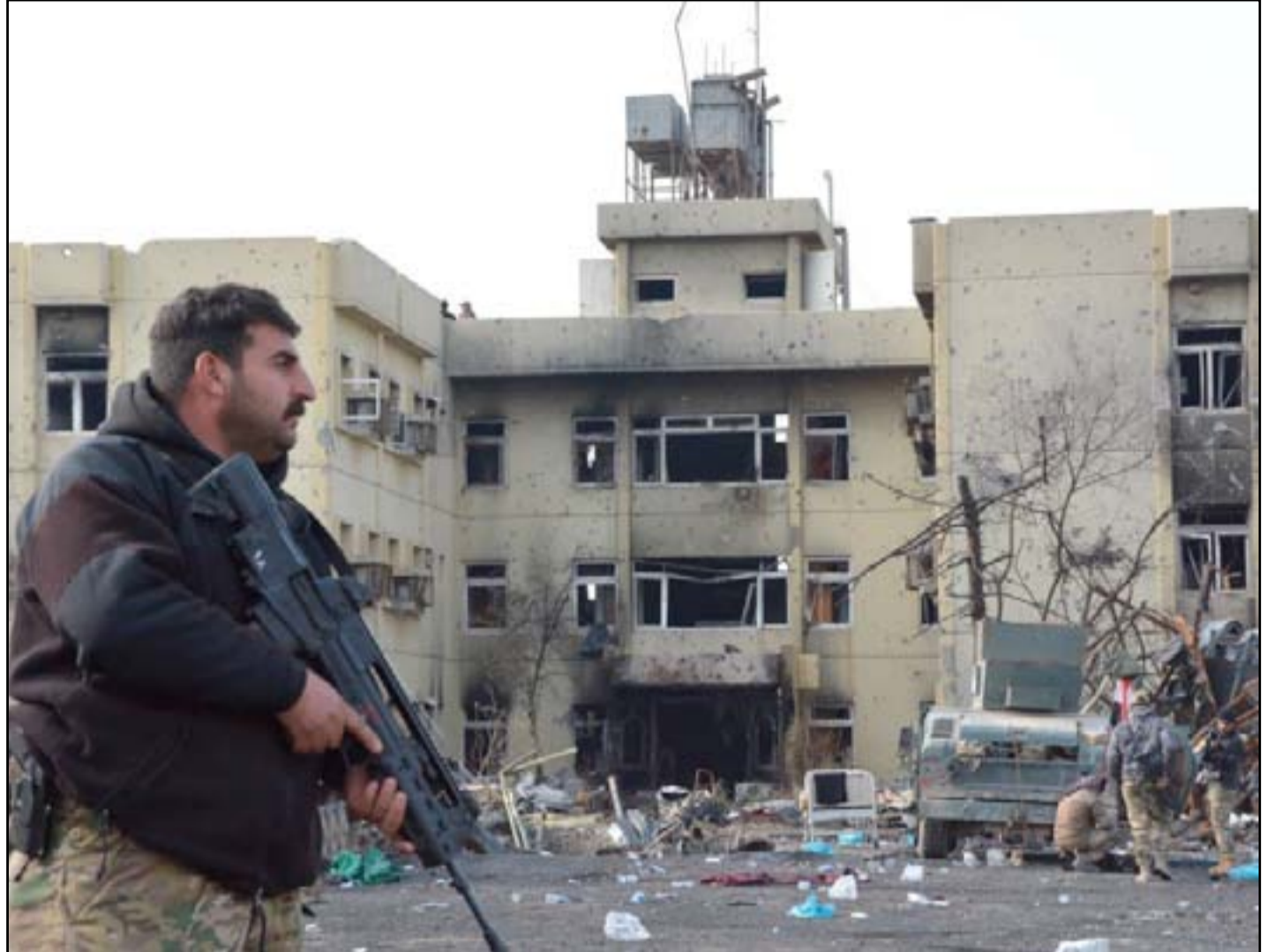
قوة من مكافحة الإرهاب في مستشفى السلام شرقي الموصل

مهمة، هذا العمل هو جزء من حملة مشتركة لإحياء المناطق التي هرب منها المتطرفون في وقت تعاني فيه الحكومة من ضائقة مالية ولا تستطيع المساعدة، في القرى الصغيرة خارج المدينة، يقوم الأهالي بترميم الساحات وإزالة النفايات، أما داخل المدينة فيقوم الأهالي بمحو جداريات داعش التي كانت تظالمهم بدفع الضرائب، ورسم العلم العراقي وحمامات بيضاء تحمل أغصان الزيتون بدلاً عنها. يجري إعادة البناء رغم أن سكان الموصل لم يستلموا رواتبهم منذ أكثر من سنتين، حيث قطعت الحكومة المركزية الرواتب لمنع تمويل داعش ولم تعيدها حتى الآن. ويقول الكثير من الأهالي أنهم يعيشون على تقاعد أقربائهم من كبار السن حيث