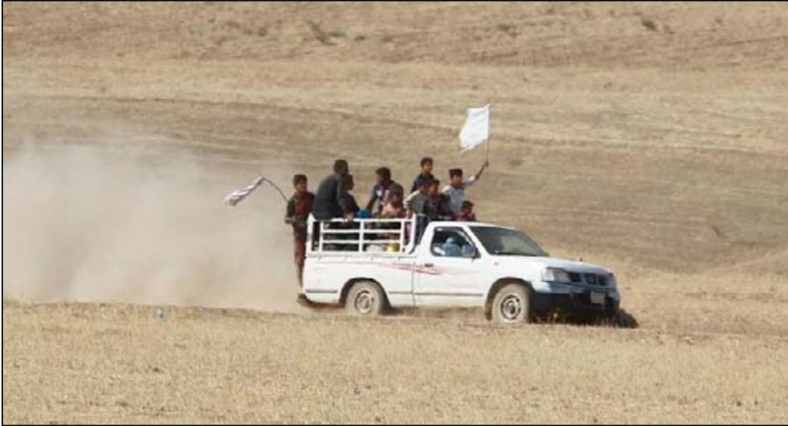
سيارة تقل مواطنين فارين من مناطق القتال ضد تنظيم داعش

عبوات التنظيم قتلت والدته وشقيقته أثناء هروبهم نحو كركوك