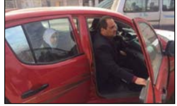
الضابط الذي ضرب مديرة مدرسة في اعتداء سابق

النواب بالتعجيل بتشريع قانون حماية المعلمين الذي ما زال في ادراج البرلمان، مشدداً على اهمية تشريع القانون في رده المتجاوزين على كرامة المعلمين وحرمة المؤسسات التعليمية. لافتة: الى أن القوانين السارية غير رادعة للمتورطين بانتهاك حرمة المؤسسات التعليمية كونها تفرض عقوبة في حال الاعتداء على الموظف من دون أن تراعي انتهاك حرمة المؤسسات التربوية والاعتداء على هيبة المعلم.