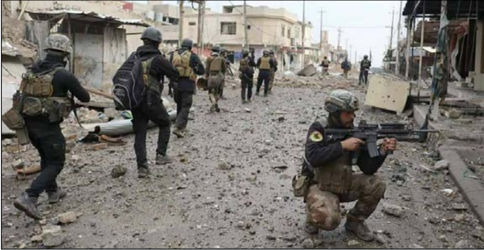
قوة من مكافحة الارهاب في الساحل الايمن

إلى ذلك، تمكنت قيادة عمليات (قادمون يا نينوى) من تحرير عدة أحياء من سيطرة تنظيم داعش غربي الموصل. وقال قائد العمليات الفريق الركن عبد الأمر رشيد يارالله، في بيان له أطلعت عليه (المدى) أمس، إن "قوات جهاز مكافحة الإرهاب حررت حي الصمود بالكامل، في الجانب