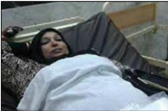
مديرة المدرسة بعد أن تعرضت للاعتداء