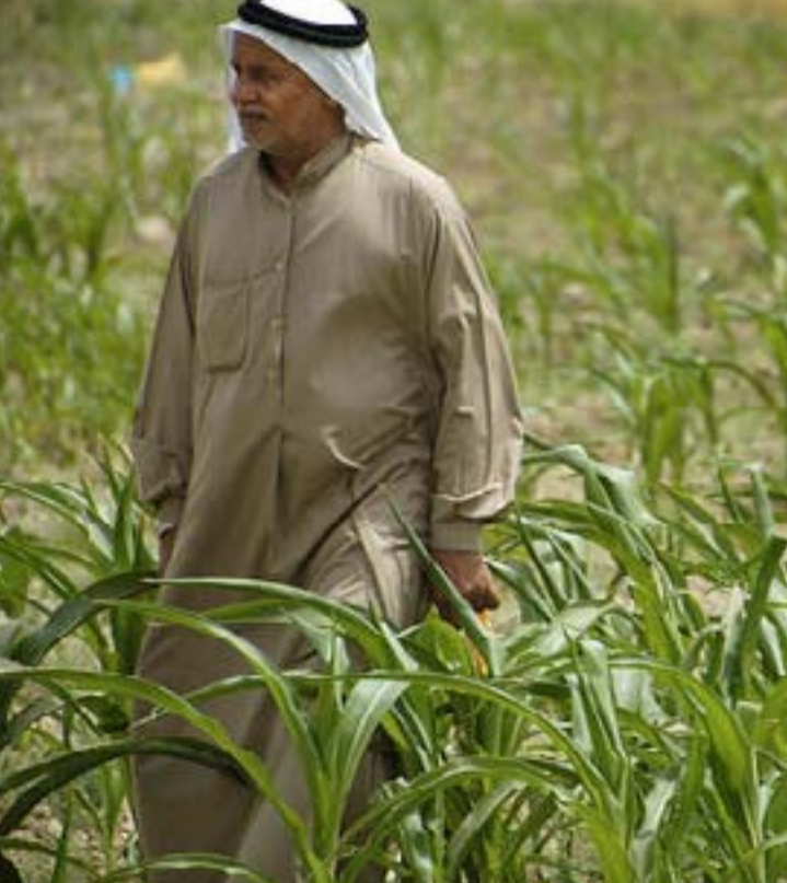
فلاح في مزرعته اثناء موسم الحصاد... وكالات

ونوه الى ان "الحكومة انفقت على هذه الكميات المسوقة كمبالغ شراء من المسوقين اثني عشر ترليوناً وسبعمئة وخمسة وعشرين مليار دينار، حيث امنت الحكومة التخصيصات المالية اللازمة لتغطية مبالغ كل الكميات المسوقة من هذه المحاصيل، حيث سددت الحكومة للمسوقين محصول الحنطة سبعة ترليوناً وخمسة مئة مليار دينار ونسبة ٢٠٪ من مجموع الكميات المسوقة في الموسم المقبل اقل من ٢٠٪ من مجموع المستحقات، كما سددت الحكومة للمسوقين محصول الشعير ترليوناً وثمانمئة مليار دينار ونسبة ٢٥٪ من مجموع المستحقات، اما محصول بنور الحنطة فقد سددت الحكومة