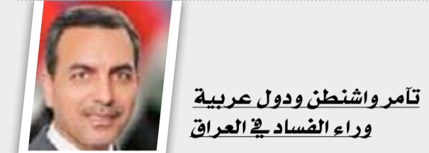
تأمّر واشنطن ودول عربية وراء الفساد في العراق