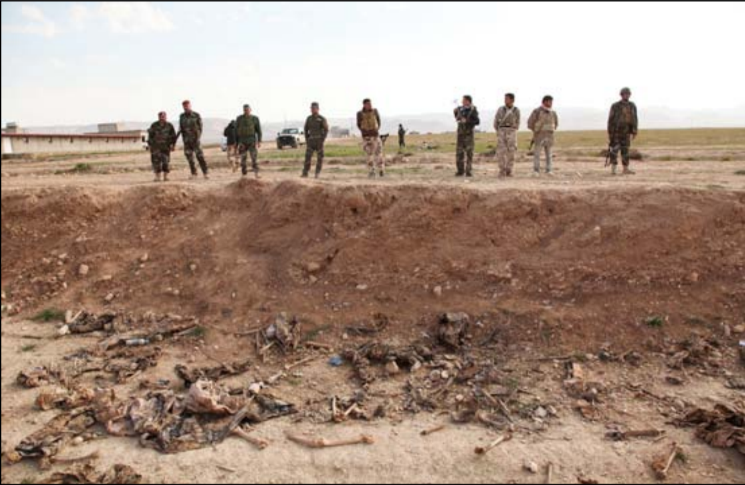
مقبرة جماعية في سنجار... أرشيف

نحو مئتهج بإعدام نحو ٦٠٠ من النزلاء الذكور في سجن بادوش في ١٠ حزيران. وبحسب روايات الناجين، كانت الأغلبية الساحقة من القتلى من الشيعة. وأوضحت المنظمة، في بيان لها، انه "بعد الاستيلاء على سجن بادوش قرب الموصل، قام مسلحو تنظيم داعش، بفصل الرجال الشيعة على الركوع بطول حافة واد قريب، وأطلقوا عليهم النار من بنادق هجومية وأسلحة آلية"، بحسب ما قال ١٥ سجيناً شيعياً ممن نجوا من المذبحة للمنظمة الحقوقية. ووفقاً لروايات الناجين فإن "المسلحين قاموا كذلك بقتل عدد من النزلاء الأكراد والإيزيديين". وقالت النائبة العراقية فيان نخيل آنذاك أن التنظيم يحتجز أكثر من ٥٠٠ امرأة أيزيدية في سجن بادوش.