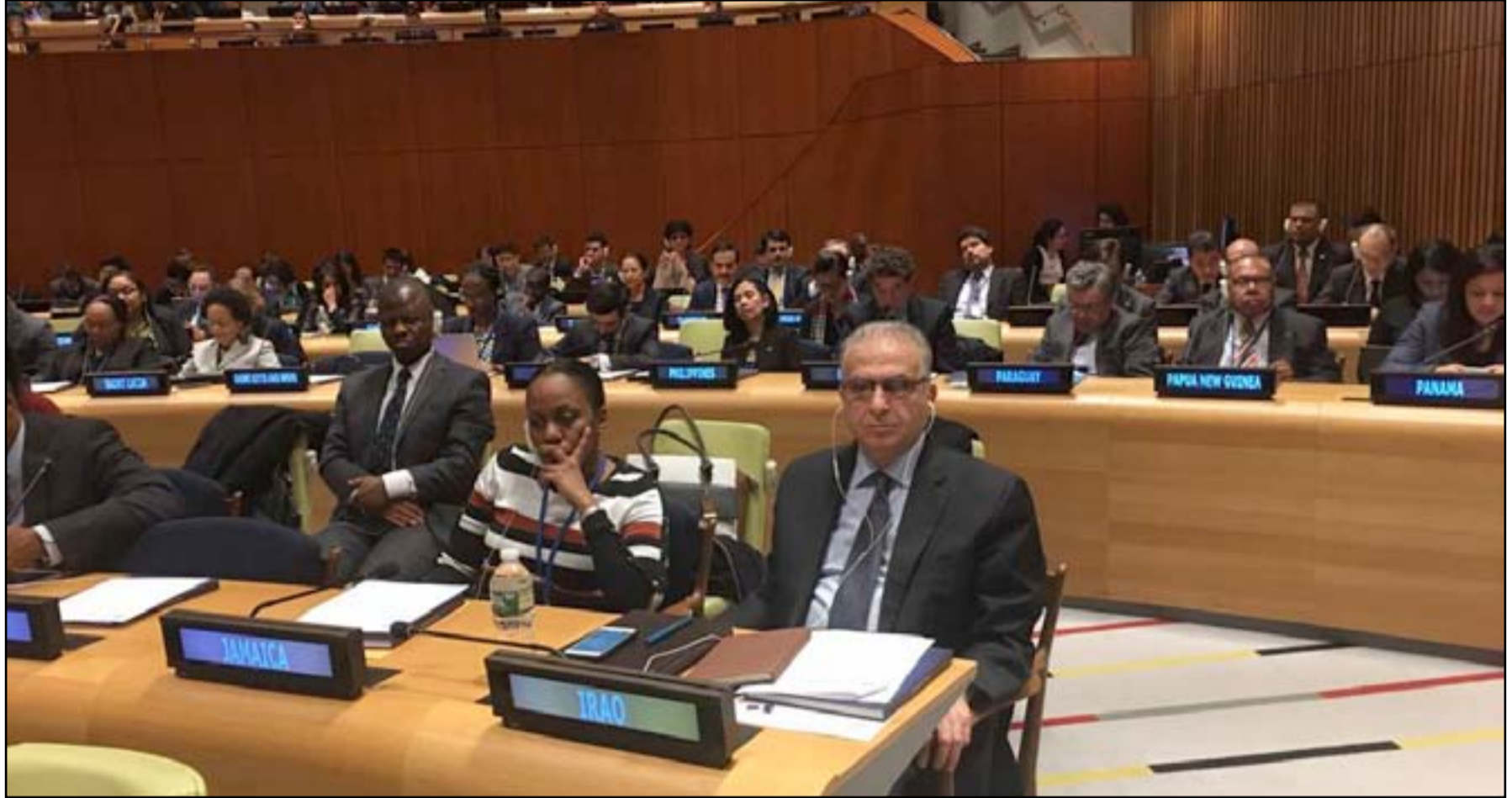
سفير العراق في الامم المتحدة