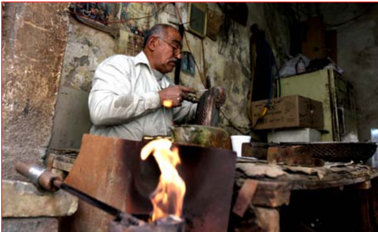
حرفي في سوق الصنابير...

البرلمان يستعد للنظر بإقالة رئيس هيئة الاتصالات