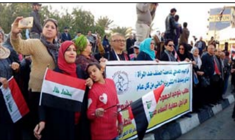
تظاهرة نسوية في بغداد تندد بالعنف ضد المرأة... (أرشيف)

خطوة باتجاه تحقيق كامل الأهداف"، مشيرة إلى ان "الرابطة لعبت دوراً ريادياً متميزاً في النضال العام لشعبنا العراقي وقدمت عبر مسيرتها الطويلة تضحيات كبيرة وكان لها شرف المساهمة في جميع مواقف الشعب ووثاباته وانتفاضاته ووقفت مع بنات وأبناء شعبنا بجرأة وصلابة لتصرخ بوجه الدكتاتورية الفاشية. وبعد سقوط النظام الدكتاتوري سارت عضوات الرابطة إلى المساهمة في بناء العراق الديمقراطي الجديد". ولفت البيان الى ان "الرابطة عملت مع الحركة النسوية على ضمان المشاركة السياسية الحقيقية للمرأة في صنع القرار السياسي عبر تطبيق نظام الكوتا في الانتخابات والعمل على مناهضة كافة أشكال العنف الموجه ضد المرأة والطفل ورسد الانتهاكات التي تتعرض لها المرأة وإلغاء كافة القرارات والتشريعات التي تمتهن كرامة المرأة وتحط منها، وساهمت في كتابة تقارير الظل وكتابة الرسائل التي عبّرت فيها عن حاجة المرأة للدعم للوصول إلى حقوقها الكاملة كما عملت ضمن شراكة متعددة القطاعات على كتابة خطة الوطنية لقرار مجلس الأمن ١٣٢٥ المعني بضمان مشاركة المرأة في بناء الأمن ومفاوضات السلام كما تشاركت العمل ضمن الفريق الوطني على المساهمة في كتابة خطة الطوارئ المعنية بتوفير الاحتياجات الخاصة للنساء والفتيات النازحات وتسعى مع المدافعات والمدافعين عن حقوق المرأة للضغط نحو إقرار تشريع قانون خاص لتجريم مرتكبي العنف ضد المرأة تحت أي مسميات كانت".