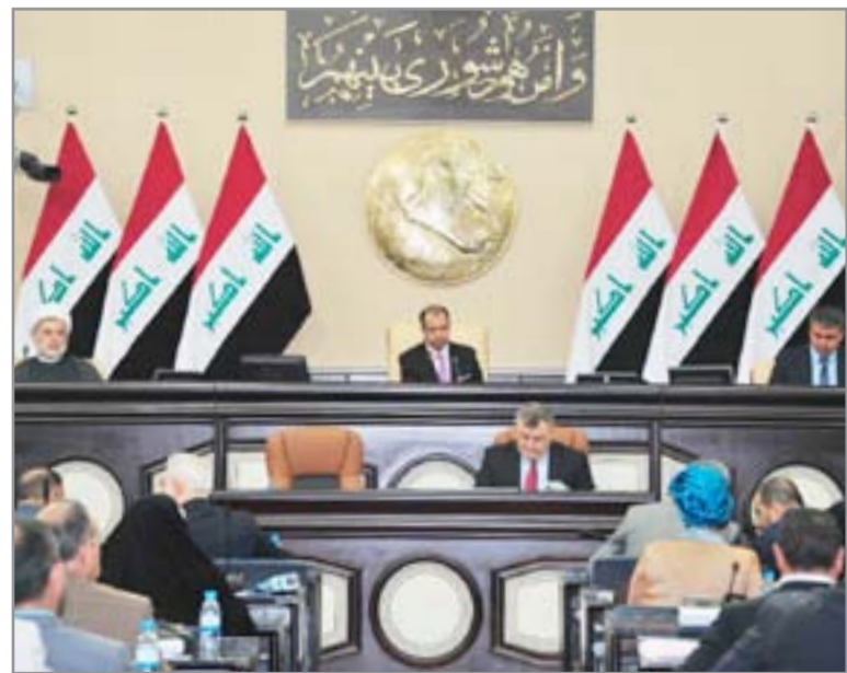
التي تكشف استغلال الترددات بشكل غير قانوني وتحقق فائدة اقتصادية وأمنية".

وقال المصدر، في بيان اطلعت عليه (المدى) أمس، إنه "بعد أن طرحنا مشروع إصلاح الانتخابات وانتخاب الإصلاح، ومشروع ما بعد تحرير الموصل، صار لزاماً علينا تشكيل لجنة خاصة للعمل الدؤوب من أجل الوصول إلى تطبيقها بصورة مرضية".