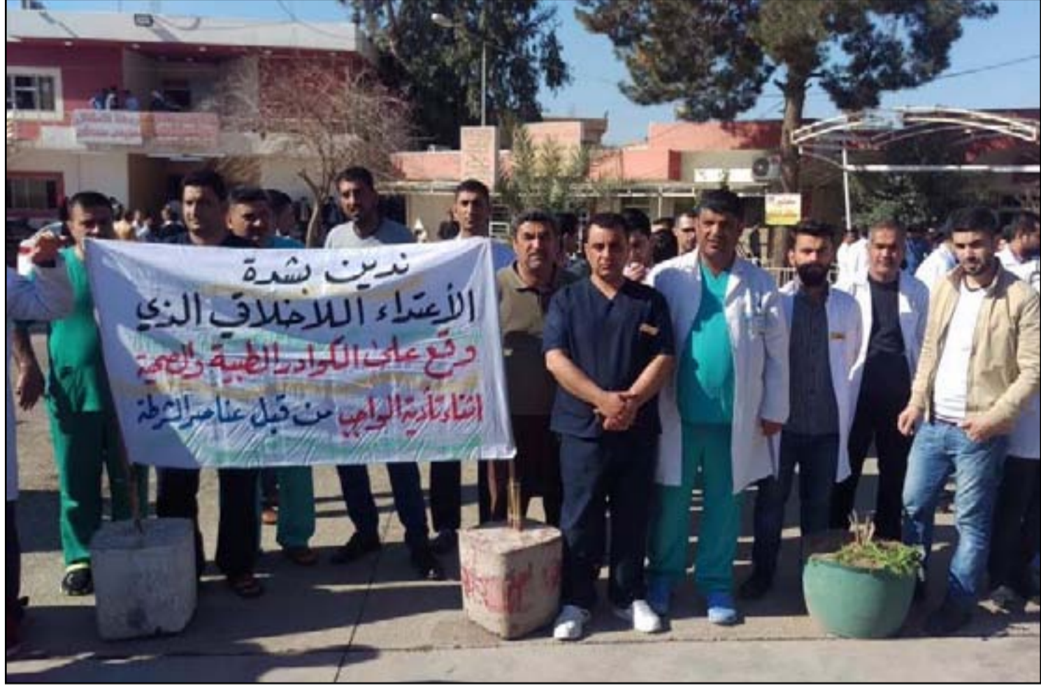
تظاهرة لطباء كركوك ضد الاعتداءات الأخيرة

طالبوا بتفعيل حماية الكوادر الصحية ومنع المظاهر المسلحة الحكومة المحلية: سنقدم المعتدين إلى القضاء لمحاسبتهم قانونياً