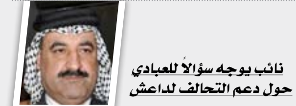
نائب بوجه سؤالاً للعبادي حول دعم التحالف لداعش

كشف النائب عن ائتلاف دولة القانون محمد الصيhood، عن تقديم احد النواب، لم يذكر اسمه، لرئاسة مجلس النواب سؤالاً شفهيًا موجها لرئيس الوزراء القائد العام للقوات المسلحة حيدر العبادي بشأن دعم التحالف الدولي بقيادة واشنطن لتنظيم "داعش". وقال الصيhood إن "أحد أعضاء مجلس النواب سلم رئاسة البرلمان سؤالاً نائباً للقائد العام للقوات المسلحة حيدر العبادي إزاء جدية التحالف الدولي بقيادة واشنطن في استهداف عصابات داعش الإجرامية من جهة وإلقاء المساعدات اللوجستية لعناصر داعش من جهة أخرى". وأضاف الصيhood، أن "رئيس مجلس النواب سليم الجبوري تسلم عدداً من الأسئلة النيابية لكنه لم يجسد وقتاً للمضي بها"، مبيناً أن "البرلمان ينتظر تحديد موعد للشروع بمساءلة العبادي".