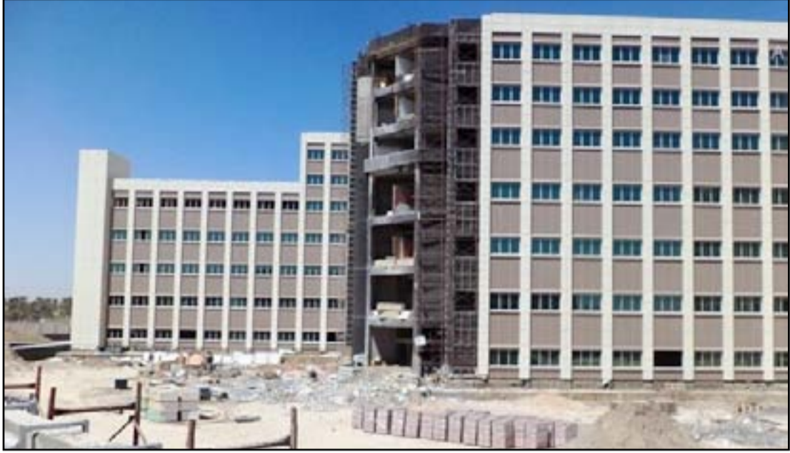
مشروع المستشفى التركي يصاب بالثكوى في ذي قار

وكانت هيئة استثمار ذي قار منحت ٣٦ رخصة استثمارية في جميع القطاعات الاستثمارية من بينها تراخيص لـ ١٧ مشروعاً استثمارياً في قطاع الإسكان يتوقع ان توفر ١٥ ألف وحدة سكنية جديدة حال انجازها.