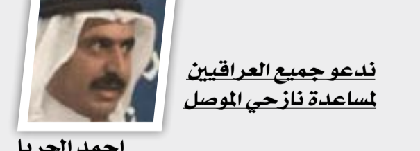
ندعو جميع العراقيين لمساعدة نازحي الموصل