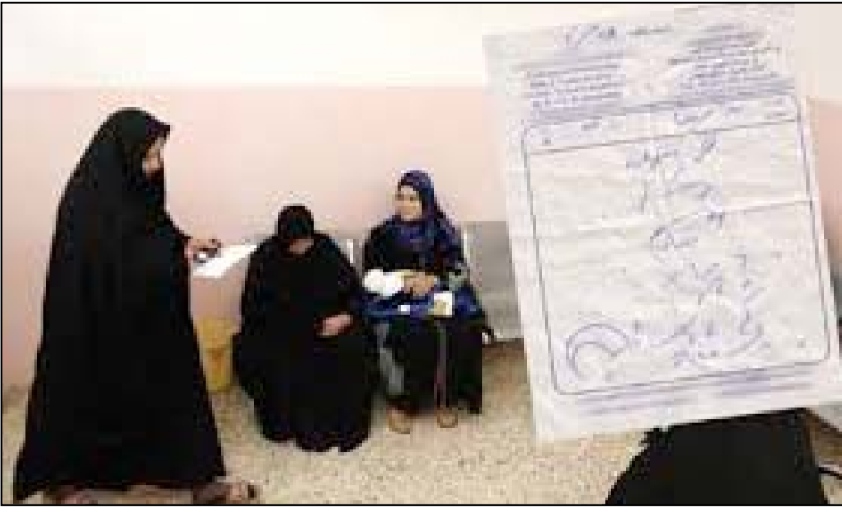
الطبية بشكل واضح ومفصل، كي تسهل عملية الصيدلي. مؤكدا:

نقابة الصيدلة وحسب الأمر النقابي المرقم 277 الصادر في 2917-8-2 قررت محاسبة ومنع كل وصفة تحمل شفرة خاصة بين الطبيب والصيدلية التي تحتها أو متفق معها، وسيتم محاسبة المخالفين بشدة وصرامة خدمة للصالح العام، لأن الوضع اصبح لا يطاق.