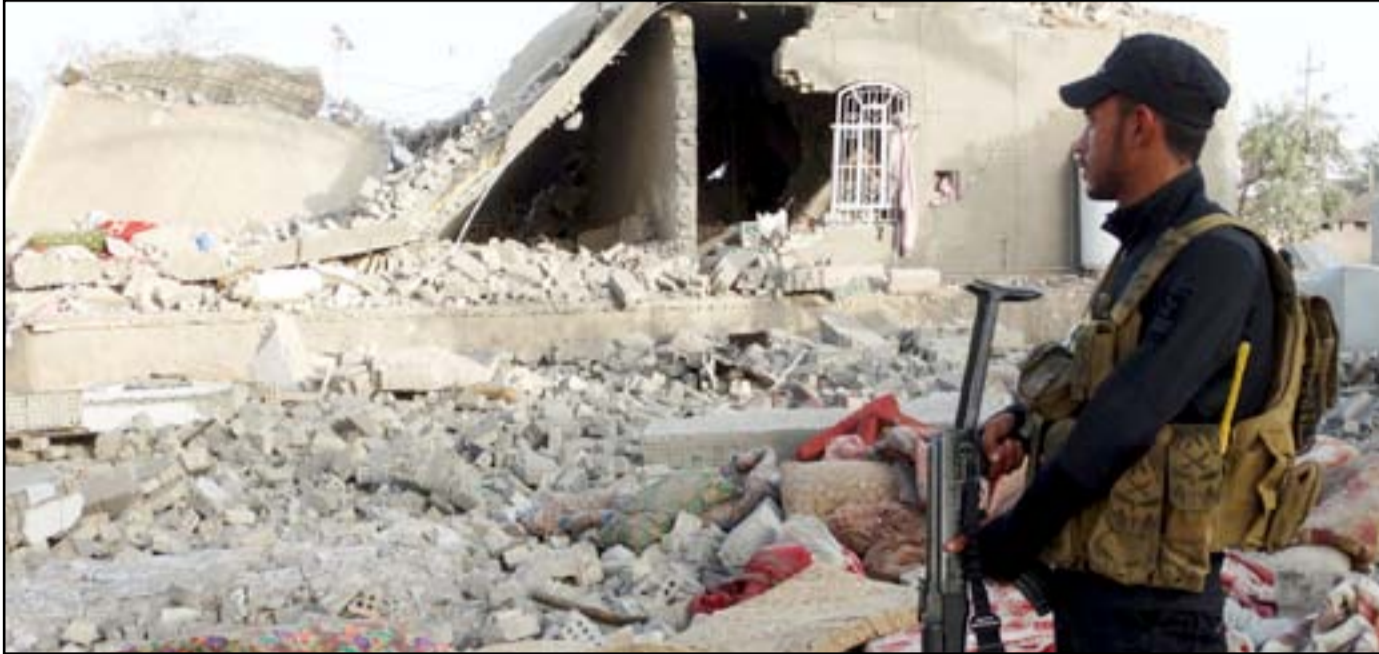
آثار دمار خلفه داعش في الرمادي... أرشيف

وتابع البيان، أن "تركيز برنامج الأمم المتحدة، للمستوطنات البشرية في الرمادي إنصب على إعادة تأهيل الوحدات السكنية في اثنين من الأحياء، ألا وهما: حي التأميم والكيلو 7، حيث لحقت بكلا الحيين أضرار بالغة.