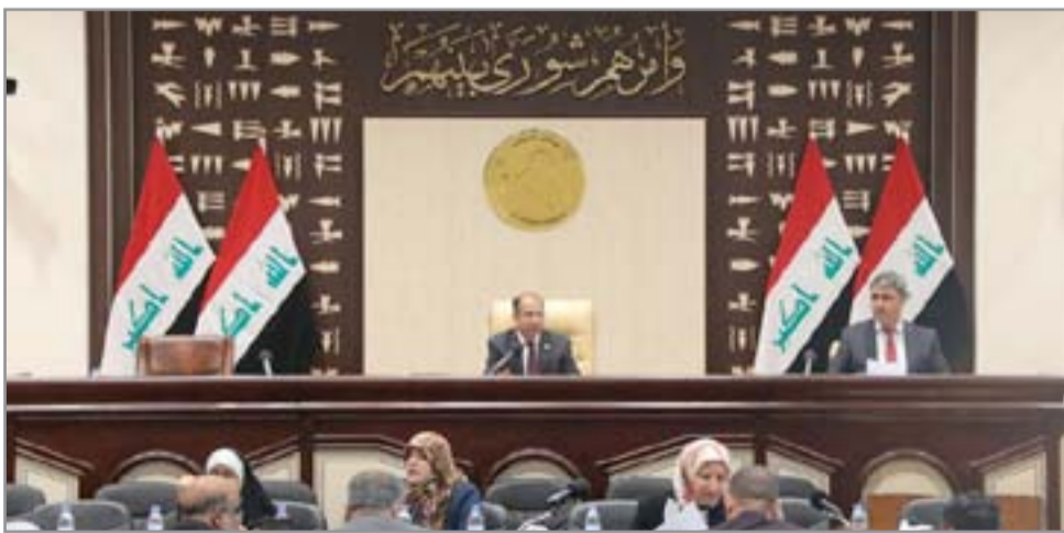
اجتماع مجلس الوزراء

الذي ذلك، طالب محافظ نينوى نوفل حمادي ب"اتخاذ قرار باعتبار محافظة نينوى منكوبة بسبب الوضع الأساوي للنازحين في المخيمات ووجود نقص في الأجهزة الطبية