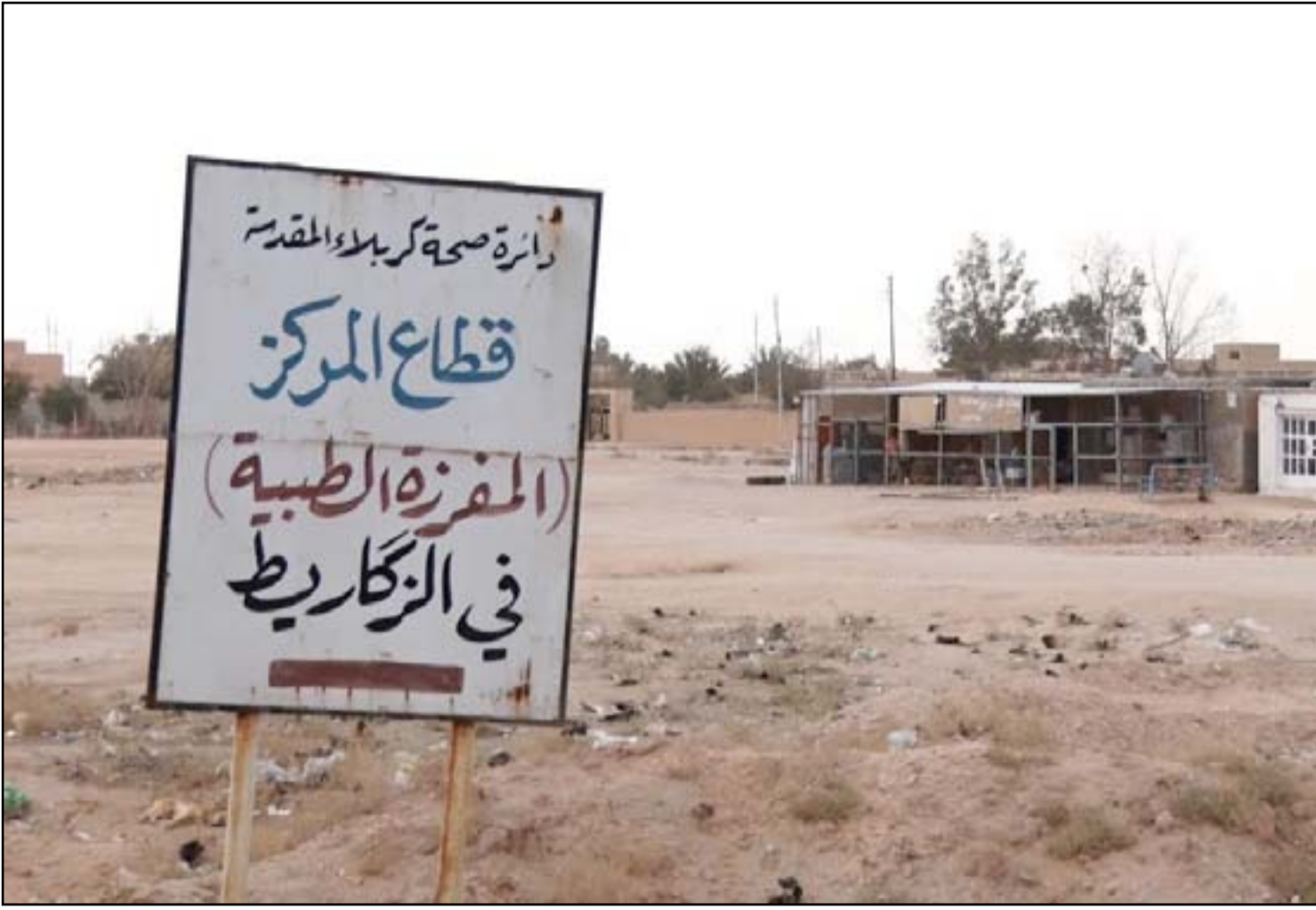
مدخل قرية الزكاريط غربي كربلاء

وتابع الأعرجي "لدينا ضوابط تخطيطية ومعايير ومحددات لإنشاء المراكز الصحية في القرى البعيدة عن