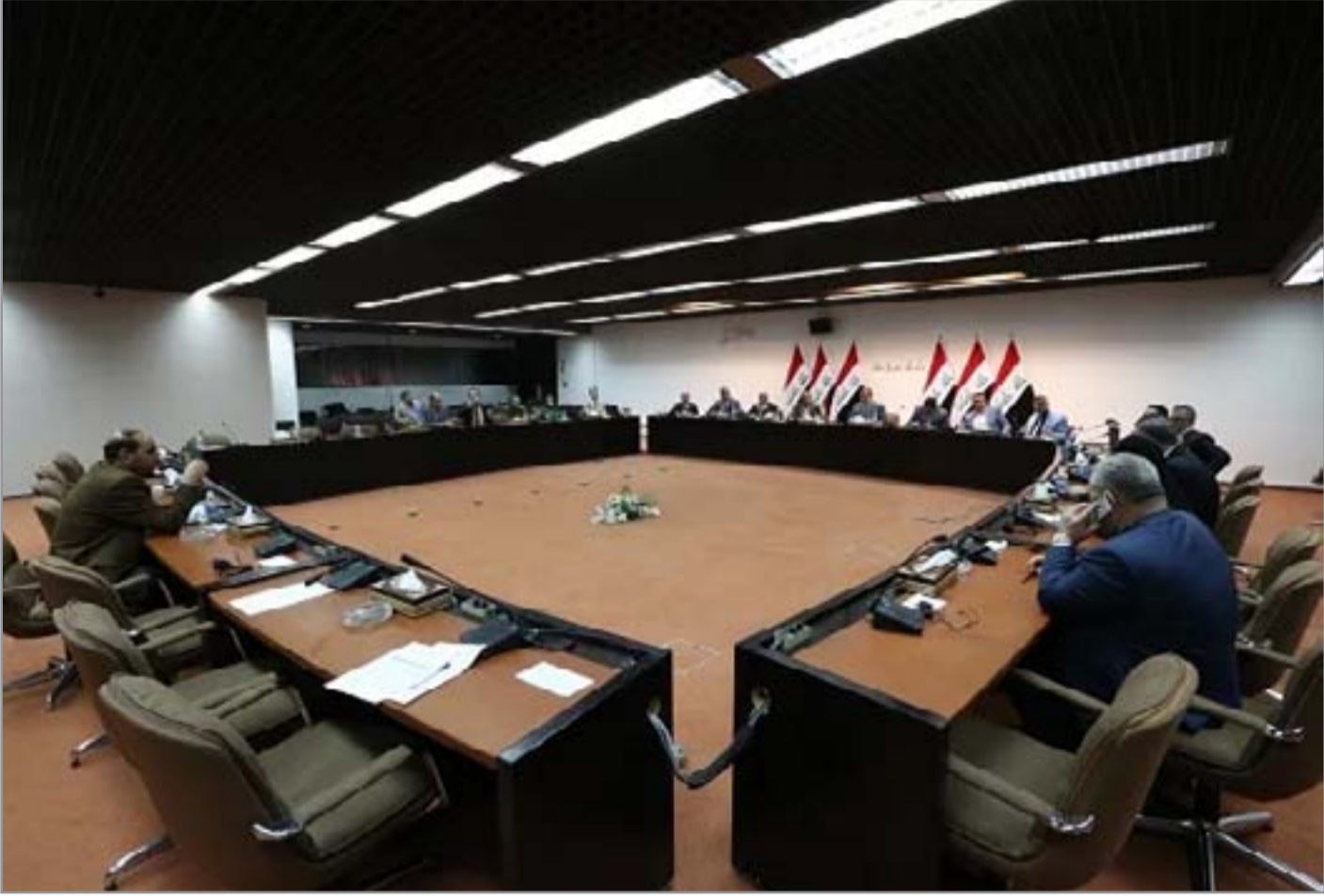
اجتماع لجنة الخبراء

يدور خلاف حول شكل ومواصفات استمارة الترشيح وإمكانية إطلاقها في الموقع الإلكتروني ويقول عضو كتلة الجماعة الإسلامية الكردستانية إن "المشكلة تكمن بوجود رأيين ستكون على شكل استمارتين، الأول يريدمج استمارتي الترشيح والتقييم بإستمارة واحدة، والرأي الثاني يفضل أن تكون هناك استمارة للترشيح