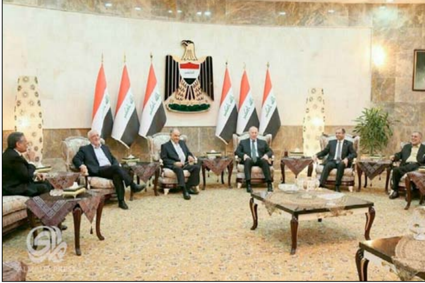
قيادات تحالف القوى في اجتماع سابق.. أرشيف

رغم مرور أكثر من إسبوعين على انعقاد مؤتمر أنقرة، إلا أن الخلاف بين القوى السنية ما زال مستمرا بشأن الموقف من التسوية، والجهة التي تتولى مهام تسليم ورقة المكون إلى ممثل الأمم المتحدة. ولم تنجح اللجان المصغرة التي شكلها تحالف القوى بهدف تحجيم الخلافات والتفاهم على آلية لتسليم ورقة التسوية التاريخية إلى المبعوث الأممي. ويدور الانقسام السني بين فريقين، الأول يمثل سنة الخارج، الذين لا يرون جدوى من طرح مشروع التسوية في ظل الظروف الراهنة، وبين فريق آخر يمثل سنة الداخل المشاركين في العملية السياسية الذين يبدون تحمسا واضحا للمضي بالمشروع دون وضع شروط مسبقة. وبحسب مصادر من داخل اتحاد القوى العراقية أكدت إن مؤتمر أنقرة زاد من حدة الانقسامات داخل البيت السني وصل حد المواجهة بين سنة الخارج الذين لا يعترفون بالتسوية ويطلبون بتجميدها، وبين سنة الداخل الذين شاركوا بكتابة ورقة التسوية، ويريدون تسليمها إلى الأمم المتحدة. وشهدت العاصمة التركية أنقرة، مطلع الشهر الجاري، اجتماعات مغلقة استمرت لمدة يومين من الشهر الحالي، وشارك في الاجتماعات ٢٥ شخصية سياسية وعشائرية ورجال أعمال من المكون السني في لقاء عُدّ امتدادا للقاء جنيف. وكانت مصادر سياسية كشفت ل(المدى)،