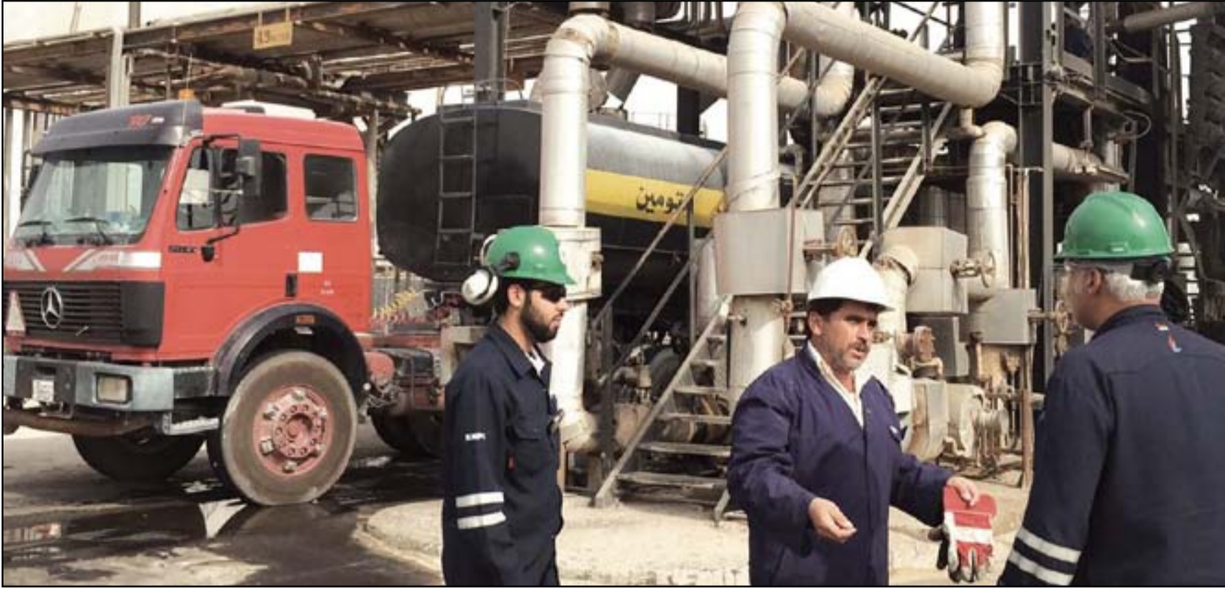
عمال شركة نفطية في واسط

واسط المحلية بذلك. وأعلنت لجنة الطاقة في مجلس محافظة واسط، الثلاثاء ٢٠ ايلول ٢٠١٦، موافقة وزارة النفط على إنشاء مصفاة نفطية في المحافظة هو الأول من نوعه، وفيما كشفت أن لجنة من الخبراء بدأت بإعداد الدراسة للمصفاة وتحديد موقعه، أكدت أن شركة شل الفرنسية هي "الأوفر حظاً" لتنفيذ المشروع.