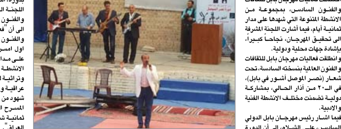
حفلي غنائي في مسرح بابل الاثري

وقال الشلاه في كلمة القاها في ختام فعاليات مهرجان بابل، إن "المهرجان بدورته