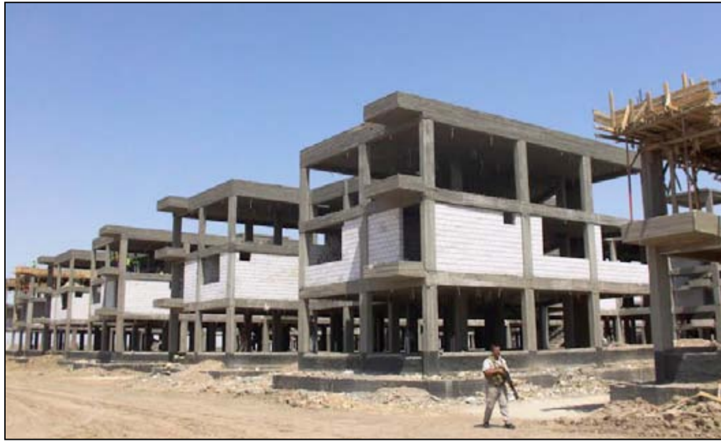
مشاريع سكنية مملوكة في ذي قار