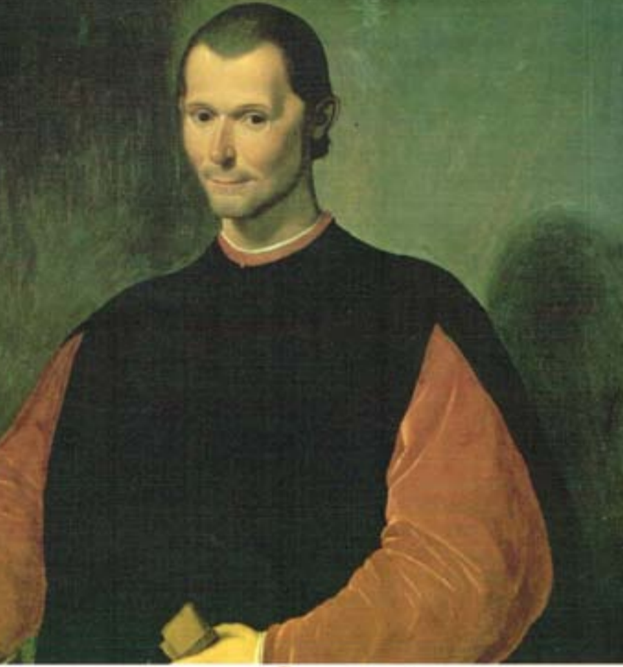
شروق بنجوين Shorouk Penguin يقولون ماكيافلي الأمير

×××× المقدمة التي سبقت الأمير قبل نشر كتاب الامير ليكافيللي بمنة وثلاثين عاما وصل الى القاهرة قادماً