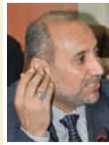
عظوان العظواني محافظ بغداد

"ان قضاء الحسينية يعاني كثيرا ومشروع المجاري قد أوقف الكثير من المشاريع الأخرى كالتبليط والماء والإنارة وهذه المسؤولية تقع على عاتق وزارة البلديات، والتي وعدت المحافظة بإكمال المشروع بعد موافقة مجلس الوزراء على تخصيص الأموال لهذا المشروع، إن أسباب تأخير تنفيذ المشاريع في القضاء هي تأخر الموازنة والروتين والتعقيدات الإدارية وعدم تعاون الجهات الحكومية خلال الفترات السابقة".