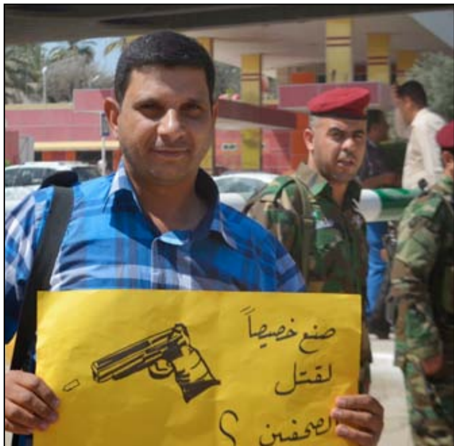
صحفي في الديوانية يتظاهره ضد قمع حرية التعبير