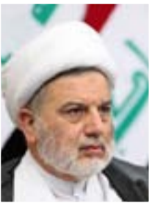
همام حمودي نائب رئيس البرلمان

"نتم دور هيئة النزاهة ومفتشية وزارة المالية لدورها وتعاونها بضبط ١٤ حاوية محملة بأدوية تم إدخالها إلى ميناء أم قصر بموجب معاملات استيراد مزورة ودون موافقة وزارة الصحة، ونطالب بفرص رقابة صارمة على الأدوية المستوردة ومنع التعاقد إلا من دول رصينة ومجازة عالميا، ويجب تكثيف جهودها وتعاونها مع نقابة الصيادلة في رقابة الأدوية الموجودة في الأسواق".