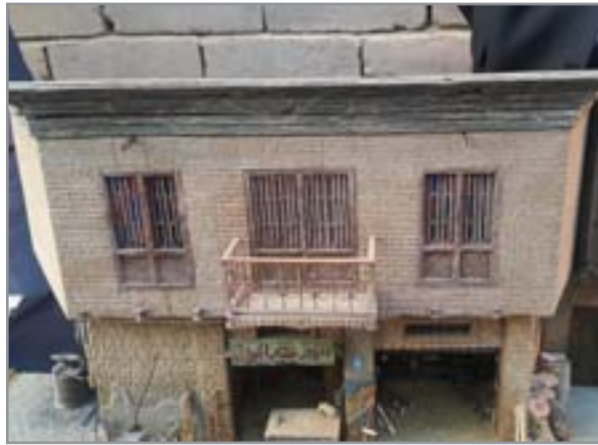
مصغرات لببوت الشنايل

المشاركة خلال تلك الفعاليات، حيث عرضت العشرات من مصغرات السيارات التي كانت تسير بشوارع العراق قبل عام ٢٠٠٠ من سيارات الحمل وسيارات الريم ونصف الريم وسيارات (دك النجف) والنقل العام بألوانها وغيرها"، لافتاً إلى أن "تلك الأعمال أقوم بصناعتها من مواد خاصة قوية ومتينة وتولنيها بألوانها الأصلية لتكون