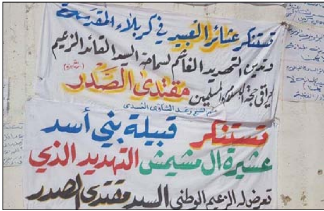
لافتات تضامان قرب منزل الصدر في النجف