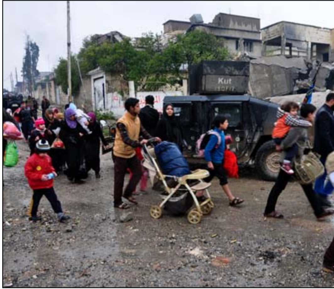
أسر نازحة من غرب الموصل... (أ ف ب)

بالنسبة لما يقارب من ٦٠٠ الف شخص مايزالون عالقين ويعانون من شحة المواد الغذائية والمياه والوقود والتجهيزات الطبية. وقالت وكالة اللاجئين التابعة للأمم المتحدة الخميس ان ١٥٧ الف شخص قد وصلوا الى مركز استقبال سكان المدينة الهاربين من ظروف القتال في الموصل . وتقول المتحدث عن منظمة اوكسفام لغوث اللاجئين في العراق امي كريسيان