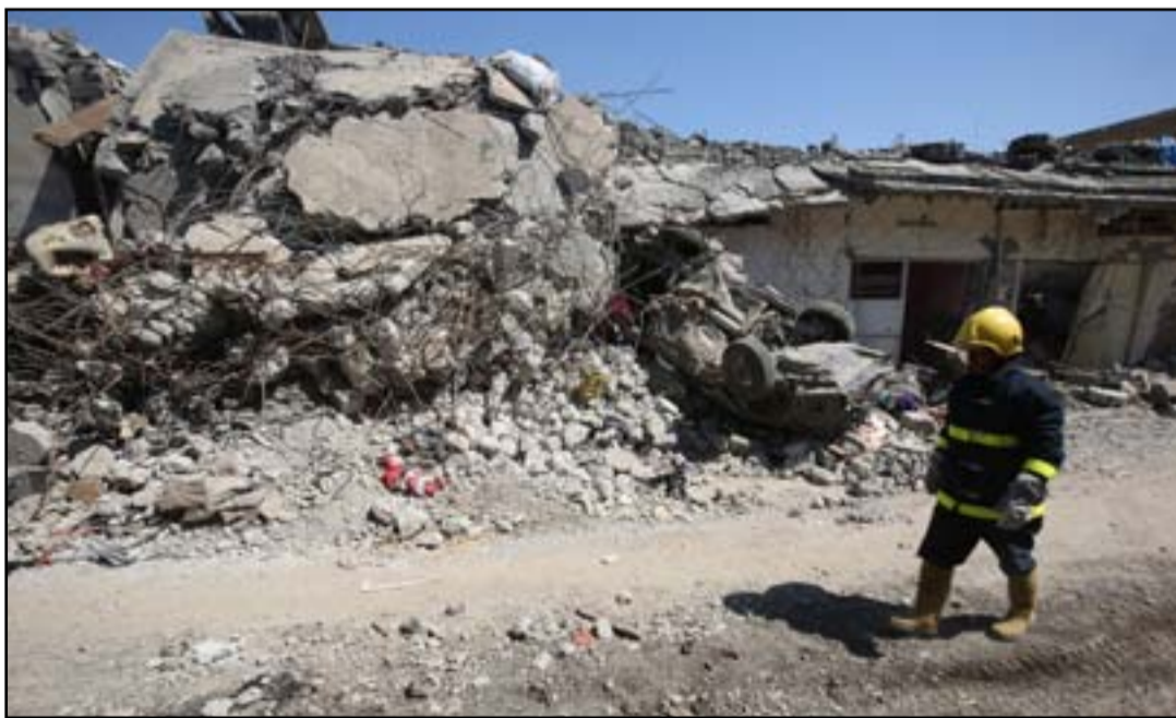
دمار خلفته غارة جوية على ايمين الموصل

لمحس مكان البيت الذي تناقلته وسائل الإعلام وتبين أن البيت مدمر بشكل كامل ١٠٠ بالمئة، وجميع جدرانها مفخخة ولا توجد أي حفرة أو دالة على أنه تعرض إلى ضربة جوية. ووجد بجواره عجلة كبيرة مفخخة مغمورة وتم إخلاء ٦٦ جثة منه".