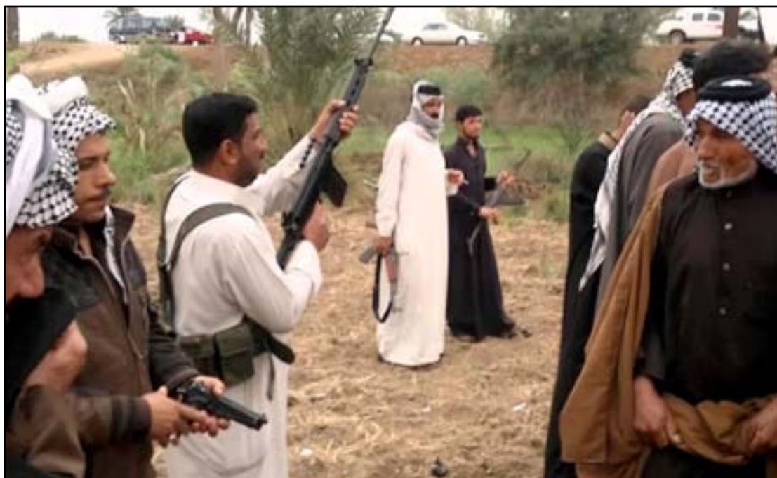
نزاع عشائري في محافظة البصرة ... أرفيف

تعد له قوى غربية واقليمية لما بعد مرحلة داعش، يتضمن أولا حل الحشد الشعبي.