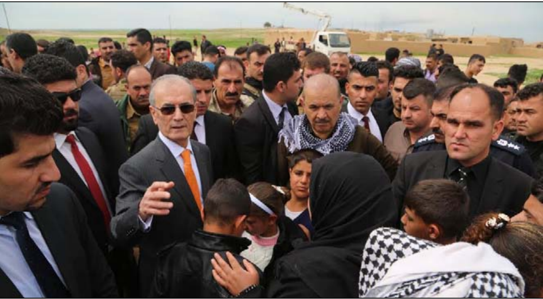
محافظ كركوك نجم الدين كريم في قره تبه

العراق بشأن رفع العلم الكردستاني في المحافظة، بالقول إن "الدستور العراقي لم ينص على عدم إمكانية رفع العلم الكردستاني في المحافظة، و ان قرار رفع العلم جاء لتعميق أواصر الاخوة بين مكونات المحافظة التي سنتعمق أكثر". وتابع كريم انه "لا يحق لأية جهة خارجية ان تتدخل في شؤون كركوك، لكون أن الأمر داخلي وخاص بمكونات المحافظة"، مجددا دعوته الى مجلس المحافظة "للاسراع بالتصويت على قراره برفع العلم". ووصفت (يونامي) قرار رفع العلم الكردستاني في محافظة كركوك بأنه "خطوات أحادية" قد تعرض التعايش السلمي بين المكونات فيها "للخطر". وقالت بعثة الأمم المتحدة في بيان لها امس، انها "هي المعنية بالقرار الأخير الذي اتخذه محافظ كركوك نجم الدين كريم على رفع العلم الكردستاني من فوق قلعة كركوك، مضيفة انها "تلاحظ ان حكومة العراق قد اوضحت انه بموجب الدستور كركوك تقع تحت سلطة الحكومة المركزية، وانه لا ينبغي رفع العلم في محافظة أخرى غير العراق". وكان محافظ كركوك نجم الدين كريم، قد اصدر قرارا في ١٦ من الشهر الحالي برفع العلم العراقي إلى جانب علم إقليم كردستان على قلعة المحافظة التاريخية ومباني الحكومة في الخاطبات الرسمية مناسبة اعياد نوروز، مدعيا أن علم كردستان لا يخص الكرد وحدهم بل هو للجميع وللمكونات الأخرى التي تعيش في الإقليم وضمنها المكونات التركماني والعربي.