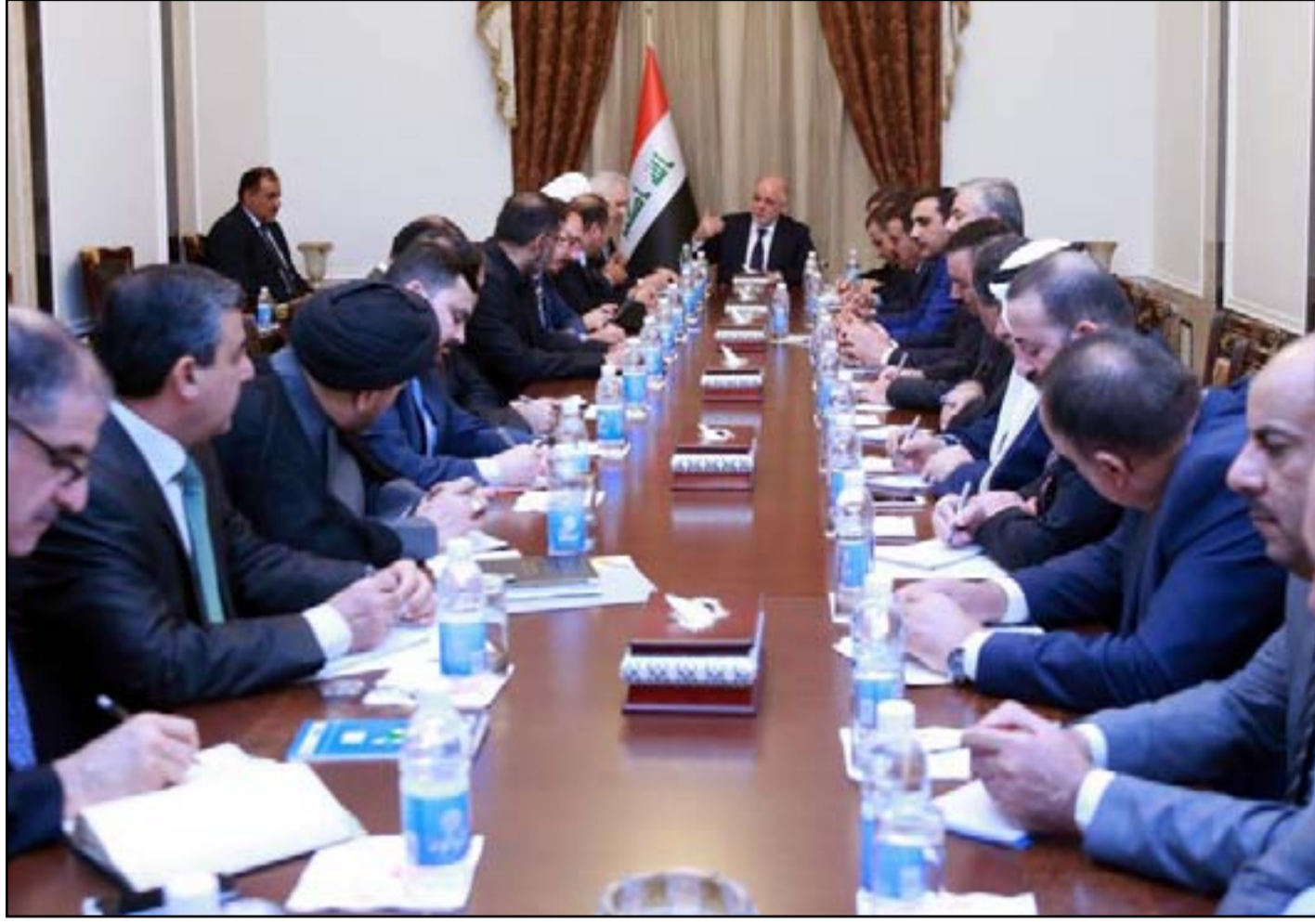
اجتماع العبادي مع التحالف الوطني واتحاد القوى .. ارشيف

وكشف القيادي في حزب الدعوة النائب علي العلق عن دعوة وجهها مكتب رئيس مجلس الوزراء حيدر العبادي إلى رؤساء وممثلين الكتل السياسية في البرلمان للحضور لاطلاعهم على نتائج زيارته الأخيرة إلى واشنطن. "متمنيا أن يكون هذا اللقاء بديلا عن جلسة الاستضافة التي دعا لها البرلمان. ويصف النائب المقرب من العبادي، في تصريح لـ (المدى) امس، انتقادات