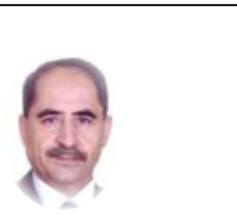
□ لويس إقلييس

ليلة الثلاثاء ٢٠ كانون الأول ٢٠١٦، تكوّرت ذات الفعل الإرهابي في برلين الألمانية، بطابعه العنصري المتنامي، شبيهه الجريمة التي اترقت في مناطق أخرى من أوروبا، ومنها مدينة نيس الفرنسية قبل أشهر، وبالذات في ١٤ تموز من العام الماضي، ضد حشد من المواطنين الأبرياء كانوا يحتفلون بالعيد الوطني لفرنسا، في حينها، راح ضحية ذلك الاعتداء الإجماعي، ٨٦ قتيلًا وأكثر من ٤٠٠ جريح، لتضاف إلى قافلة قتلى سيقوهم قتل عام في أحداث شهدتها مدنٌ فرنسية أخرى، لا تقل مأساوية حين حصدت أكثر من ٢٣٠ قتيلًا أيضًا. وبالرغم من ضالة الضحايا في اعتداء برلين، حيث تحدثت مصادر عن مقتل ١٢ شخصًا فقط وجرح أكثر من ٤٠ آخرين في عملية دهس بشاحنة اقتحمت سوقًا تحتفل تقليدياً بعيد الميلا، إلا أن الحادثة الجديدة، قد أعادت مرة أخرى، أشكالاً من مشاعر الغضب والربح والاحتجاج على سياسات بلدان الاتحاد الأوروبي غير المنضبطة، ولاسيما سياستها في استقبال موجات اللاجئين من دون تحميص للهوية أو اهتمام بالهوية، فجعل اهتمام أصحاب الفكر المنحرف من المتسللين ما بين اللاجئين الغربيين من بلدانهم العناية، غزوة بلد الكفار والعيش فيها أفرادًا وجماعات على هامش المجتمع ما طاب لهم، لكونوا عالة على دافعي الضرائب وحكوماتهم المهزوزة، اقتناصاً لأية فرصة سانحة للسلطو على الحكم فيها متى ما زادت أعدادهم واستقروا