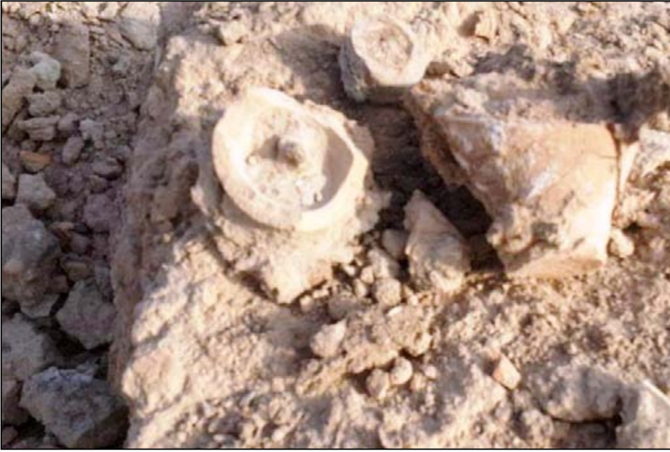
قطع أثرية تعرضت للعبث في ذي قار