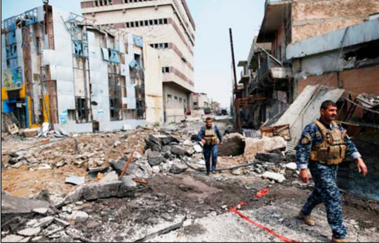
جنود في الشرطة الاتحادية قرب احد المباني المهتمة في المدينة القديمة.. أ.ف.ب

كان من المفترض أن تدخل خطة عسكرية جديدة لتحرير غربي الموصل حيز التنفيذ منذ أيام، إلا أن المعطيات على الأرض تقول عكس ذلك. وتحدث مسؤولون في المدينة، مؤخراً، عن أن القوات المشتركة تروح في مكانها منذ اسبوعين دون إنجازات حقيقية. وجاء تطابق العمليات في الساحل الأيمن، على خلفية سقوط مدنيين في قصف يعتقد بان مصدره طيران التحالف الدولي. وإثر ذلك دعت الحكومة المحلية ومسؤولين آخرين إلى تجنب "العنف المفرط"، والتأكد من المعلومات قبل توجيه الضربات. لكن رغم ذلك لم تتوقف الغارات، واستمرت الحكومة في نينوى تتلقى انباء عن سقوط مدنيين بأعمال القصف حتى أمس الأول.