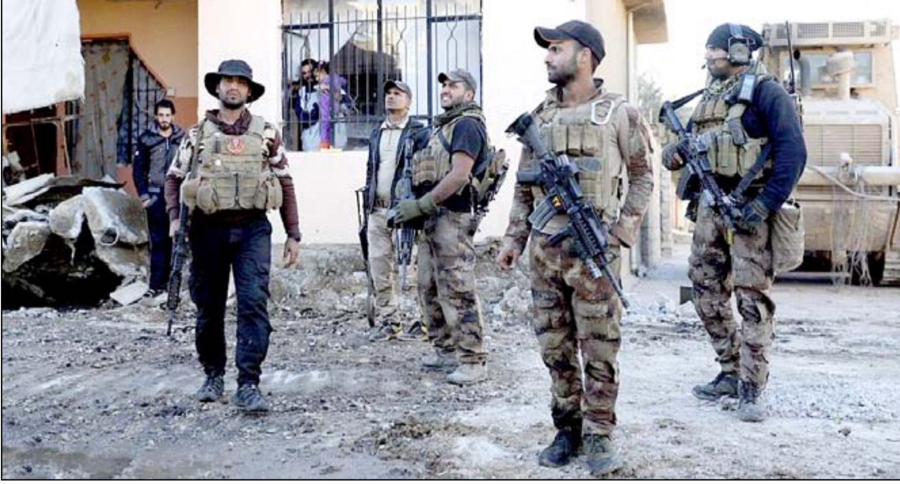
جنود في أحد احياء الساحل الايسر.. (أرشيف)