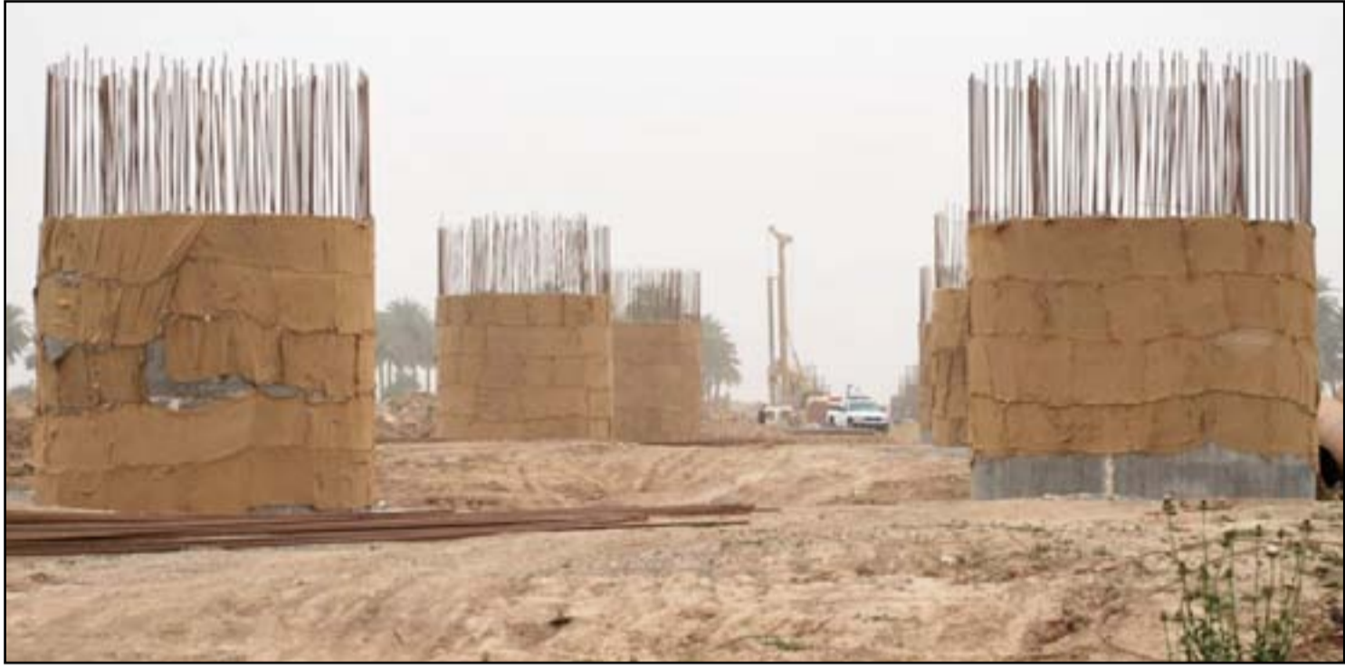
مجسّر شارع الحياة متلكئ منذ ٢٠١٤

شكا مواطنون من أهالي محافظة ميسان، أمس الاثنين، من عشوائية مشروع مجسّر الحسين، وسط مدينة العمارة في مركز المحافظة، مشيرين إلى أن، المشروع قطع أرزاق الكثير من المحال التجارية نتيجة التلكؤ في إنجازه منذ العام ٢٠١٤، فيما عرت الحكومة المحلية توقف تنفيذ المشروع إلى قلة التخصيصات المالية والأزمة الاقتصادية التي تمر بها البلاد.