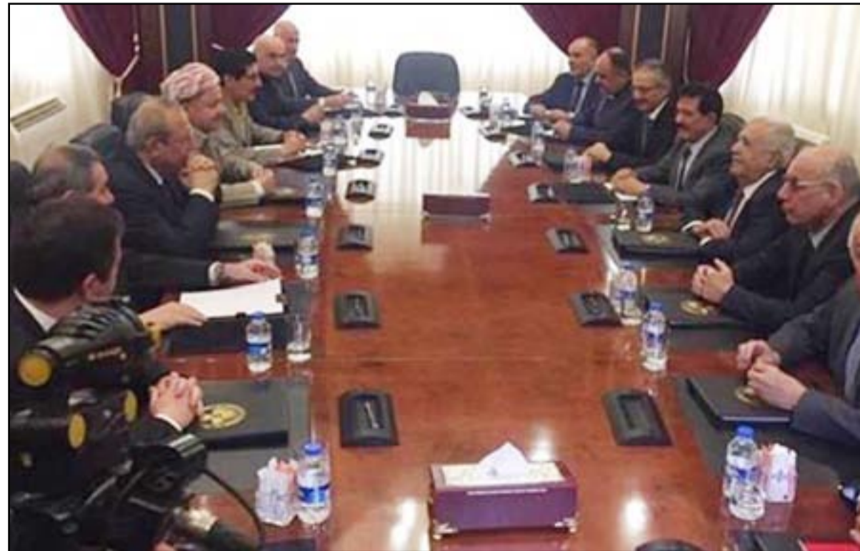
اجتماع للاتحاد الوطني والديمقراطي الكردستاني بحضور رئيس الاقليم