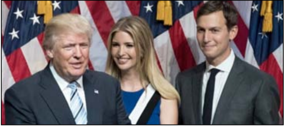
ترامب إلى جوار ابنته إيفانكا وصهره

بينما أكدت مصادر أميركية سفر صهر الرئيس ترامب الى العراق برفقة برقعة رئيس هيئة الأركان المشتركة جوزيف دنفورد. وكان لافتاً للظن التزام الحكومة العراقية الصمت حيال ذلك. ويتمتع كوشنر (٣٦ عاماً) بنفوذ كبير على السياسات الداخلية والخارجية للإدارة الجديدة وكان الوسيط الرئيس بين ترامب والحكومات الأجنبية خلال الحملة الانتخابية في عام ٢٠١٦. وتأتي هذه الزيارة كأول مبادرة اهتمام من قبل إدارة ترامب بالوضع في العراق، وذلك بعد أسبوعين من تصريح رئيس الوزراء حيدر العبادي، بأنه متأكد من أن رئيس الولايات المتحدة سينزيد من دعمه للحملة القتالية التي يخوضها ضد تنظيم داعش. ونقلت (أسوشيتدبريس) عن مسؤول كبير في الإدارة الأميركية، امس الإثنين، تأكيد أن جاريد كوشنر، صهر الرئيس الاميركي وكبير مستشاريه موجود في العراق في زيارة رسمية. وبين المسؤول أن كوشنر يزور العراق برفقة رئيس أركان الجيوش الأميركية المشتركة الجنرال جوزيف دنفورد، المسؤول الرفيع، الذي زود وسائل