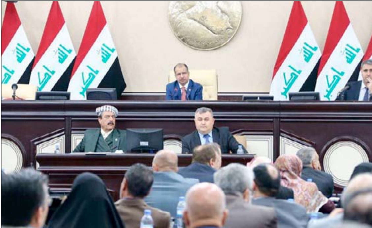
جلسة مجلس النواب .. أرفيف

سابق لـ"المدى"، وجود مباحثات يجريها رئيس التحالف الوطني بمنزل عن التيار الصدري أفضت إلى شبه اتفاق على خوض القوى الشيعية بقائمة موحدة تضم رئيس الوزراء إلى جانب فصائل من الحشد.