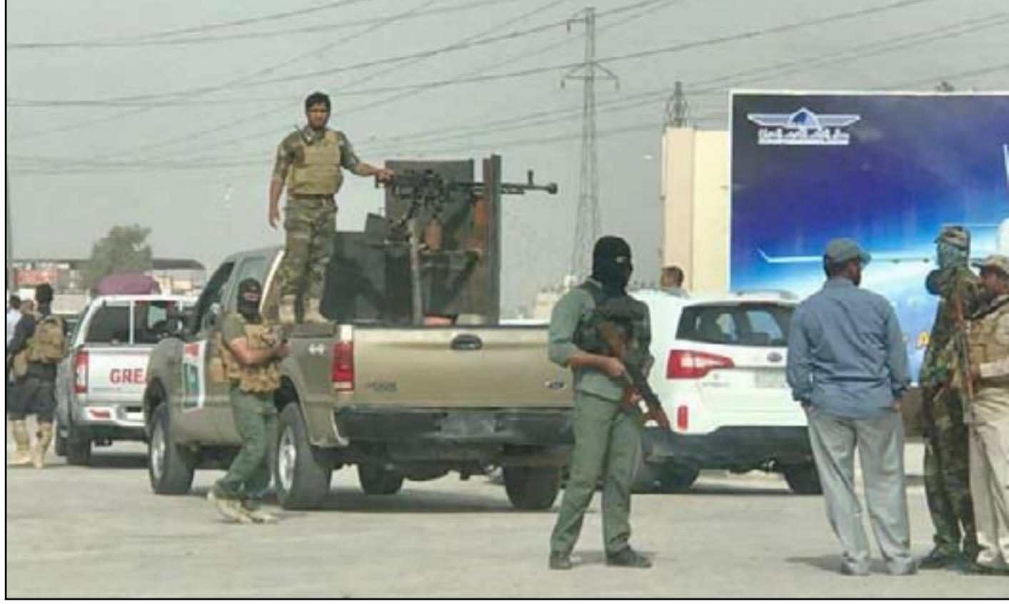
سرايا السلام في النجف