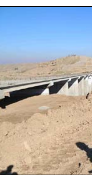
محافظ كركوك نجم الدين كريم يشرف على مشاريع خدمية في المحافظة

للضحايا التي قدمها وباقي وشهداء البيشمركة". وأكد مستشار المحافظ، أن الحكومة المحلية "تمكنت من انجاز ٣٣ مدرسة عصرية وحديثة وهي جاءت ضمن