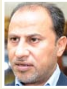
يحيى الناصري محافظ ذي قار

"نظراً للظروف الاقتصادية التي يمر بها العراق كافة وكذلك الشعب العراقي وبالخصوص محافظة المثنى التي تصل نسبة الفقر فيها إلى أكثر من ٥٠٪ لذلك فإن خصخصة الجباية بالأسعار الجديدة في الكهرباء، ستؤثر بشكل سلبي على حياة المواطنين ولاسيما مع عدم توفر فرص عمل وكذلك عدم توفر المياه للزراعة ولتربية الحيوانات والماشية".