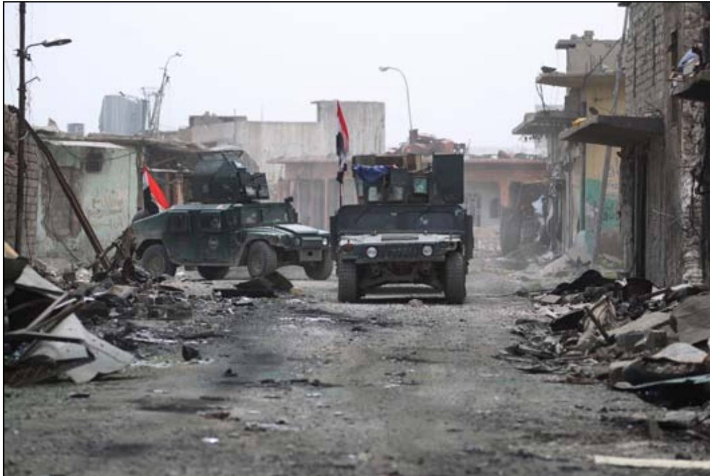
قوة عسكرية في الساحل الأيمن..

ويقول دامينوف بأن القتال يزداد حدة عند مقتربات المدينة القديمة مع قيام وحدات الشرطة الاتحادية وفصائل قوات الرد السريع من تشكيل طوق شبه كامل في المنطقة يحيط بمسلحي داعش الذي يقدر عددهم بأكثر من الف، مضافا ان غالبيتهم من العراقيين مع وجود مسلحين اجانب آخرين من دول عربية واوروبية ومن جمهوريات الاتحاد السوفييتي السابق واكثرهم نوو رتب عسكرية عالية في صفوف التنظيم. لقد خسر تنظيم داعش خلال شهر