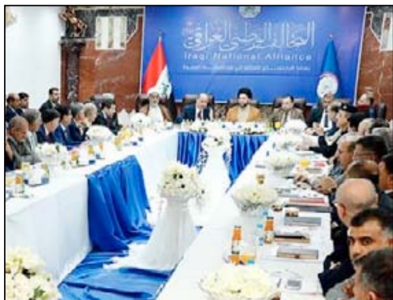
اجتماع الحكيم مع رؤساء الوحدات الادارية أمس

(المدى)، نسخة منه، خلال لقائه رؤساء الوحدات الادارية في المحافظة، ان "الحكيم بين خلال زيارته لمحافظة البصرة على رأس وفد من التحالف الوطني أهمية تغليب موارد الوحدات الادارية وعدم الاعتماد على ما يرد من الحكومة بسبب الاوضاع المعروفة". وأوضح "اهمية الابتكار والاستفادة من تجارب الاخرين وتبادل الخبرات بين المحافظات لتقديم افضل الخدمات"، داعياً الى "ايلاء ابناء الشهداء وعوائل الشهداء اهتماماً مضاعفاً خاصة عوائل الحشد الشعبي". وشدد رئيس التحالف الوطني "على اهمية منح عوائل الشهداء قطع اراض تمكثهم من العيش الكريم". وأضاف الحكيم ان "الوحدات الادارية ملزمة بتحديد أولوياتها والعمل على اذابة التقاطعات مع الوزارات الاتحادية، مؤكداً "اهمية تشخيص المشاريع التي يمكن ان تدر أموالاً على بدماء العراقيين".