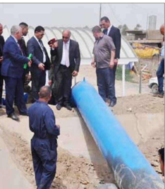
وزير الموارد المائية حسن الجنابي في محافظة بابل

شخ المياه خلال الموسم الصيفي الجاري". ودعا الجبوري، ووزارة الموارد المائية الى أن تكون لها "اليدين الطولى في تنفيذ تصاميم مشروع نهر اليهودية لمعالجة الكارثة البيئية على ضفافه و ازالة الأثر السلبي فيه إضافة الى إزالة التجاوزات والنفايات على نهر اليهودية التي تمثل خطراً على حياة المواطنين الساكنين بالقرب منه"، مطالباً في الوقت ذاته "الوزارة باكمال تنظيف البحيرة الهلالية التي تحيط بالمدينة الاثرية في بابل دعماً لحملة (بابل تراث عالمي)، وادراج آثار بابل ضمن لائحة التصنيف العالمي".