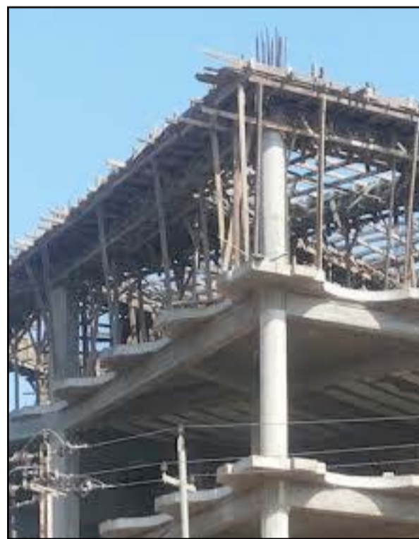
بنية متلكئة ضمن المشاريع الوزارية في الكوت.. خاص بالدي

وتابع الزامل أن "مشروع الطريق الحولي الذي ينفذ لحساب وزارة الأعمار والإسكان والبلديات العامة بكلفة تبلغ 104 مليارات دينار مع جسر الكارضية أصبح بحكم الميت سريرياً لعدم قدرة الشركة المتعاقدة