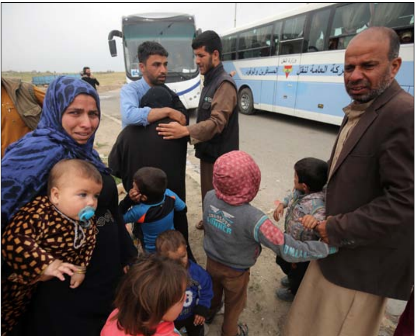
أسرة موصلية نازحة في غرب الموصل..