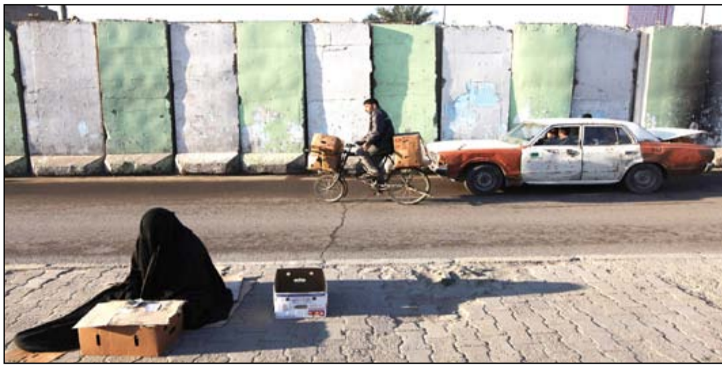
متسولة تقترش الرصيف