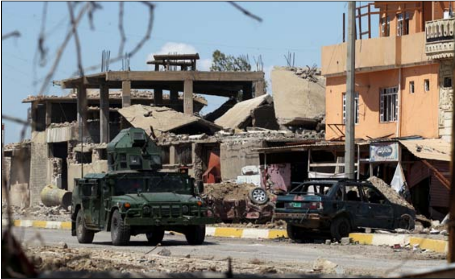
اللية عسكرية في الموصل القديمة امس.

من جامع النوري، ويمثل هذا الجامع قيمة رمزية فهو الذي أعلن منه أبو بكر البغدادي زعيم تنظيم داعش قيام دولة الخلافة على اراض في العراق وسوريا.