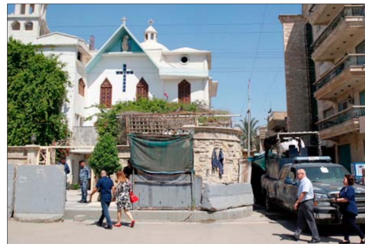
مسيحيون أمام إحدى الكنائس في بغداد