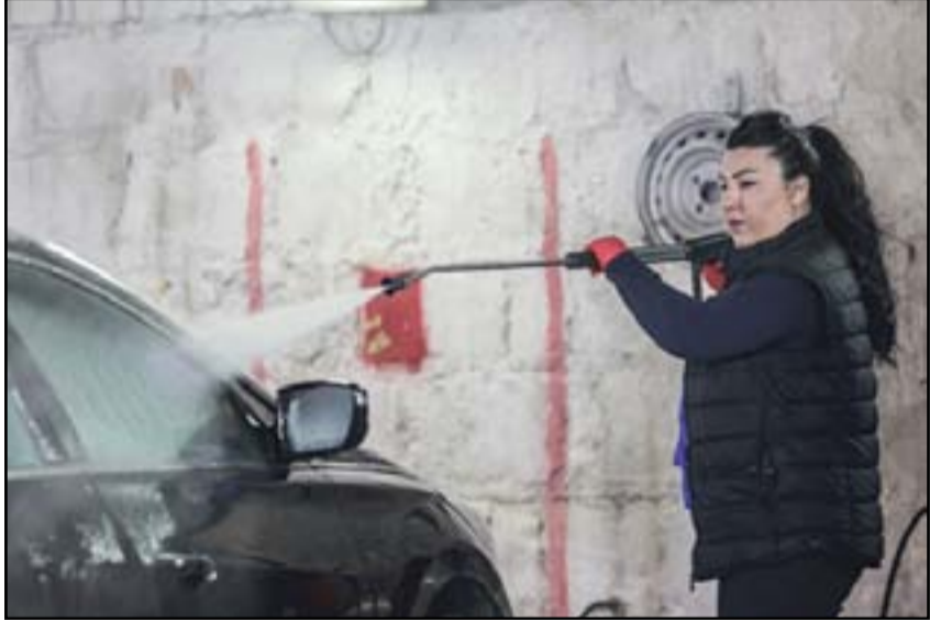
شابة تسفل سيارتها في السليمانية.. وكالات

وتقول الناشطات المشاركات في المسيرة إن هذا الكتاب يقلل من شأن المرأة، وإن تحريم قيادة السيارات للمرأة أمر دخيل على المجتمع الكردي.