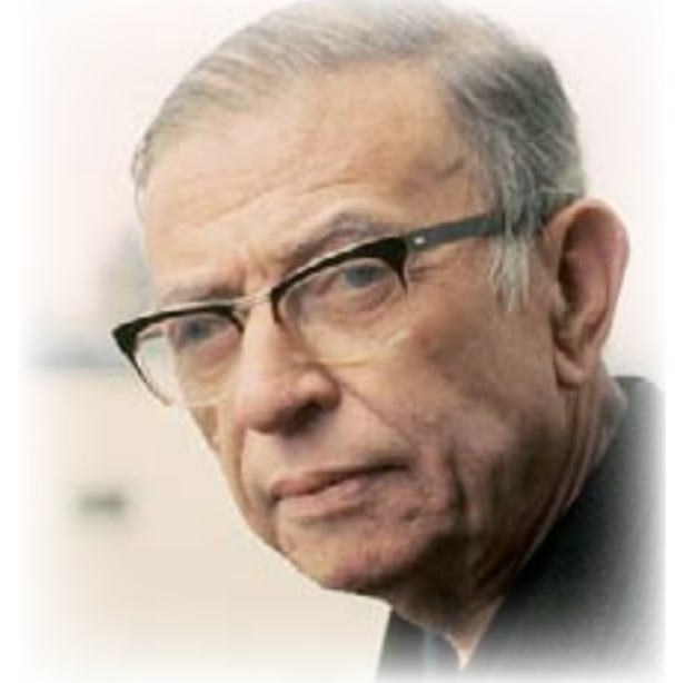
جان بول سارتر