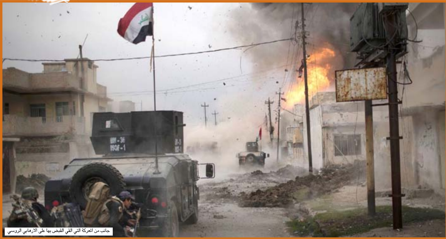
جانب من المعركة التي لقي القبض بها على الإرهابي الروسي

تمت محاصرة كتيبتنا وأصبحت إصابة شديدة في كتفي ووجهي وركبتي فتم الانسحاب، ثم بقيت في المستشفى الجمهوري بالموصل إلى أن شفيت.