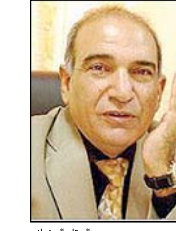
عبد الستار البيضاني

■ ليلي قاسم حسن الناشطة السياسية الكردية الراحلة، تستذكرها دار النشر والثقافة الكردية في وزارة الثقافة وذلك للحديث عن دورها السياسي في جلسة تقام صباح يوم الإثنين المقبل في مقر الدار.