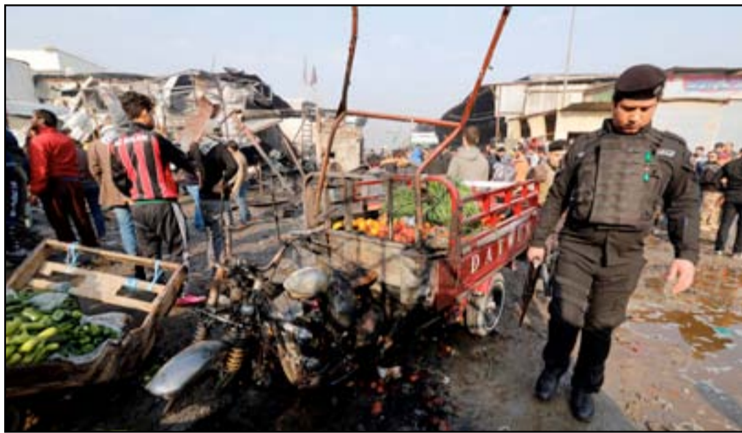
شرطي يعاين أثر تفجير في سوق الخضار جنوب شرقي بغداد... وكالات

مجلس القضاء الأعلى القول عن نائب المدعي العام في المحكمة "أن اعترافات هذه المجموعة أوضحت أن التنظيم يلجأ إلى الطريق غير المباشر من خلال إرسال بضائع بئلقها صرافون تابعون له يقومون ببيعها إلى تجار". ويؤكد أن "البضائع تدخل إلى البلاد بشكل رسمي بمنح بعضها إلى تابعين للتنظيم دون مقابل ويكون قسم من الناقلين متعاونين ويعرفون حقيقتها". ونبه إلى أن "الأسواق العراقية شهدت مؤخراً وجود بعض البضائع تباع بثمن بخس جداً لا تتناسب مع أسعار مكوناتها أو خزنها، وتبين أن بدلاتها النقدية تذهب إلى التنظيم من خلال هؤلاء الصرافين والمتعهدين وشركات تجارية متواطئة معهم".