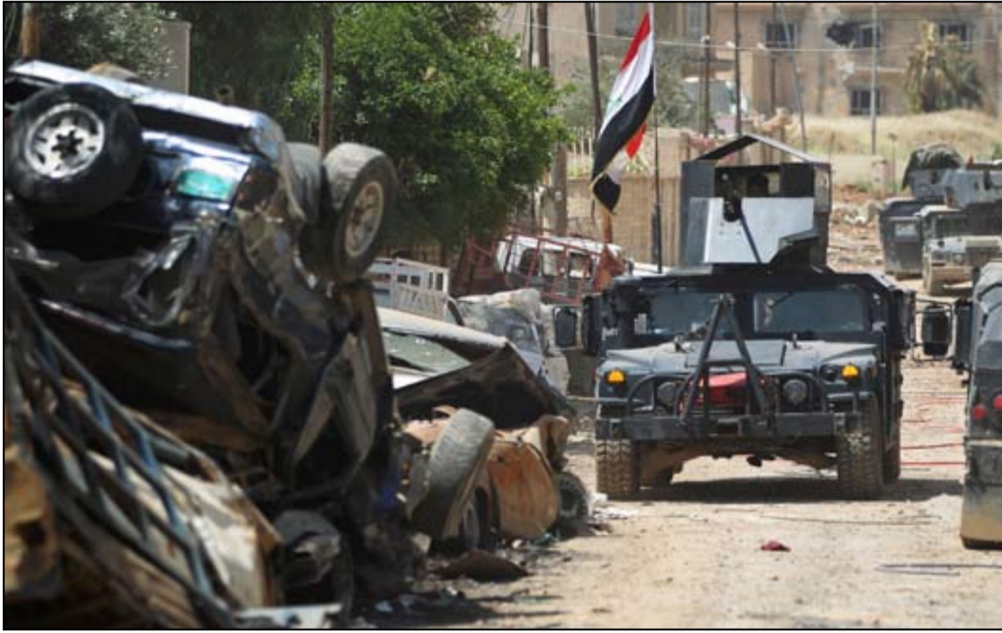
قوة عسكرية في حي الإصلاح الزراعي غربي الموصل...

كما كشفت كاميرات الطائرات المسيرة عن وجود دوريات في المناطق التي يسيطر عليها داعش وهي إما سيارات