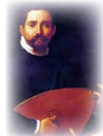
جان بول سارتر

تكلمت في حلقة سابقة من العام الماضي، عن بعض العوائل الموسيقية ونكرت عوائل مثل بندا وشتراوس وكوبران. أعود اليوم للحديث عن عم وابن أخيه عملا في فترة عصر النهضة والانتقال إلى عصر الباروك، وهما من عائلة غابريلي من فينيسيا.