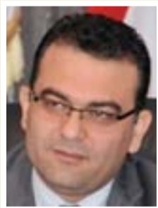
جاسم محمد الجبافي وزير الهجرة والمهجرين

"إن ظاهرة العنف ضد الأطفال انتشرت بشكل كبير مؤخراً في عدد من المحافظات العراقية، عن طريق قيام الجيران بالتبليغ في حالة وجود عنف ضد الأطفال، وعن طريق فيديوهات يقوم نواب الأطفال المعنفين بتصويرها ونشرها، وتطالب وزارة الداخلية بالتدقيق بتلك الفيديوهات، ومعرفة السبب وراء نشرها، إن القضاء على هذه الظاهرة لا يتوقف على إقرار قانون العنف الأسري، بل نحن بحاجة إلى تدخل رجال الدين والصحافة ومنظمات المجتمع المدني".