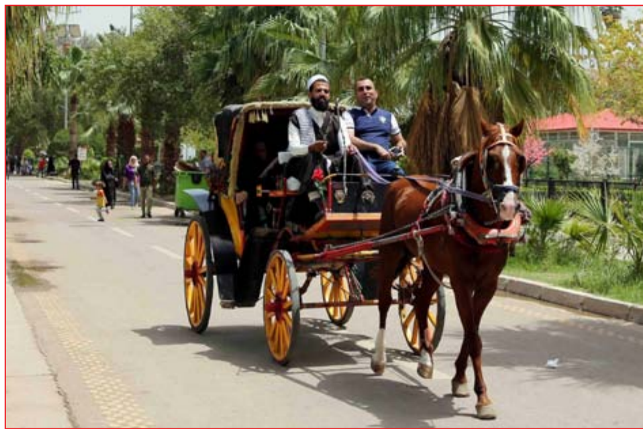
الربل البغدادي في متنزه الزوراء...