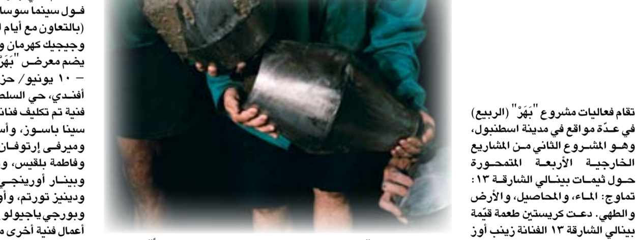
أونور غوكمين، "الأنهار جميعها تصب في البحر، إلا أن البحر لا يكتمل أبداً" (القطعة للعمل الفني)، 2017

تقام فعاليات مشروع "بهر" (الربيع) في عدة مواقع في مدينة اسطنبول، وهو المشروع الثاني من المشاريع الخارجية الأربعة المنحورة حول كيمتات بينالي الشارقة 13: تماوج: الماء، والمحاصيل، والأرض والطهي. دعيت كريستين طعمة قيمية بينالي الشارقة 13 الفنانة زينب أوز لإطلاق بحوث وحوارات حول الكلمة المفتاحية "محاصيل"، وتجسيدها عبر برنامج معارض وعروض أداء كلفت بها عددا من الفنانين، بغية تقديمها ابتداءً من 13 مايو/ أيار إلى 10 يونيو/ حزيران 2017، بالتزامن مع مهرجان "هدر الالاس"، وهي احتفالية الطبيعة وقدم فصل الربيع في تركيا. تسير أوز في مداخلتها دورة حياة البذور وتتساءل حول السكون والكوم، وكذلك الوقفات التي نمر بها في يقظتنا ونومنا، لترتبط هذه الدورة بمعاينة أشمل للنواحي النفسية والمؤسسية والثقافية. سكون البذور - يقصد به سكون البذور الفيزيولوجي بسبب عدم ملاءمة البيئة المحيطة لعملية الإنبات - ويُعرف بالنمو المكبوح، والمنع المؤقت، وحالة من الراحة وفرة من الانتظار. السكون آلية حيوية تعزز احتمالية البقاء على قيد الحياة، وتضمن تناثر البذور الانتقالي الزمني (والمكاني) في حين تنتظر دورها للاستيقاظ. يعان "بهر" وقف النشاط والمراحل والأثار المختلفة المترتبة على النوم، وهو مستوحى من الأهمية الحاسمة للتوقيت في عمليات سكون البذور. يطرح هذا المشروع عدة مسائل في غاية الأهمية: هل ستبقى البذور ساكنة؟ هل سيبقى الأشخاص غير فاعلين؟ هل ستبقى مصادر الطاقة حالة النمو؟ أم أنها ستوقظ عملية التطوير؟