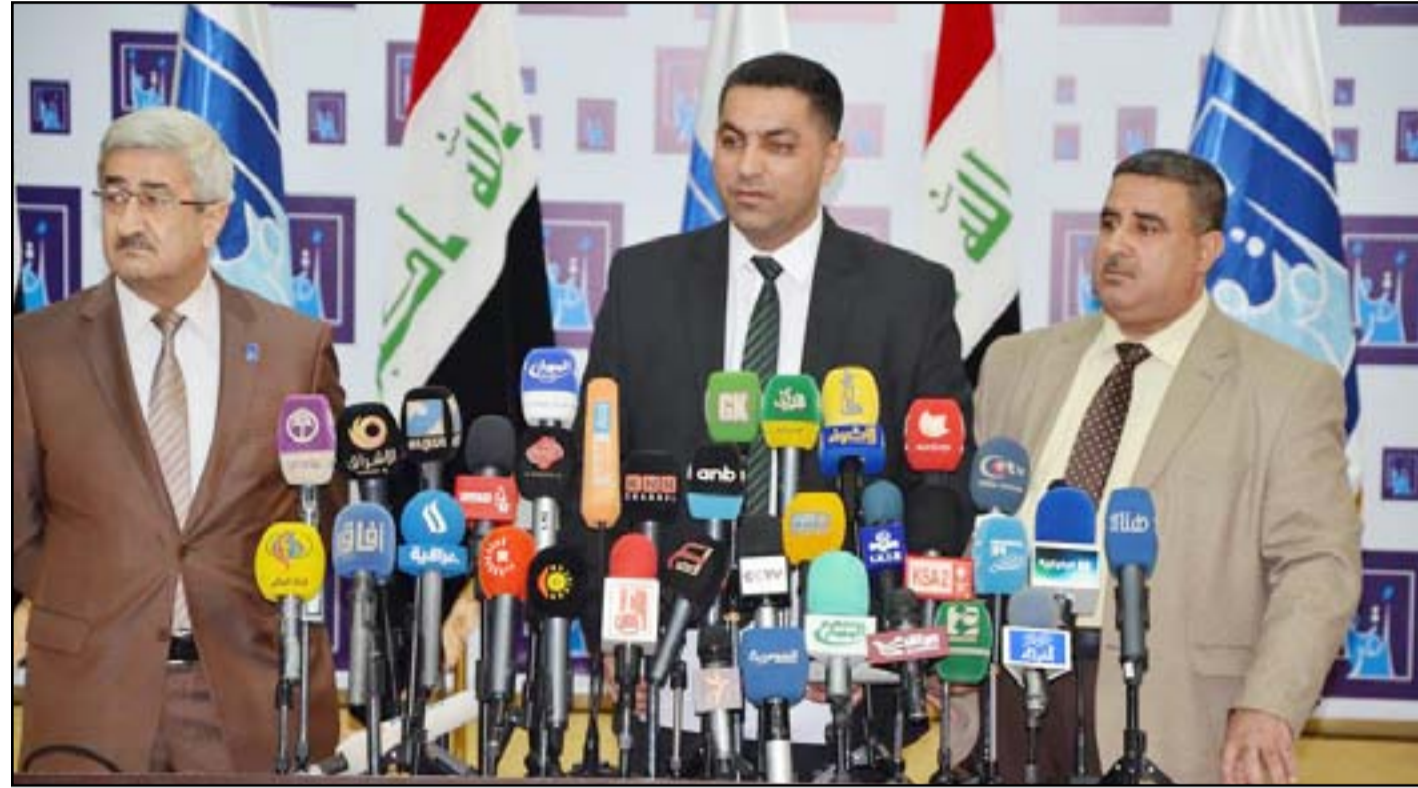
أعضاء مفوضية الانتخابات في مؤتمر سابق