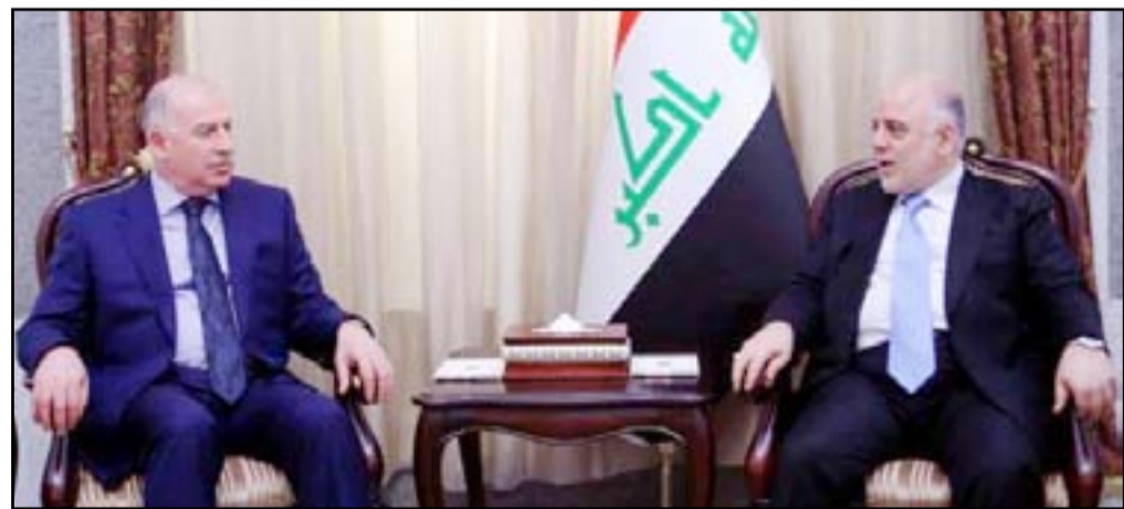
العبادي والنجيفي في لقاء سابق

بشأن تعهد العبادي بالتدخل في هذا الملف القضائي أو ذاك، مشيراً إلى أن القضايا المثارة ضد سياسيين ومسؤولين سابقين هي في صميم اختصاص السلطة القضائية، وحسم هذه القضايا يندرج في إطار صلاحيات القضاء وسلطاته التي حددها الدستور.