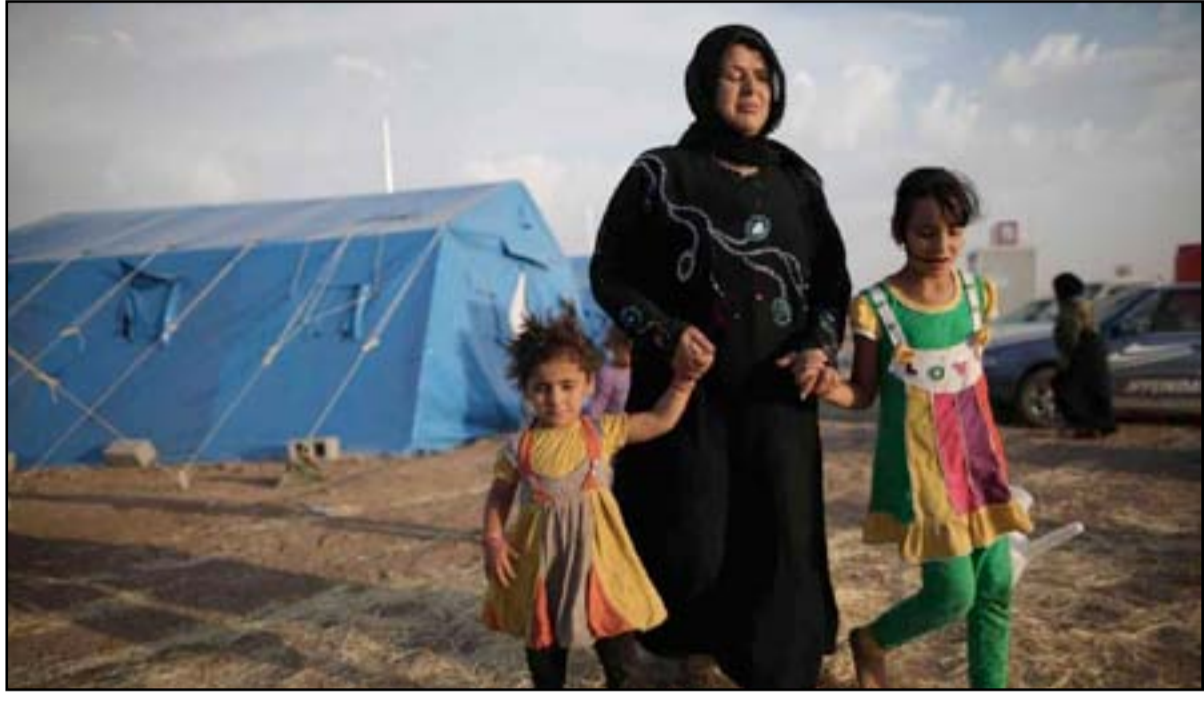
عائلة نازحة من جرف الصخر في إحدى مخيمات الايواء.. وكالات

وأضاف رئيس اللجنة الأمنية بمجلس بابل، أن "قرار عودة نازحي جرف النصر هو قرار يصدر من الحكومتين المحلية والمركزية، وموافقة القائد العام للقوات المسلحة ولا يوجد أي تدخل به من أي دولة".