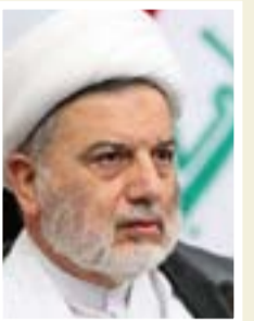
همام حمودي نائب رئيس البَرلمان

"اجتمعنا مع رؤساء النقابات المهنية في العراق، بحضور رئيس لجنة مؤسسات المجتمع المدني النيابية تافكة أحمد لمناقشة مشروع قانون النقابات والاتحادات المهنية، وعلى ضوء ذلك يجب تضمين الرؤى القانونية لرؤساء النقابات في فقرات القانون، لما ذلك من أهمية تنظيمية ومهنية لعمل الجهات المعنية بتطبيق القانون والخروج بحلول تنسجم مع مزاولة كل مهنة بما يضمن استقلاليها بصورة تامة".