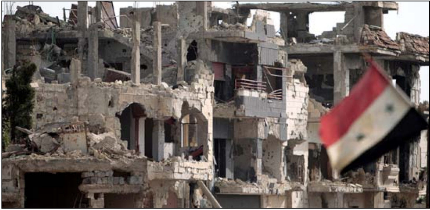
□ دمشق- انقرة / رويترز - أف. ب

قال الرئيس السوري بشار الأسد إن مناطق خفض التصعيد التي اقترحتها حلبته روسيا فرصة للمصلحين لـ «المصالحة» مع دمشق وطرده المتشددين، لكنه تعهد بمواصلة القتال، ووصف محادثات السلام التي تقودها الأمم المتحدة بأنها (غير مجدية). وتعهد الأسد في مقابلة مع قناة «أو إن تي» التلفزيونية في روسيا البيضاء، أنه سيعتد على (الخمس)، الدفاع عن مناطق خفض التصعيد التي تسيطر عليها روسيا، وأن سيسبق بدعم من إيران و«حزب الله» أولئك الذين يخرقونها.