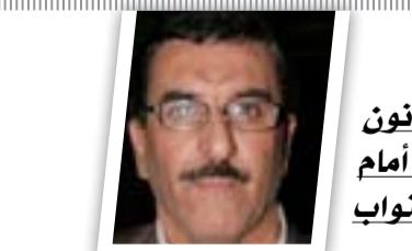
داعش أمام خيار الموت أو الاستسلام

أكد النائب عن التحالف الوطني عامر الفايز، ان حديث اللجنة القانونية البرلمانية عن وصول قانون الانتخابات إلى مراحله النهائية غير دقيق، فالقانون غير جاهز إلى هذه اللحظة. وقال الفايز ان "ما يقارب من 5 مشاريع لقانون الانتخابات أمام مجلس النواب مقدمة من جهات مختلفة، والى هذه اللحظة لم يقرر اختيار احد المشاريع المقدمة"، مبيّناً ان "هناك إصراراً من قبل القوى السياسية الكبيرة على تهيش وإقصاء الكتل الصغيرة من خلال طرح مشاريع القوانين التي تدعم ذلك". ويبيّن ان "القوى الصغيرة قدمت مشاريع لقانون الانتخابات، تضمنت حق الجميع ليتمكّن رفضت من قبل القوى السياسية الكبيرة، فهم من يمتلك الأغلبية"، موضحاً ان "القوى السياسية الكبيرة، تريد السيطرة على المقاعد البرلمانية، وكذلك على مقاعد مجالس المحافظات والمناصب في الحكومات المحلية والاتحادية".