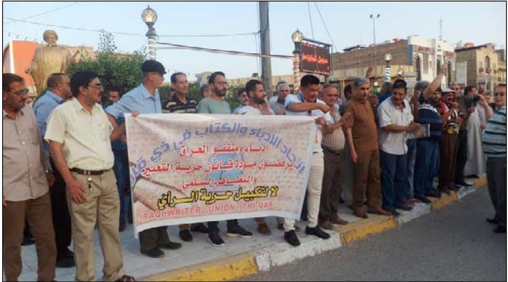
تظاهرة في ذي قار يوم الأحد... خاص بالمدى

□ اتهموا البرلمان والحكومة بمحاولة تكميم الافواه وإلغاء الحريات