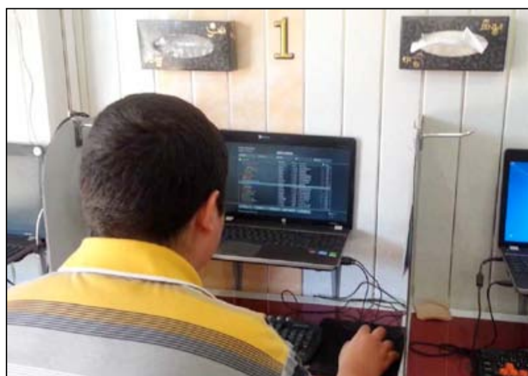
شاب يتصفح مواقع الكترونية في بغداد

□ مجلس القضاء يدعو لعقوبات مشددة ضد التشهير في المواقع الاجتماعية □ حل الخلافات خارج المحاكم يصعب اكتشاف النسب الحقيقية للضحايا