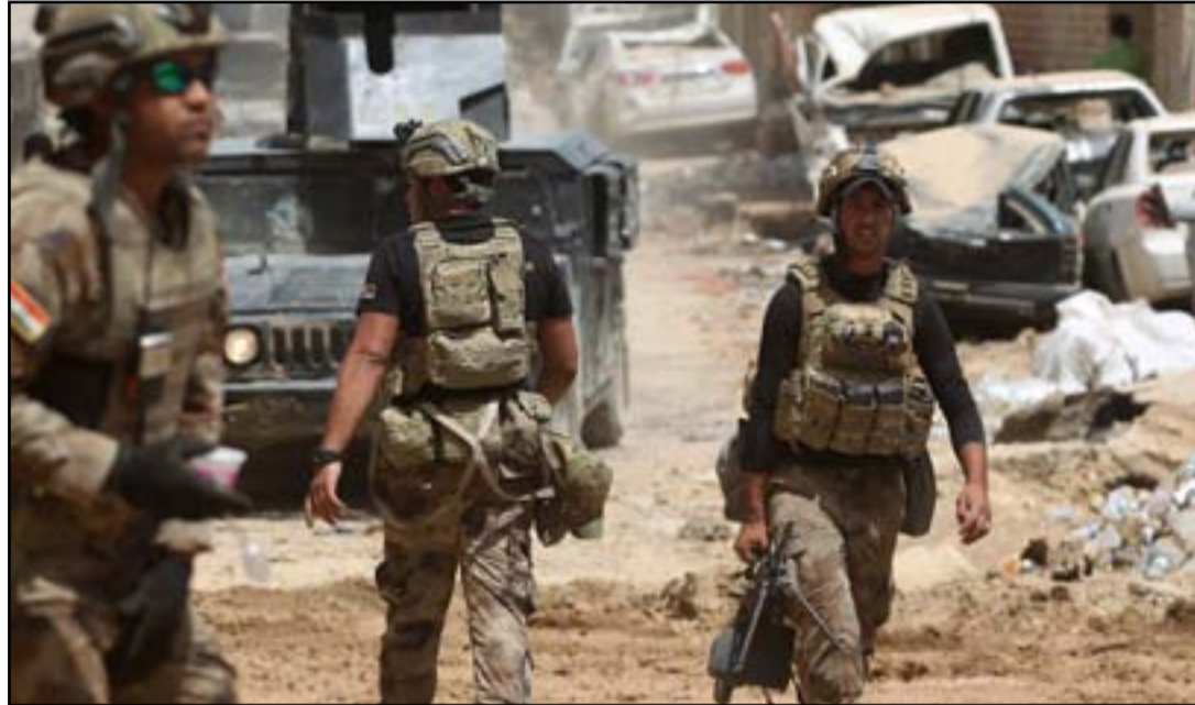
عناصر من مكافحة الإرهاب وسط الساحل الأيمن في الموصل ... أ.ف.ب

ويتحدث المسؤول المحلي عن متبرعين "غير محترفين" من العسكريين السابقين يقومون بإزالة تلك العبوات. ويقول "حسناً العيد من هؤلاء المتبرعين بسبب تفكير العبوات، وتقدمي من وزارة الصحة والبيئة أن تقوم بهذا الدور".