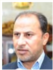
يحيى الناصري محافظ ذي قار

"على رئيس الوزراء، حيدر العبادي، منح فرصة الدخول الشامل لأبنائنا الطلبة في الامتحانات الازارية للدراسة المتوسطة والاعدادية، ان تقصير وزير التربية في طباعة الكتب المدرسية وتأخر تسليمها الى الطلبة بعد شهر او شهرين من بداية العام الدراسي، اضافة الى ان تسليم بعض الكتب مع اقتراب امتحانات نصف السنة والبعث الاخر في نهاية العام الدراسي، ألحق ضررا كبيرا علميا ونفسيا على الوضع التربوي العراقي".