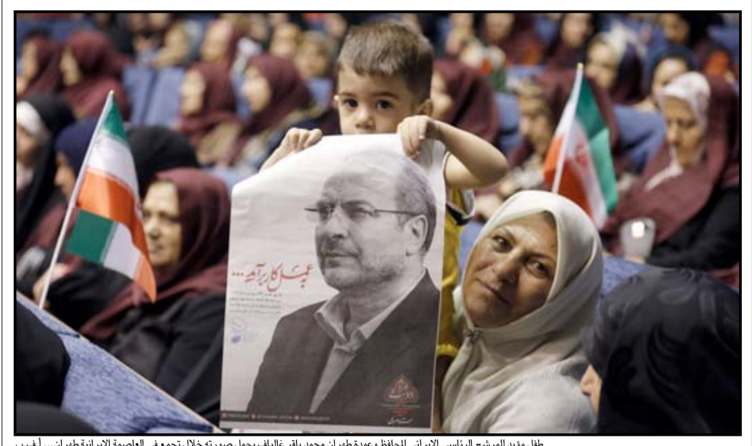
طفل مؤيد للمرشح الرئاسي الإيراني المحافظ وعمدة طهران محمد باقر قاليباف يحمل صورته خلال تجمع في العاصمة الإيرانية طهران...

كما من المتوقع أن ينسحب المرشح الإسلامي، ونائب الرئيس الإيراني، إسحاق جهانگیری، من السباق، لصالح دعم روحاني، وهو ما سيجعل مواجهة مصورة بين الرئيس الحالي، ورئيسي.