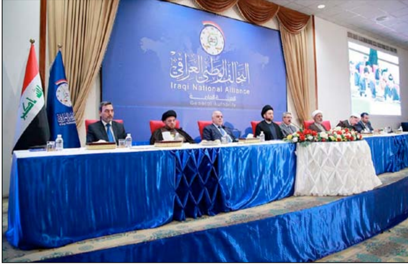
اجتماع الهيئة العامة للتحالف الوطني بحضور العبادي أمس

في هذه الأثناء، أكد رعد الحيدري، عضو كتلة المواطن أمس، أن "التحالف الوطني اتخذ قراراً بعدم سحب الثقة من مفوضية الانتخابات داخل مجلس النواب وعدم التمديد لها". وأضاف الحيدري أن "التحالف اتفق على استمرار مفوضية الانتخابات حتى انتهاء ولايتها في ٢٢ أيلول المقبل، ولن يتم التمديد لها". وكشف عضو الكتلة، التي يتأسسها عمار الحكيم، أن "التحالف الوطني شكل لجنة انتخابية برئاسة النائب قاسم العبودي للنظر بقانون الانتخابات المحلية والبرلمانية والتحقق من المشاكل التي تواجه مفوضية الانتخابات"، مرجحاً أن "تقوم اللجنة الانتخابية باستضافة بعض أعضاء مفوضية الانتخابات المحسوبين على التحالف الوطني من أجل الاطلاع على عمل المفوضية". وكان التحالف الوطني جدد، يوم الأحد، رفضه التمديد لعمل مجلس المفوضية العليا المستقلة للانتخابات، فيما دعا إلى ضرورة اتفاق نيابي على قانوني الانتخابات المحلية والنيابية. وقال بيان لمكتب رئيس التحالف الوطني عمار الحكيم، تلقت (المدى)، نسخة منه، إن "الهيئة العامة للتحالف عقدت اجتماعها الإعتيادي يوم الأحد، بحضور رئيس التحالف عمار الحكيم