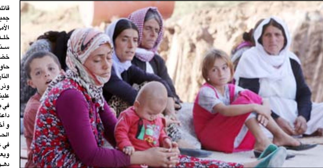
نساء ايزيديات على جبل سنجار..ارشيف