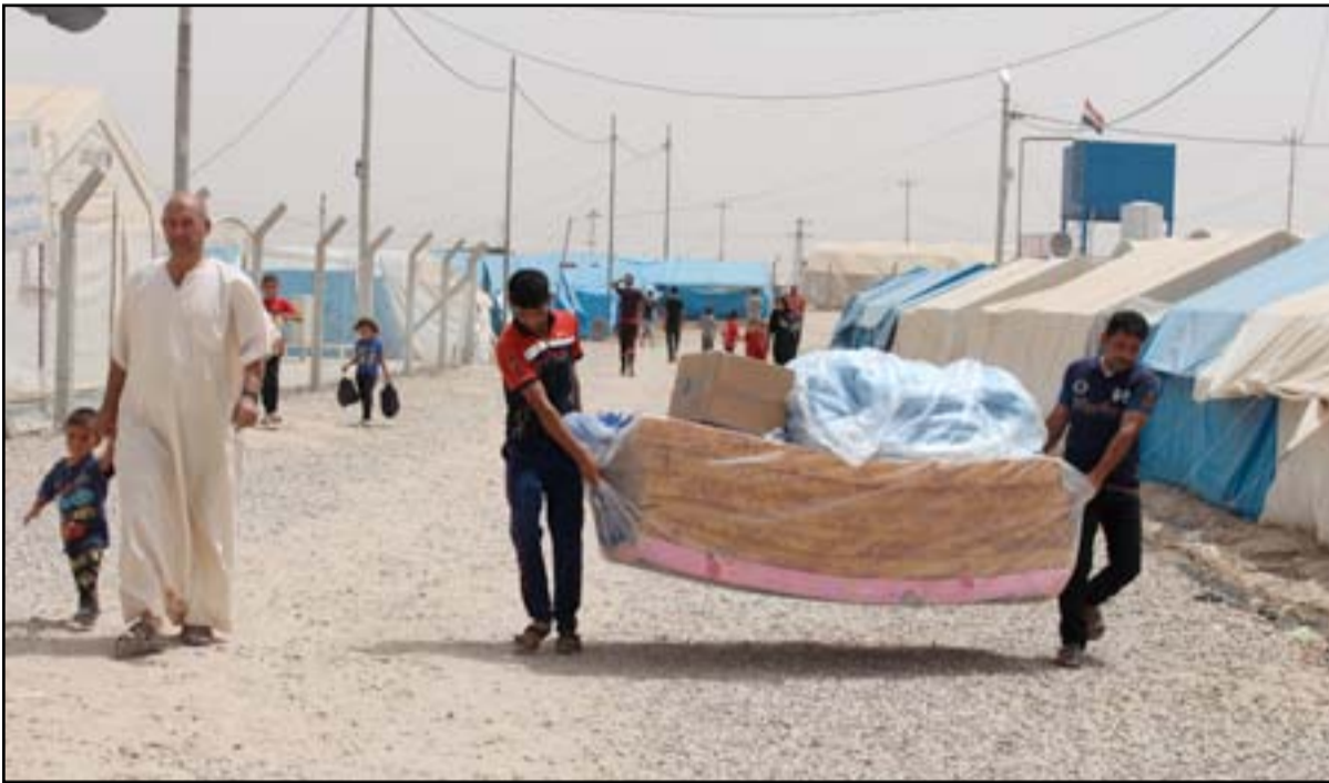
نازحون في أحد مخيمات كركوك..ارشيف

ويرجع ان تنظيم داعش قام باعدام أكثر من ٥ آلاف رجل طيلة سيطرته على مناطق الحويجة بتهمة عدم المباشرة للتنظيم، الأمر الذي تسبب بفقدان مئات النساء ازواجهن واولادهن. وتستدرك ام خنساء ذات الـ٤٨ عاماً، بالقول "كنا نملك مزارع وارض واسعة قبل ان يسيطر