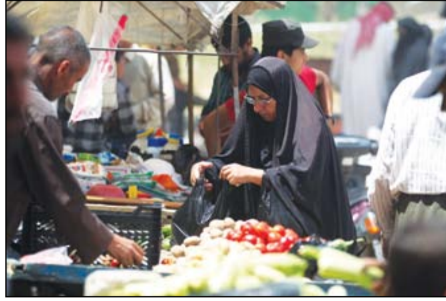
موصلة تتبضع من أحد الاسواق في الساحل الأيسر... أ.غ.ب

ويتوقع وجود مئات المسلحين الذين يفرضون حصاراً على قرابة ١٠٠ ألف نسمة يقطنون في الأرزقة القديمة التي تضم