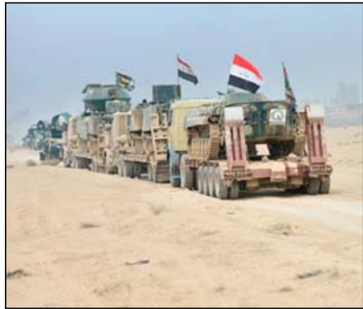
قوة من الحشد خلال عمليات تحرير القيروان غربي الموصل

وأشار المتحدث باسم الحشد إلى أن "المهمة الأساسية هي الذهاب إلى الحدود لغلقها وتأمينها وما يتبقى من حواضن وعناصر داخل المناطق سيحاصرون ويقتلون، إلا أن إعلان النصر النهائي سيكون بوصول القوات إلى الحدود السورية". وعقب المؤتمر، أكد الأسد أن التنسيق بين قيادات الحشد الشعبي وقيادات البيشمركة ليس جديداً وهناك تفاهات بينهما. وأشار إلى أن "العمليات الأخيرة شهدت تنسيقاً كاملاً مع الإخوة في البيشمركة وتوجد قنوات اتصال مباشرة بين الفريقين لغرض التنسيق" كما أن