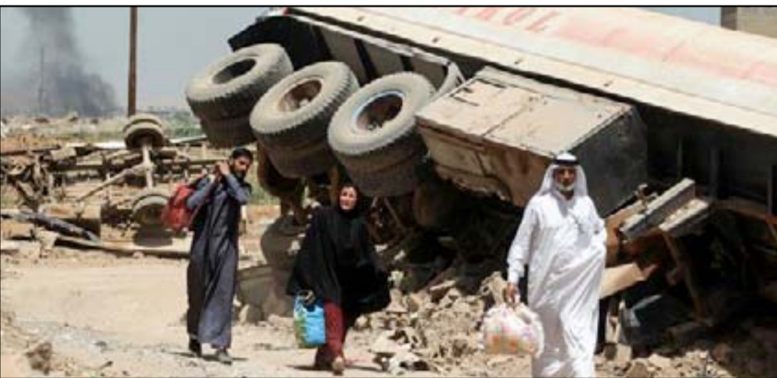
نازحون أثناء خروجهم من الرمادي... وكالات

□ الحكومة المحلية: بدون الدعم الدولي لا يمكن تلبية احتياجات المواطنين