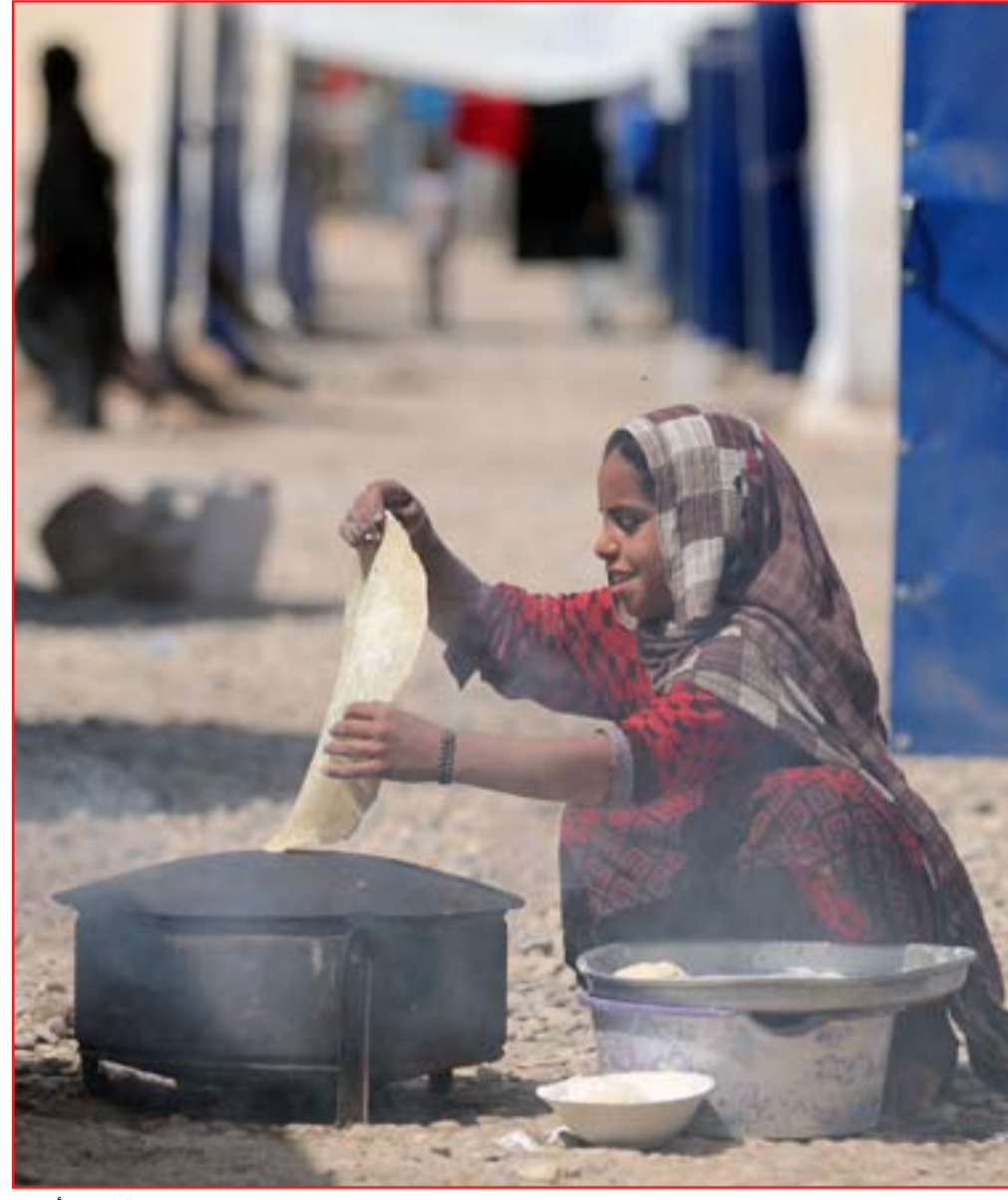
فتاة نازحة في مخيم حمام الغليل