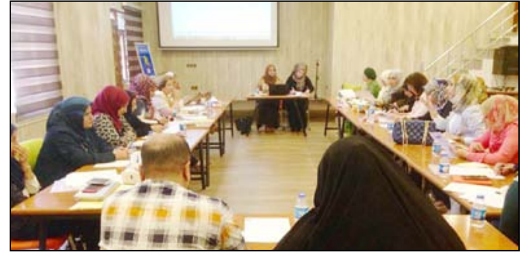
منظمات مدنية خلال لقاء، تداولي

دعونَ إلى إنشاء دور لإيواء المعتنفات لِحمايتهن من الانتهاكات الذكوريّة