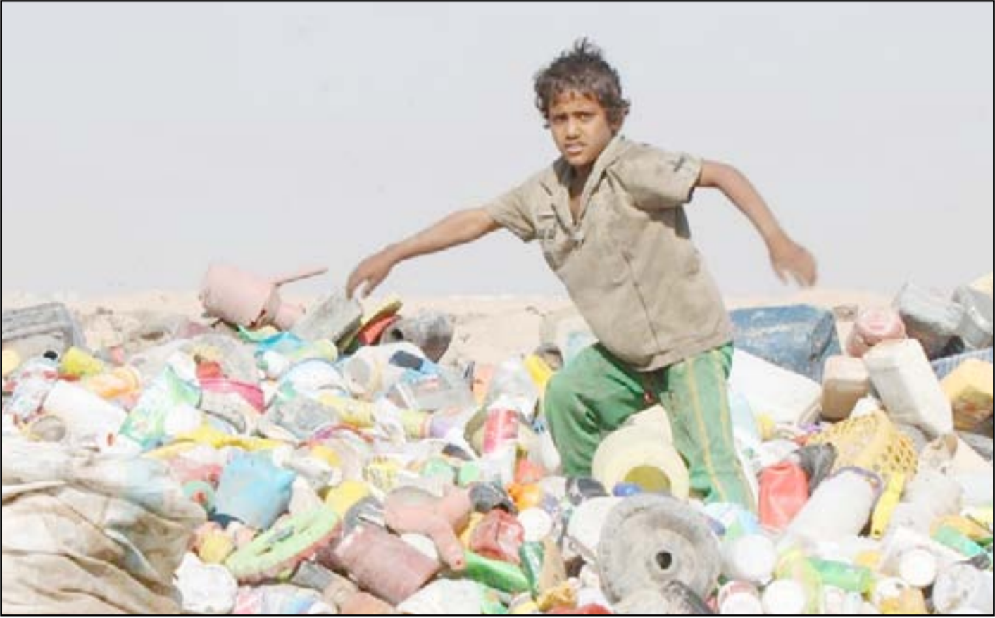
طفل في إحدى مكبات النفايات ببابل.. ارشيف

إلى "توحيد هذا الهاشاك في صفحاتهم الإلكترونية" ، مطالبا الحكومة المحلية بـ "فرض الغرامات ومحاسبة المتجاوزين عن أجل إنجاح المشروع" . وأعلن مجلس محافظة بابل ، الجمعة ١٢ كانون الثاني ٢٠١٧ ، تشكيل لجنة مشتركة مع منظمة أميركية لمعالجة ملف النفايات في المحافظة ، وفيما لفت الى اخذ تجارب التنظيف في محافظتي واسط والنجف بالاعتبار ، أكد ان كمية النفايات في مدينة الحلة تصل الى ٤٠٠ طن يوميا