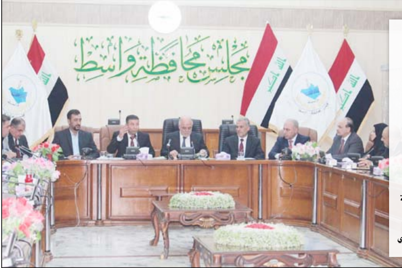
مجلس محافظة واسط أثناء اجتماع حضره حيدر العبادي

وأيضاً قال "أشكر مجلس المحافظة على قراره القاضي بإقالة السيد عمار الحكيم رئيس مجلس المحافظة من كتلة المواطن إذا ما استمر هذا الجدل والانقسام بين أعضائها وهنا ستكون الضربة قاسية وموجعة أكثر للمجلس الأعلى".