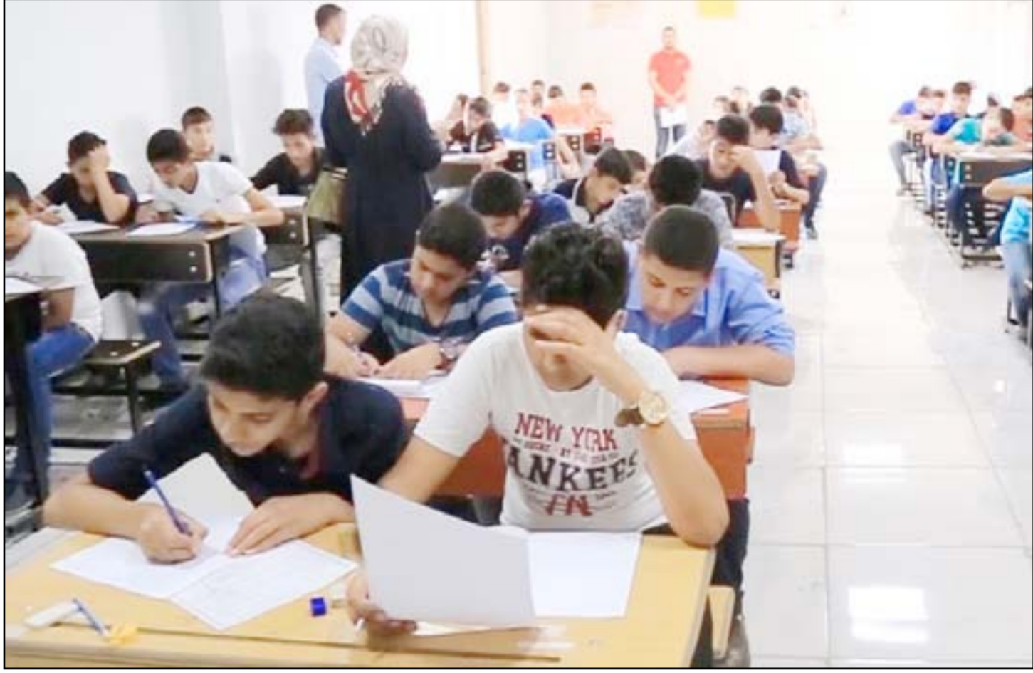
طلبة أثناء ادائهم الامتحان الوزاري... وكالات

إن مديريته ستستخدم جهازاً لكشف الغش الإلكتروني خلال الامتحانات العامة للدراسة المتوسطة للعام الدراسي ٢٠١٦-٢٠١٧، والتي ستبدأ الأحد المقبل. ولفت إلى أن "عدد المشاركين في الامتحانات الوزارية في عموم المحافظة أكثر من ١٠ آلاف طالب وطالبة". وبيّن الساعدي، أن "الجهاز عصا إلكترونية للكشف عن أي أجزاء حديدية ويستطيع المراقب استخدامها بسهولة، مشيراً إلى أن "عددها (١٤٣) عصا، ستوزع على عموم المراكز الامتحانية". وأضاف، أن "هنالك مجموعة من الإجراءات الاحترازية ستقوم فيها المديرية وحسب التوجيهات الوزارية للحفاظ على سير الامتحانات". على صعيد متصل أعلنت وزارة التربية،