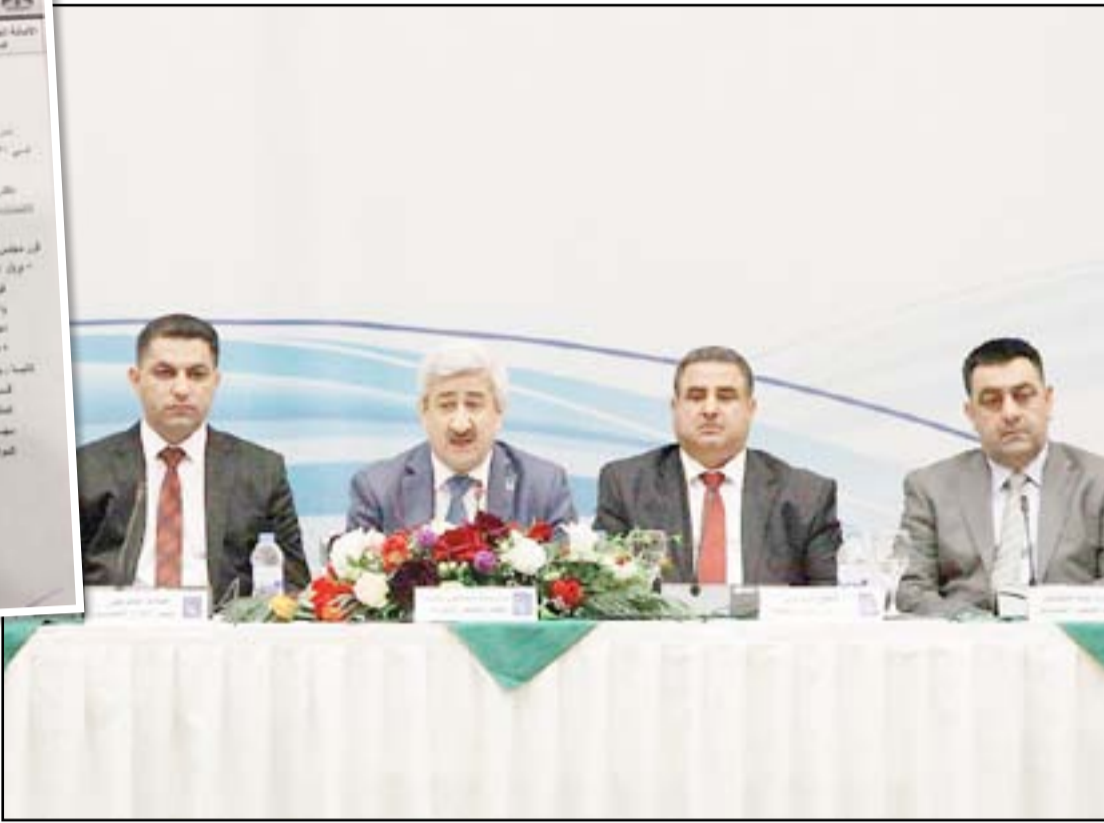
أعضاء مجلس المفوضية

أكدت الالتزام بـ"البايومتري" واستخدام مسرّع التصويت