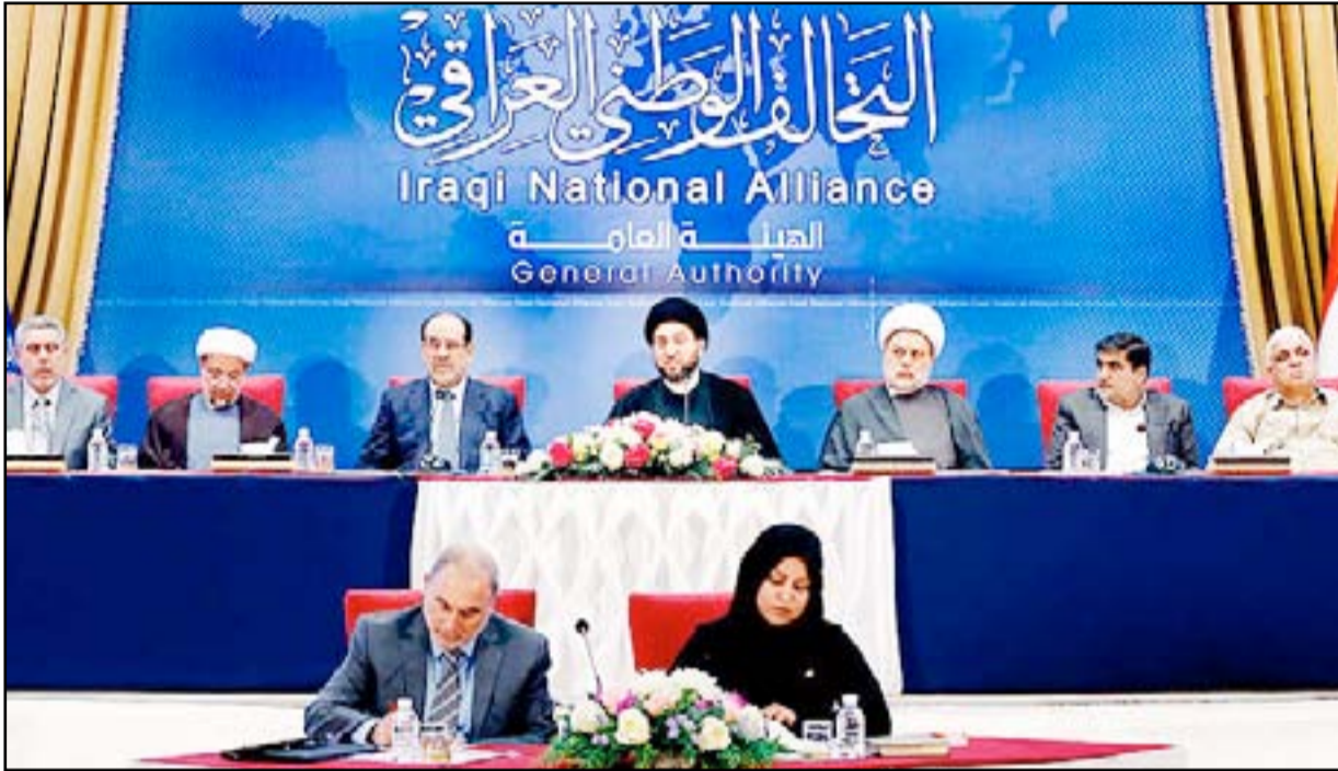
اجتماع سابق لقيادات التحالف الوطني برئاسة الحكيم

ومنذ انتخابات ٢٠١٤ حاول ائتلاف دولة القانون ترشيح القيادي في حزب الدعوة علي الأديب لرئاسة التحالف الوطني، لكن هذا المسعى اصطدم برفض التيار الصدري والمجلس الأعلى، اللذين شهدت علاقتهما تقارباً كبيراً، عقب الإطاحة بنوري المالكي. ويقول قيادي في المجلس الأعلى (المدى)، طالباً عدم الكشف عن هويته، ان "الهيئة القيادية لرئاسة التحالف الوطني طرحت منذ فترة ماضية موضوع اختيار رئيس جديد للتحالف بديلاً عن الحكيم الذي قاربت ولايته الدورية على الانتهاء". لكنه يؤكد ان "الأطراف الشيعية خلصت في اجتماعاتها إلى عدم ايجاد شخصية بديلة للحكيم تحظى بتوافق كل الجهات". وبلغت القيادي البارز في المجلس