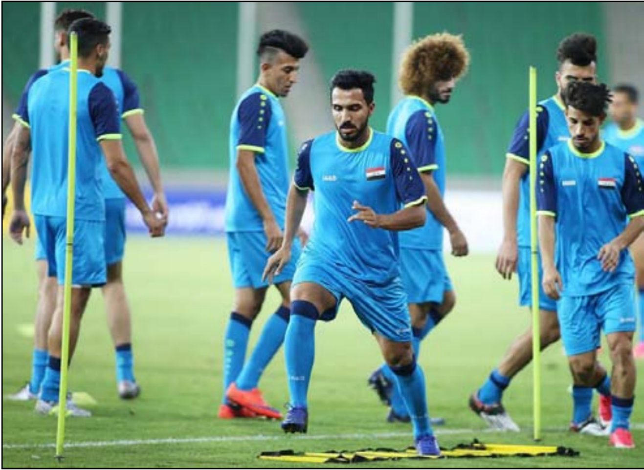
بغداد / حيدر مدلول

بواصل منتخبنا الوطني لكرة القدم، وحداته التدريبية ضمن معسكره التدريبي المقام حالياً بالعاصمة العراقية طهران في إطار برنامج تحضيراته الأخيرة لمواجهة نظيره الياباني ظهر بعد الغلاء، على ملعب (بابص أولمبي) ضمن منافسات الجولة الثامنة من منافسات الدور الثالث لكأس العالم الآسيوي المؤهل لبطولة كأس العالم المقبلة التي ستعقد في روسيا بحزيران ٢٠١٨.