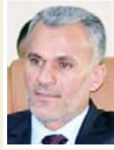
مالك خلف وادي محافظ واسط

"تم الاطلاع على الفحص والتشغيل والبث التجريبي الاولي للنفثة التي ستعمل وفق أحدث الاجهزة والمعدات المنصبة والوسائل الاعلامية فيها والتي تميزت بالتقنيات التكنولوجية العالية الجودة ووفق نظام (HD)، ان فضائية واسط ستكون في خدمة ابناء المحافظة لنقل همومهم ومعاناتهم وستكون حلقة الوصل بين المواطن الواسطي والمسؤول".