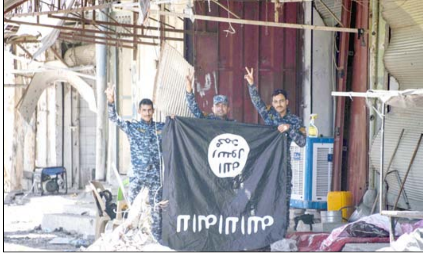
عناصر أمنية يتكسون راية داعش في الزنجيلي بعد تحريرها.. أ.ف.ب

□ مخاوف من ارتكاب التنظيم مجازر جديدة في الشفاء