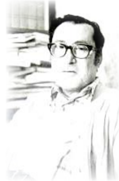
غائب طعمة فرمان

في كتاب (مذكرات كامل الجادرجي وتاريخ الحزب الوطني الديمقراطي) الذي حرره وأعدّه للنشر الاستاذ نصير الجادرجي، حديث شيق لزعيم الحزب الوطني مع الروائي غائب طعمة فرمان عن شتى شؤون الثقافة والفكر السياسي، في نهاية تشرين الثاني ١٩٤٩.