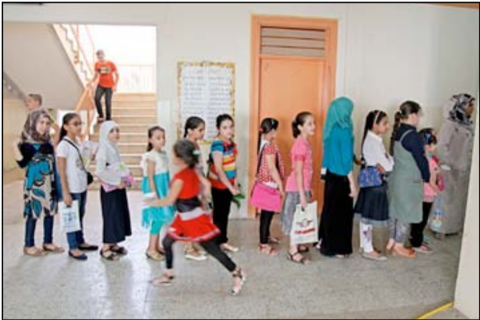
مدرسة ابتدائية في بغداد.. وكالات

□ التربية تتعهد بتقديم الدعم اللازم لتنفيذ المشروع