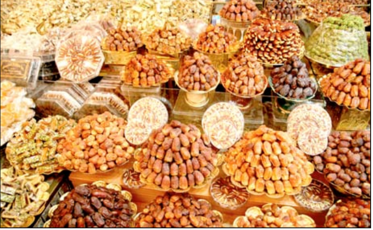
تمور مستوردة في الأسواق العراقية.. (أرشيف)

وكانت وزارة التخطيط والتعاون الإنمائي، أكدت أن أعداد النخيل في العراق بلغت ١٧ مليون نخلة، مبيّنة أن إنتاج التمور الذهبي كان الأعلى من بين التمور وبنسبة ٥٤٪. ويؤكد رئيس لجنة الزراعة في البرلمان، فرات التميمي لـ"المدى"، إن "ما يمتلكه العراق من نخيل يتراوح بين ١٢ مليون نخلة إلى ٢٠ مليون نخلة، بالرغم من أنه في السابق كان يبلغ عدد النخيل ٣٠ مليون نخلة، ويعود التراجع لعدة أسباب منها الحرب العراقية - الإيرانية وحرب الخليج الثانية، وجعل محافظة البصرة المشتهرة بإنتاج التمور ساحلة للمعركة"، مبيّناً أن "النظام السابق لم يهتم