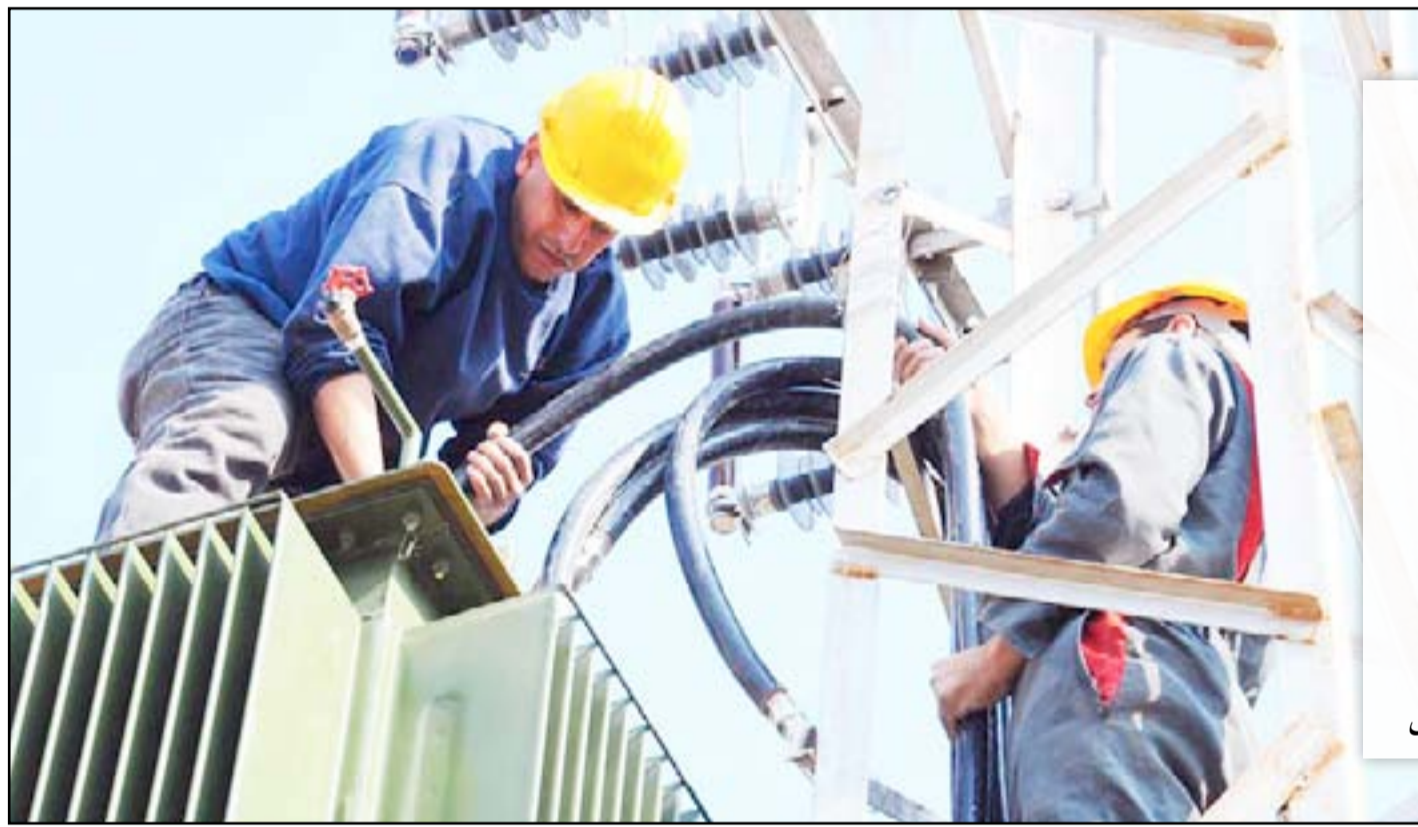
نصب محولات كهربائية جديدة في كركوك... وكالات

واختتم نائب رئيس لجنة النفط والطاقة بالقول، ان "مدة العقود المبرمة بين وزارة الكهرباء الاتحادية والشركات الاستثمارية هي سنة أشهر أولية، فإن لم تكن كافية لإعادة تأهيل الشبكة الكهربائية حالياً فيحق لنا في مجلس محافظة كركوك بتمديد سبعة أشهر أخرى، وإن لم تنفذ الشركات ما بنمته خلال هذه الفترة فسيتم سحب المشروع منها وإحالتها إلى شركات استثمارية أخرى". هذا وتستعين وزارة الكهرباء، بمديرية الوقف السنّي في كركوك، بغية المباشرة بخصخصة الكهرباء في المحافظة، ان زار وفد من الوزارة مديرية الوقف بالمحافظة لدعوة المواطنين الى إنهاء الهدر في استهلاك الطاقة عن طريق خصخصة الكهرباء. وذكر بيان للوزارة اطلعت "المدى" على نسخة منه، ان "وفداً من وزارة الكهرباء برئاسة المتحدث الرسمي باسم الوزارة