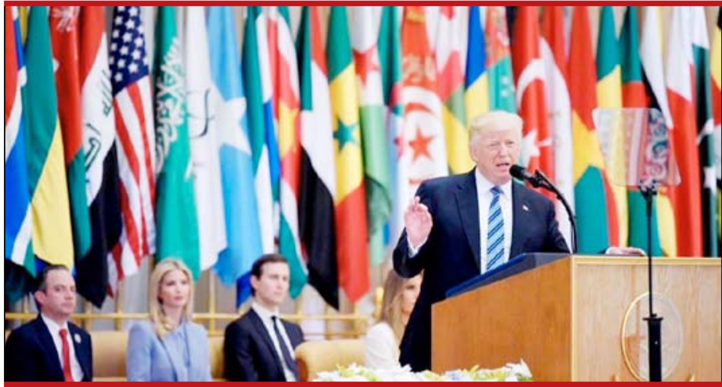
الرياض - واشنطن - موسكو / أ.ف.ب - رويترز

رحبت السعودية والبحرين، أمس السبت، بتصريحات الرئيس الأميركي، دونالد ترامب، التي طالب فيها قطر بوقف تمويل الإرهاب على حد تعبيره. وكانت دولة الإمارات قد أشادت الجمعة بـ "زعامة ترامب في تحدي دعم قطر المثير للقلق للتطرف".