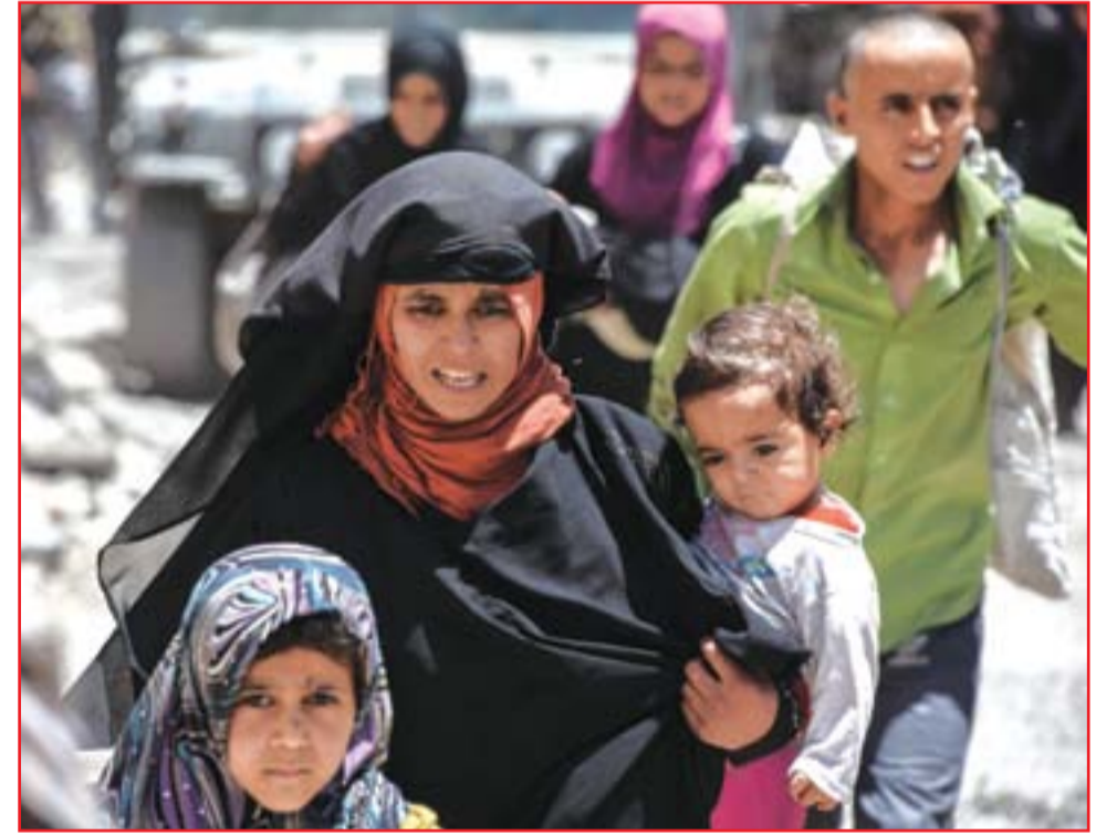
أسرة نازحة من حي الزنجيلي في الموصل

بغداد / المدى نجح عدد من الاطفال في حي الزنجيلي، وسقط الموصل القديمة، بالخروج من المنازل المهتمة، بعد ان قضت عوائلهم إثر المعارك التي تدور في الحي منذ أكثر من أسبوعين. وبدا الايتام الصغار مذعورين، بحسب مسؤولين وشهود عيان هناك، وهم يبحثون عن ذويهم وسط الركام، إذ شهد الحي أعنف معركة