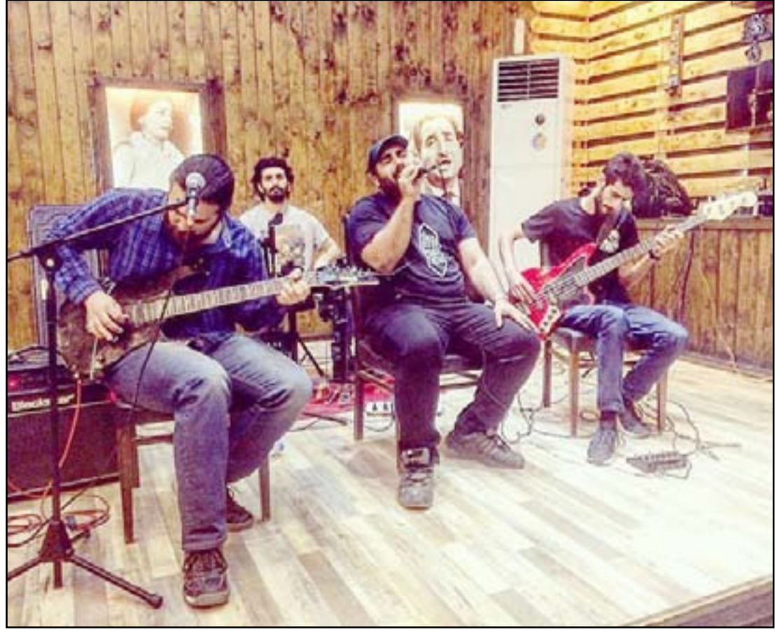
فرقة غنائية في أحد مطاعم بغداد