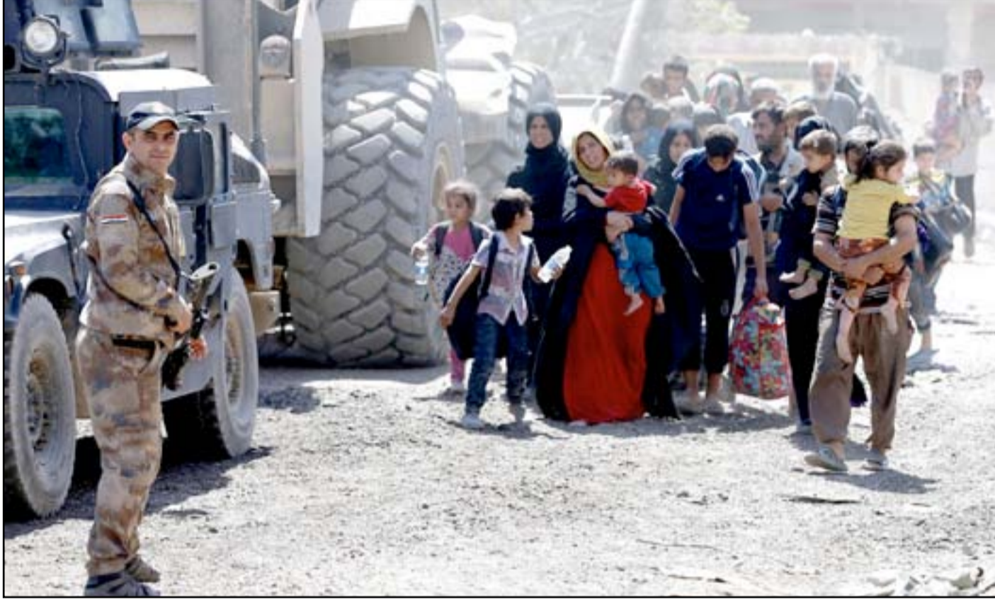
نازحون من مناطق غربي الموصل... (أ ب)

وهي تحمل آثار تعذيب. قال عمر "أنه الرد بالمثل، انهم أدوا عائلتي والأبن ستقوم بالرد بالمثل ضد عوائلهم". وأضاف ان الهدف من الهجمات بالقنابل اليدوية هي أخافة العوائل لمغادرة بيوتها. وعندما سأله مراسل التلفزيون ماذا سيفعل اذا لم يغادروا البيت، قال بانهم سيتسببون بتصعيد العنف.