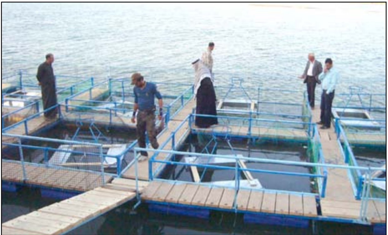
أقفاس سمكية عائمة في نهر دجلة.. أ.رشيف

وبشأن عودة شركة صيد الأسماك العراقية، أكد الوكيل الفني لوزارة الزراعة، أن "الشركة تم حلها منذ زمن طويل، ولكن أرى إمكانية تفعيلها ضمن القطاع الخاص، للعودة ومزاولة نشاطها في الصيد البحري في مياه الخليج العربي كما كانت في العقود السابقة، وهذا توجه موجود حالياً في عبر تفعيل الشركة استثمارياً".