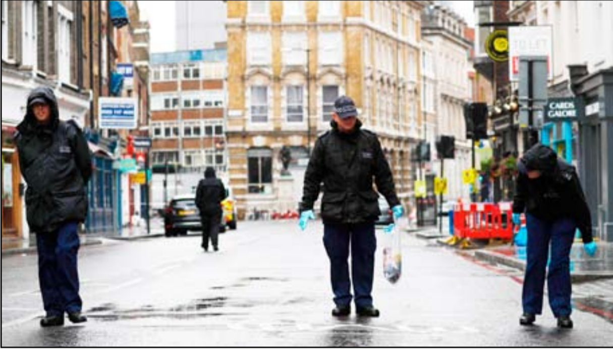
شرطة لندن تحقق في الهجوم الإرهابي الذي استهدفها .. ارشيف

وأضاف "لم يأت أي أحد منهم من إيران... لماذا يحاول تغيير التاريخ؟ نحن لا نخيفنا هذه الخطوات".