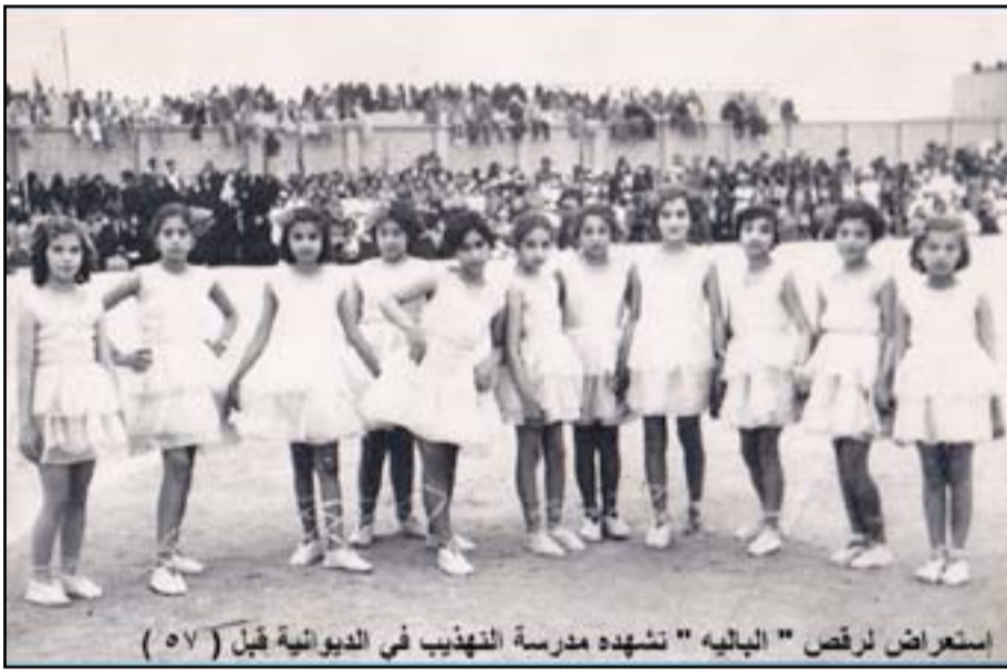
استعراض لرقص "الباليه" نشهده مدرسة التهذيب في الديوانية قبل (٥٧)