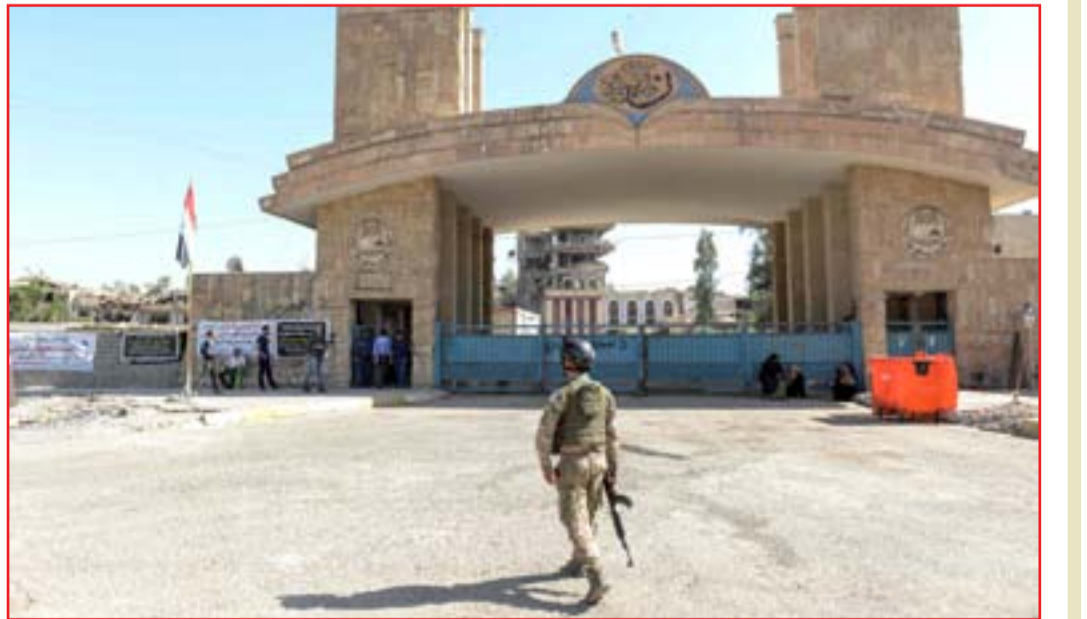
جندي يقف امام مئذنة جامعة الموصل

بغداد / المدى على ثاني أكبر المدن وأخر أكبر معاقل داعش في البلاد. ويأتي الإعلان بعد يوم من نفي قيادة العمليات المشتركة تحرير حي الزنجلي، وفندت مزاعم أوردتها وسائل إعلام من اقتراب بعض القطعات من مئذنة الحدياب في المدينة القديمة. وقال قائد عمليات (قادمون يا نينوى)، الفريق الركن عبدالامير رشيد يارالله ان "قطعات الشرطة الاتحادية والرد السريع حررت الجزء الشمالي لحي الزنجلي وبذلك تم تحريرها بالكامل