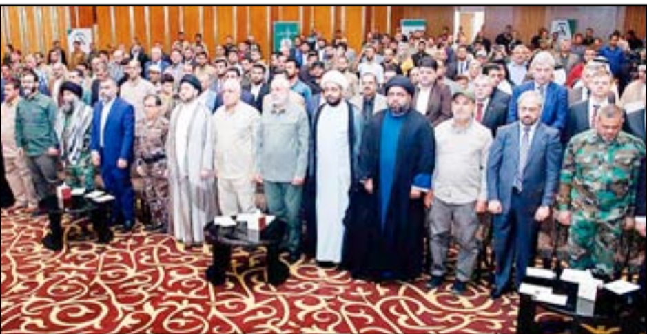
احتفالية هيئة الحشد

من يعتقد أن الحشد مستلزم مرحلة إنما هو يعيش الوهم"، مشدداً على أن "الحشد ليس مرحلة عابرة وتنتهي لأنه حالة تجزئت في نفوس