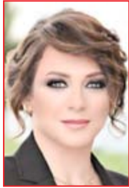
للتفرغ لتصوير مسلسلها «هجرة الصعادية» الذي تأجل

للعام المقبل لأنه يكلف ميزانية إنتاج ضخمة، وعن الدراما السورية قالت فواخرجي: «لا يمكنني أبدا التخلي عن الدراما السورية وبالتأكيد أنا سعيدة لأن العديد من الأعمال السورية تحوز الموسم الدرامي في رمضان بعد حالة من الركود والتدهور استمرت عدة سنوات». وعن إمكانية خوضها عملياً في وقت واحد قالت: «صعب للغاية ولكن إن كنت غير مرتبطة بموعد عرض معين مثل رمضان