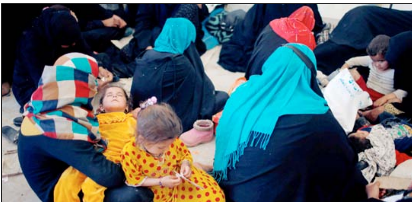
عائل نازحة في الخازر... وكالات

وقالت المنظمة في تقرير لها، اطلعت "المدى" على نسخة منه، إن "مخيم الخازر المسمى أيضاً (خازر UT) تعرض إلى حالة تسمم حيث يبلغ عدد العوائل الساكنة في هذا المخيم ١٤٦٢ عائلة أي ما يعادل ٧٧١١ شخصاً و يدار من قبل مؤسسة بارزاني، "مبينة أن منظمة راف القطرية ومنظمة عين المحتاجين قامت بإقامة مادية إفطار جماعية للنازحين في هذا المخيم والمواد هي رز ومرق وفاصوليا وديج ولبن وماء". وتابعت "تم إعداد طعام الفطور وتسليمه الى المنظمات حوالي الساعة التاسعة صباحاً من قبل أحد المطاعم في محافظة أربيل وقامت هذه المنظمات بتوزيعه حوالي الساعة الخامسة عصراً على النازحين في المخيم وتم تناوله من قبل النازحين عند الإفطار وبعدها ظهرت حالات التسمم في الساعة التاسعة مساءً من نفس اليوم واستمرت بالزيادة حيث بلغ عدد حالات التسمم حتى صباح اليوم ما يقارب ٨٢٧ حالة تسمم بالإضافة إلى وفاة طفل وامرأة داخل المخيم". وأضافت أنه "تمت معالجة ما يقارب ٢٥٠ حالة من قبل المراكز الصحية للهلال الأحمر العراقي الموجودة داخل المخيم، وساهم الهلال الأحمر بتشكيل ٣ فرق كل فريق مكون من طبيبين و٣ مساعدين لعلاج حالات التسمم بالإضافة إلى ٣ سيارات اسعاف قامت بنقل الحالات المرضية من وإلى المراكز الصحية داخل المخيم". وأشارت إلى أنه "تم فتح كافة مخازن ومذاخر الادوية والمستلزمات الطبية للهلال الأحمر العراقي لتغطية كافة المراكز الصحية في المخيم بالادوية والمستلزمات الطبية الضرورية"، مؤكدة "مازلت كوادر الهلال الأحمر العراقي مستمرة بالعمل ومتواجدة في المخيم لغاية هذه اللحظة وبدون توقف منذ بداية حدوث حالات التسمم حيث تم انسحاب باقي المنظمات العاملة فجر هذا اليوم في الساعة الخامسة صباحاً".