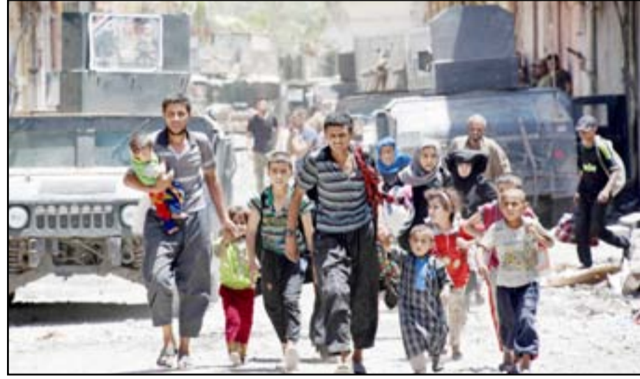
مديون يسبرون قرب قوة عسكرية غربي الموصل.. أ. ف ب

وتستمر عملية الانتقال من مبنى إلى آخر مروراً بكلية الطب التي يتخذ العسكريون من مدرجاتها مكاناً للاستراحة قبل العودة إلى خطوط القتال.