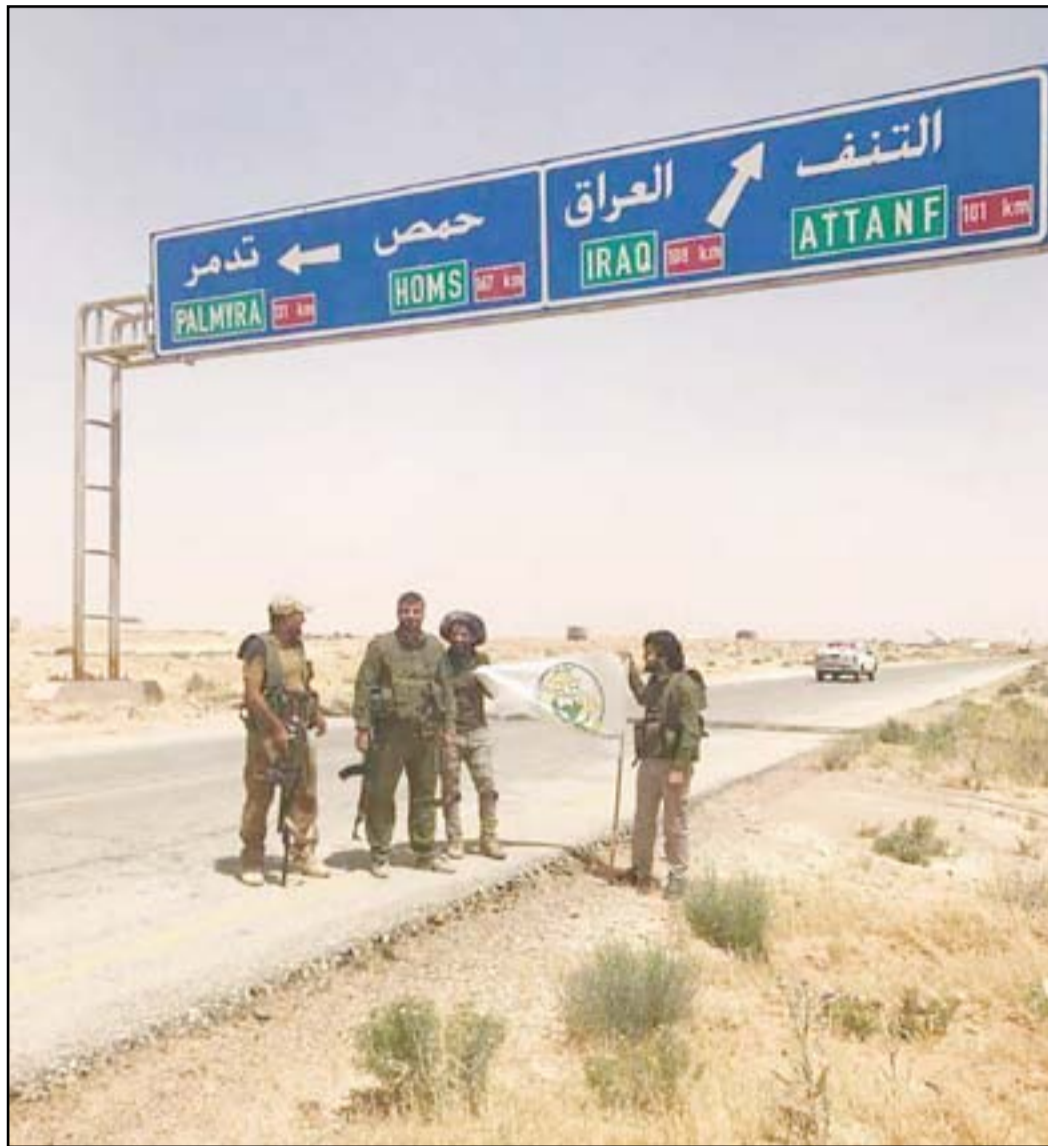
قوة من الحشد قرب الحدود السورية.. أ. ف ب

وقال احد الرجال الذي توقف لشرب الماء بعد حلول الافطار ان "قوات الحشد الشعبي قالوا لنا انه من الخطر جدا