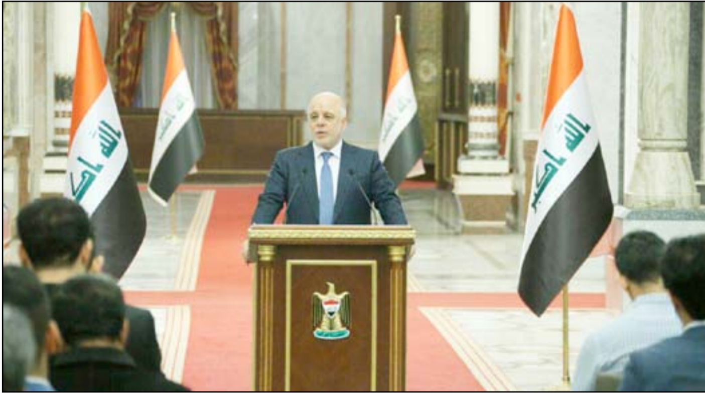
العبادي في مؤتمر صحفي سابق

وكانت وكالة الأنباء الألمانية قد كشفت، يوم الإثنين، عن عزم العبادي زيارة السعودية يوم الأربعاء، والتزمت أوساط رئيس الوزراء الصمت إزاء تساؤلات وسائل الإعلام حول تفاصيل الزيارة التي تأتي في وقت حساس لجهة توتر العلاقة بين دول الخليج. ورداً على سؤال حول عدم إعلان العراق موقفه من الأزمة التي يشهدها الخليج، قال رئيس الحكومة، خلال مؤتمره الصحفي الأسبوعي الذي تابعته (المدى) مساء أمس، "إننا أعلننا عن موقفنا مسبقاً.. ونحن حريصون على التعامل مع الجيران لإطفاء كل النيران، فمثلاً أوقفنا الأموال القطرية في مطار بغداد. الآن نحن متحفظون على هذه الأموال في البنك المركزي وهناك لجنة عراقية من أجل الإشراف على هذه الأموال وممثلون عن قطر حاضرون في اللجنة أيضاً". وأضاف العبادي "نحن لسنا جزءاً من المشكلة الآن... سنصبح جزءاً من المشكلة إذا تعلق الأمر بالارهاب، وطلبنا من السعودية وقطر الوثائق التي يحملونها حول خلافاتهم. نحن نرفض الحصار وهذا الموقف ليس قراراً سياسياً، إنه مبدئي". وتابع رئيس الوزراء "أما بالنسبة لزيارتنا إلى السعودية في هذا الوقت، فأنا مدعو لهذه الزيارة قبل سنة تقريبا،