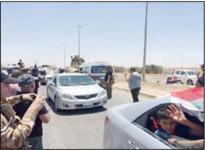
جنود يرحبون بالعائل العائدة الى مناطقها في تكريت.. أ. ر. شيف

وبكلمات متقطعة تصيف "الوضع صعب للغاية.. لم يبق لدينا كهرباء ولا ماء ولا دواء، لا شيء لدينا إلا رجعتنا، هو أرحم الراحمين". وتخوض القوات العراقية معارك في آخر الأحياء الواقعة تحت سيطرة تنظيم داعش في غربي الموصل في إطار هجوم بدأته قبل سبعة أشهر تمكنت خلاله من طرد تنظيم داعش من القسم الأكبر من المدينة. لكن المناطق المتبقية في آخر