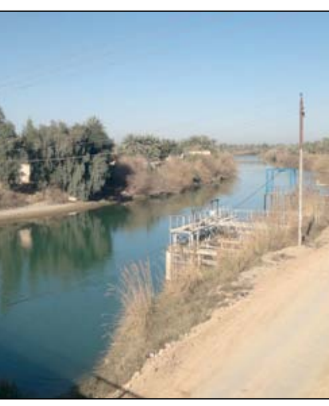
قصر الملك غازي - شاهد على صفحة من التاريخ

"مدرسة التهذيب" حاضرة مؤتمر أنصار السلام 1959