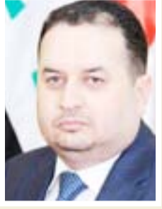
جمال المحمداوي نائب عن البصرة

"بالنظر لأهمية ودور المراقب الجوي وعمله في الاجواء العراقية، وبالنظر لحركة الطائرات الكبيرة بعد إعادة افتتاح الاجواء العراقية أمام شركات الطيران أصبح من الضروري زيادة أعداد المراقبين الجويين، من ٢٨ إلى ٥٠ مراقبا، أننا نعمل من أجل رفع كفاءة العاملين عبر ادخالهم في دورات تطويرية ليتمكنوا من القيام بمهامهم على أكمل وجه."