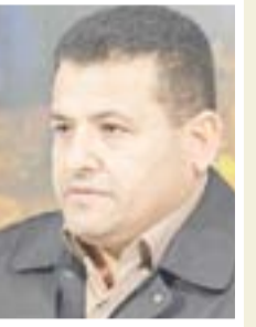
قاسم الاعرجي وزير الداخلية

"بمناسبة شهر رمضان المبارك وقرب حلول عيد الفطر السعيد وتزامنا مع الانتصارات الكبيرة التي تحققتها قواتنا الأمنية في معارك تحرير الارض ضد عصابات داعش الارهابية وقرب اعلان النصر النهائي على العدو، أمرنا بإلغاء العقوبات الانضباطية المنتسبي وزارة الداخلية كافة، أن هذا الأمر جاء تمييزاً لدور قواتنا الأمنية البطلة وما تبذله من جهود في شتى مجالات عملها الأمنية والخدمية والإدارية."