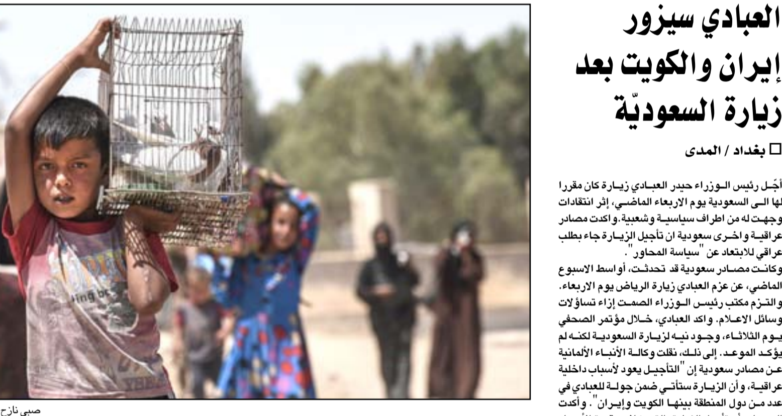
صبي نازح من غربي الموصل يحمل قفصا للحمام.. أ.ف.ب

□ بغداد / المدى أجل رئيس الوزراء حيدر العبادي زيارة كان مقرا لها الى السعودية يوم الاربعاء الماضي، إثر انتقادات وجهت له من اطراف سياسية وشعبية. وأكدت مصادر عراقية واخرى سعودية ان تأجيل الزيارة جاء بطلب عراقي للايتعاد عن "سياسة الحوار". وكانت مصادر سعودية قد تحدثت، أواسط الاسبوع الماضي، عن عزم العبادي زيارة الرياض يوم الارباء، والتزم مكتب رئيس الوزراء الصمت إزاء تساؤلات وسائل الاعلام. واكد العبادي، خلال مؤتمر صحفي يوم الثلاثاء، وجود نية لزيارة السعودية لكنه لم يؤكد الموعد. إلى ذلك، نقلت وكالة الأنباء الألمانية عن مصادر سعودية إن "التأجيل يعود لأسباب داخلية عراقية، وأن الزيارة ستأتي ضمن جولة للعبادي في عدد من دول المنطقة بينها الكويت وإيران". وأكدت المصادر أن تأجيل الزيارة، التي كانت مقررة الأربعاء الماضي، جاءت بناء على طلب عراقي. إلى ذلك نقلت وسائل اعلام عربية عن مصدر في مكتب رئيس الوزراء العراقي، نفيه صلة الحكومة العراقية بإعلان موعد الزيارة، مؤكدا أن "الحديث عن يوم الأربعاء كان إعلانا لم يكن للعراق دخل فيه، وان المسؤولين العراقيين فوجئوا بحديث بعض وسائل الإعلام عن ذلك". إلى ذلك، نقلت الوكالة الألمانية عن عضو ائتلاف دولة القانون جاسم محمد جعفر اتهامه للسعودية بـ "تعهد" نشر خبر الزيارة بهدف "إحراج" العراق ومعرفة موقفه من الأزمة الخليجية الأخيرة، معتبرا ان "الزيارة ليست من مصلحة العراق في الوقت الحالي". □ التفاصيل ص ٢