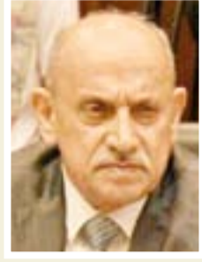
كاظم فتحان الجمالي وزير النقل

"بحث مع وزير الموارد المائية الدكتور حسن الحنابي، عدد من القضايا المهمة المتعلقة بحصة محافظة المثني المائية، وتم خلال اللقاء التأكيد على ضرورة إيصال حصة المحافظة ورفع التجاوزات والإسراع باكمال مشروع التعزيز، ان الوزير الجنابي وعد بأنه سيقوم بمفاتحة رئيس الوزراء لإكمال مشروع التعزيز، وكذلك متابعة ملف المتجاوزين على الحصة المائية."