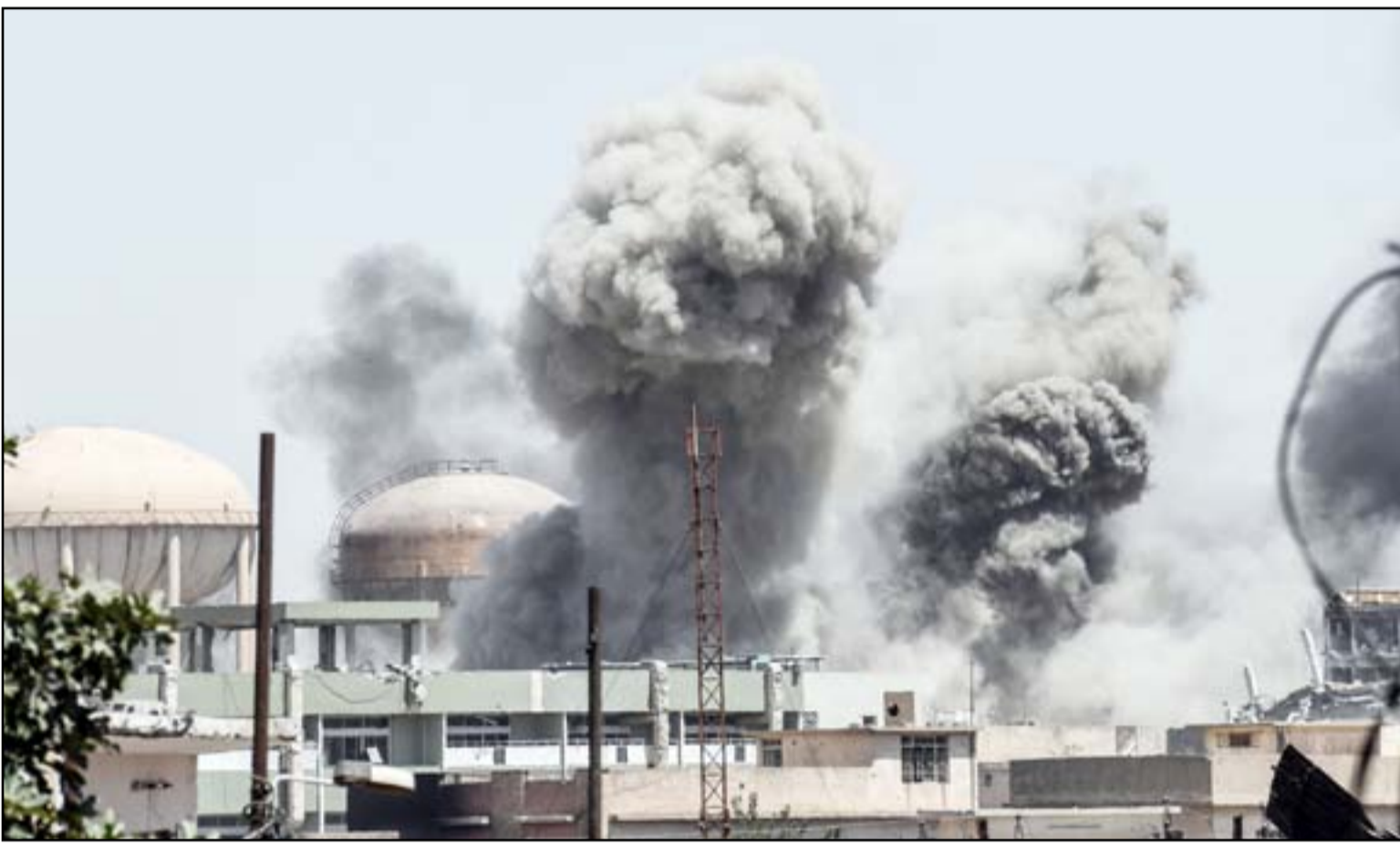
دخان متصاعد خلال عمليات تحرير حي الشفاء...