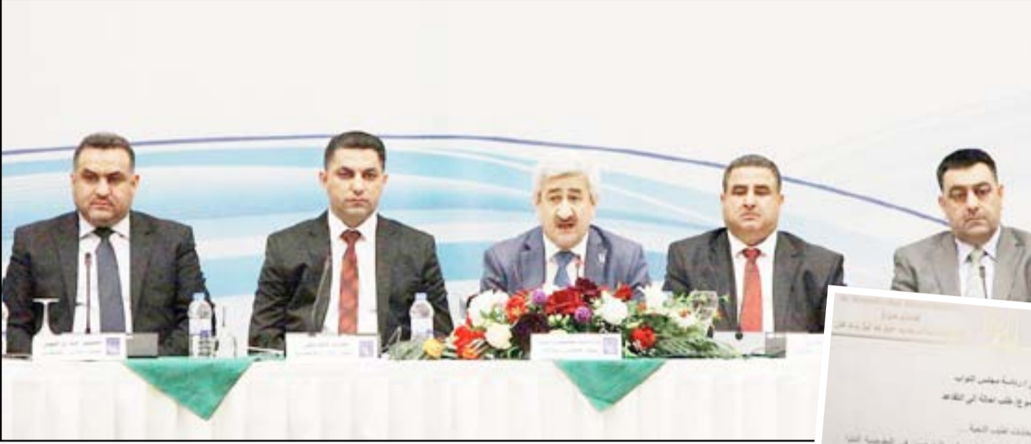
المفوضية العليا للانتخابات

انتهى الحراك الذي انطلق منذ شهرين بين زعماء الكتل السياسية بمنح طاقم مفوضية الانتخابات حقوقهم التقاعدية مقابل تراجعهم عن الترشح لمجلس المفوضية الجديد. وجاء الاتفاق الذي قبله زعيم التيار الصدري بعد فشل كتلته في البرلمان بإقالة المفوضية، الامر الذي دفعها لتأجيل طرح الثقة بمجلس المفوضية لحين إتمام الصفقة.