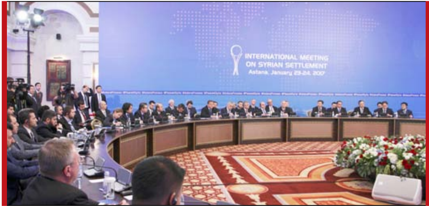
□ موسكو- دمشق / أ.ف.ب- BBC

نقلت وكالة "تاس" الروسية للأنباء، عن نائب وزير الخارجية الروسي، ميخائيل بوغدانوف، قوله، أمس السبت، إن موسكو، تأمل عقد اجتماع بين الأطراف المشاركة في المحادثات السورية، في أستانة، عاصمة كازاخستان، في الرابع والخامس من يوليو/تموز.