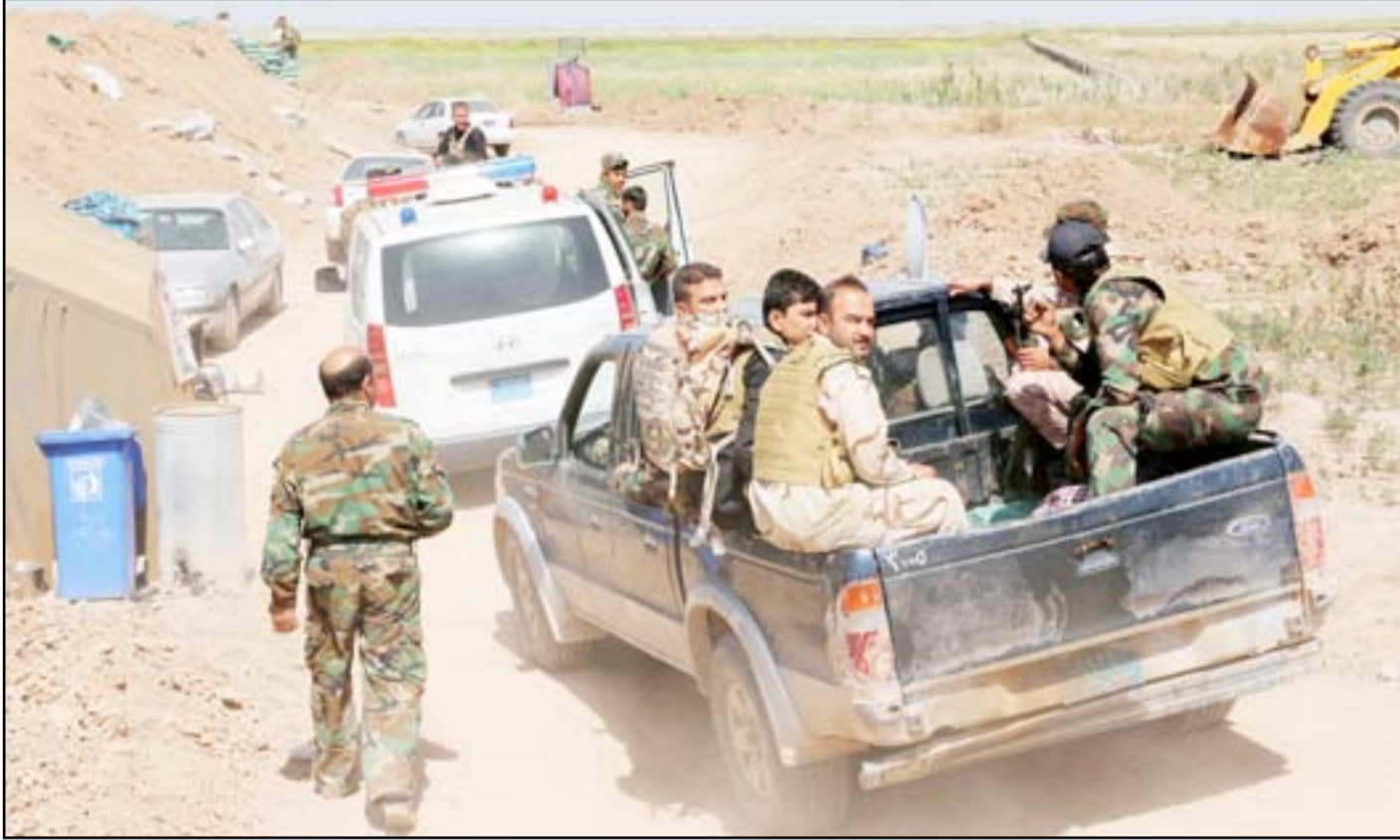
قوة من حشد الحويجة جنوبي كركوك..