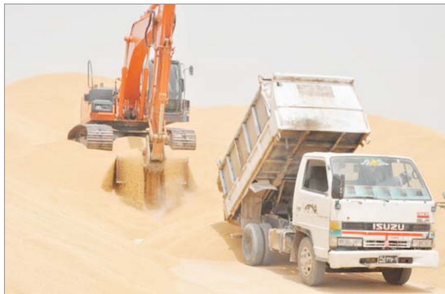
تسويق الحنطة في واسط...

فلاحو المحافظة يعلنون "الافلاس" بعد تأخر مستحقاتهم المالية