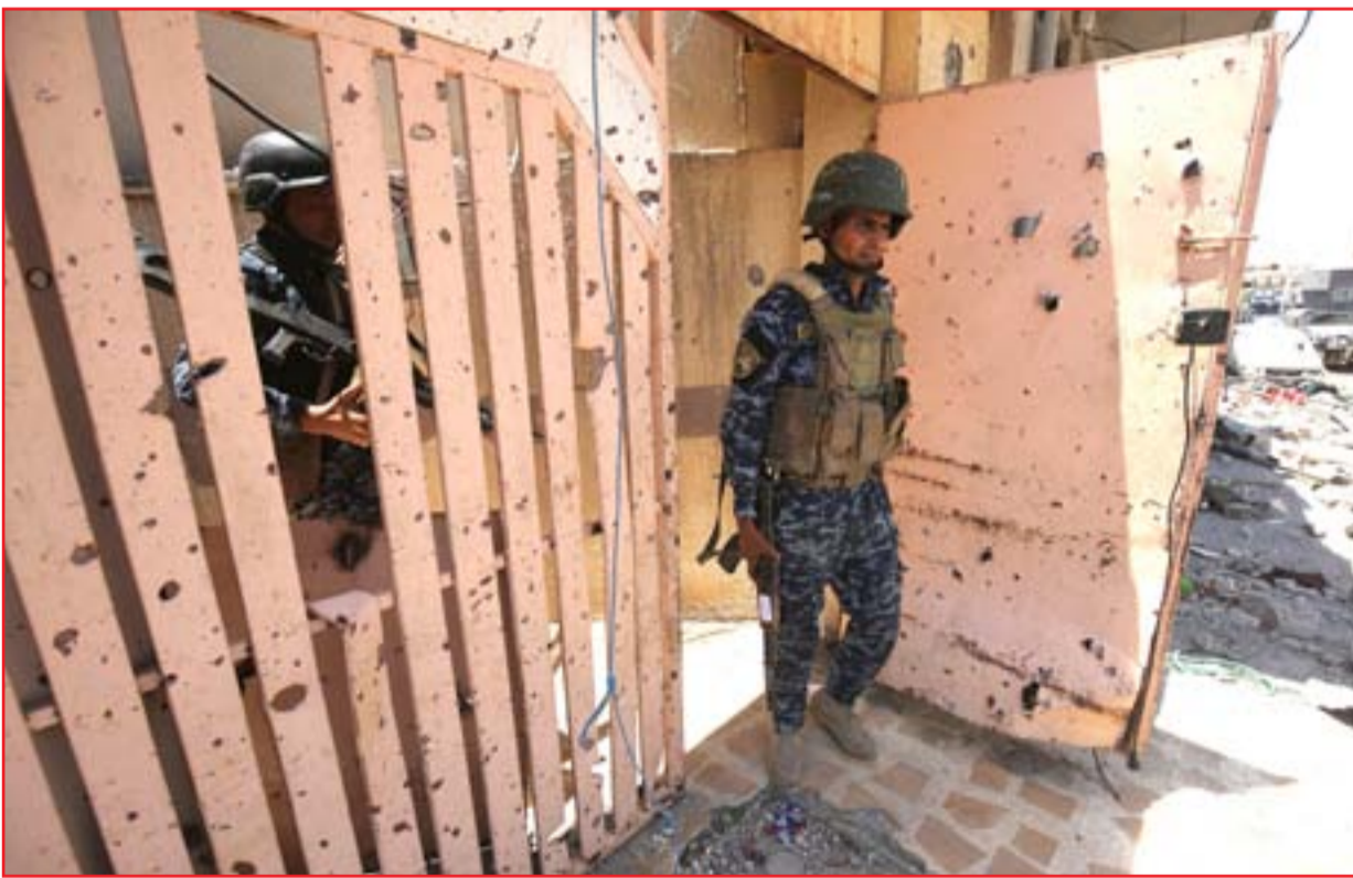
جندي يقف أمام منزل في حي النجيلي غربي الموصل.. أ.ف.ب

أطلقت القوات العراقية، عملية عسكرية، وصفت بـ"الواسعة" لتأمين الشريط الحدودي بين الأنبار وسوريا. في غضون ذلك أعلن الجيش انه حرر منفذ الوليد الحدودي الرابط بين البلدين. كذلك قامت القوات بعمليات تمهيد في مناطق الصجر الغريبة، التي كانت تعد منطلقاً لشن هجمات على حرس الحدود وعناصر الجيش. ويرتبط العراق مع سوريا بشريط حدودي، يبلغ طوله نحو ٦٥٠ كم، يمتد من شمال غرب نينوى الى غرب الأنبار. وقالت خلية الاعلام الحربي، التابعة لقيادة العمليات المشتركة، امس السبت، ان "قيادة قوات الحدود تنطلق بعملية واسعة باسم (الفجر الجديد) لتحرير مناطق الشريط الحدودي في المنطقة الغربية ومن ثلاثة محاور". وقال بيان للخلية، اطلعت عليه