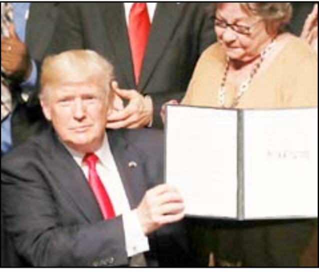
□ وشانطن / أ.ف.ب- سكاى نيوز

كشفت مجلة فورين بوليسي، عن خلاف داخل الإدارة الأمريكية بشأن الحرب في سوريا، حيث نقلت عن مصدر مطلع على النقاش داخل إدارة دونالد ترامب أن عدداً من كبار المسؤولين في البيت الأبيض يدفعون نحو توسيع الحرب في سوريا باعتبارها فرصة لمواجهة إيران وقواتها بالوكالة على الأرض هناك، في مقابل رفض البنتاغون. وأوضحت المجلة الأمريكية، على موقعها الإلكتروني السبت، أن عزرا كوهين واتيكي مستشار الاستخبارات في مجلس الأمن القومي، وديريك هارفي، كبير مستشاري شؤون الشرق الأوسط بالمجلس، يدفعان نحو شن الولايات المتحدة هجوماً في جنوب سوريا، حيث اتخذ الجيش الأمريكي في الأسابيع الأخيرة عدة إجراءات دفاعية ضد القوات المدعومة من إيران التي تقاوت دعماً للرئيس السوري بشار الأسد. وبحسب المصادر التي تحدثت للمجلة شريطة عدم ذكر أسمائهم، فإن خطط مسؤولي الأمن القومي أشارت رفض الصقور التقليديين في الإدارة الأمريكية، بمن فيهم وزير الدفاع جيمس ماتيس الذي أسقط مقترحاتهم شخصياً أكثر من مرة.