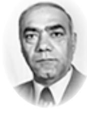
□ عادل العامل

فأنت لا يمكنك أن تجادل بأن عبد الناصر، مثلاً، لم يكن دكتاتوراً بصرف النظر عن أعمال إيجابية أنجزها مصر، أو تصف غاندي بأنه مهان للاستعمار الإنجليزي لأنه قاومه بسياسة اللاعنف وليس بالثورة المدمرة، أو تقول عن كاسترو إنه فاشل في ثورته الواقعية بينما ما يزال نظامه الاشتراكي صامداً رغم التامرات الأميركية المستتية والصعوبات الداخلية. لكنك يمكن أن تتردد أو تختلف مع غيرك في تحديد حقيقة شخصيات نكروما، وعبد الكريم قاسم، وجيفارا، على سبيل المثال، وتتماكك السياسي، والزمن الذي أنت فيه، وأنا أتطرق إلى موضوع كهذا هنا، لا محاولة مني لتشويه صورة أحد منهم ومن شاكلهم في مواقفه السياسية والعامية أبان وجوده في السلطة أو العمل السياسي، وإنما لأن تمجيد مثل هذه الشخصيات بصورة شمولية وبشكل مبالغ به لا يتفق وواقع الحال أحياناً، يمثل برأيي خداعاً للذات، أو جهلاً تاماً، أو تضليلاً للرأي العام، وإن حسنت النية؛ فعندما نتكلم على نكروما (١٩٠٩ - ١٩٧٢)، مثلاً، علينا الانضفي على إجراءاته الاشتراكية صفة الصوابية المطلقة وأنه كان ديمقراطياً أيضاً، بينما لم تكن