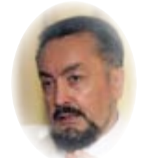
□ هارون يحيى ×