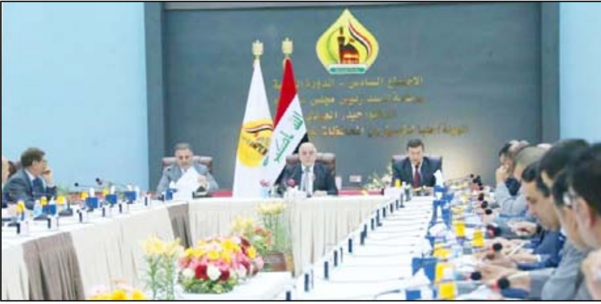
العبادي في اجتماع المحافظات في كربلاء

فاجت الحكومة البرلمان، الذي يتمتع بعطلته التشريعية حالياً، بإعطاء رسمي تطلب فيه من مجالس المحافظات الاستمرار بعملها لحين إجراء الانتخابات التي يبدو أن هناك اتفاقاً على دمجها مع الانتخابات البرلمانية. ومنذ تاريخ ٢٠١٦ من نيسان الماضي، دخلت الحكومات المحلية فراغاً دستورياً نظراً لانتهاء ولاية مجالسها. ويقف مجلس النواب حائراً لمعالجة هذا الفراغ، الذي تشهد المحافظات للمرة الأولى منذ تأسيسها عام ٢٠٠٢.