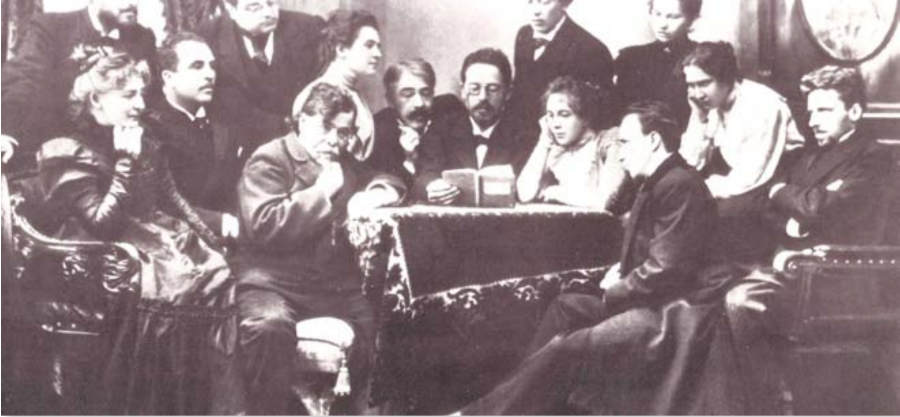
تشيخوف مع فرقة موسكو للمسرح الغني

كانت بطلة السيدة صاحبة الكلب لبيديا افيلوفا التي جلبت إليه مخطوطة أول قصة قصيرة لها، ووقعت على الفور في غرامه. بعدها ادركت انه ما من فرصة لها، وحين نشرت "السيدة صاحبة الكلب"، افترقا، ولم يراها ابدًا، فقد عرف الجميع من هي السيدة التي في الرواية القصيرة.