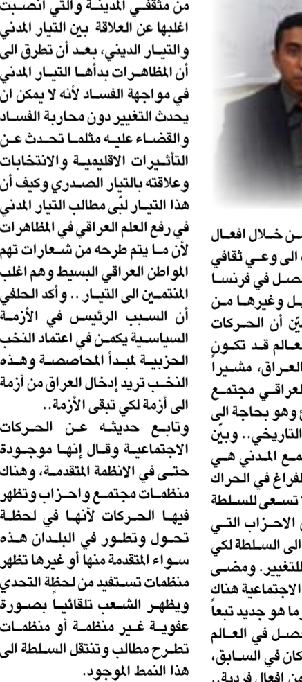
نادي القراءة Reading Club

ثم انتقل الى الحديث عن الواقع السياسي في العراق بعد العديد من المداخلات التي ابداهها جمع كبير من مثقفي المدينة والتي انصبت اغلبها عن العلاقة بين التيار المدني وأن المظاهرات بداها التيار المدني في مواجهة الفساد لأنه لا يمكن ان يحدث التغيير دون محاربة الفساد والقضاء عليه مثلما تحدث عن التأثيرات الإقليمية والانتخابات وعلاقته بالتيار الصدري وكيف أن هذا التيار لبي مطالب التيار المدني في رفع العلم العراقي في المظاهرات لأن ما يتم طرحه من شعارات تهم المواطن العراقي البسيط وهم اغلب المنتمين الى التيار .. وأكد الحلبي أن السبب الرئيس في الأزمة السياسية يكمن في اعتماد النخب الحزبية لمبدأ المحاصصة وهذه النخب تريد إدخال العراق من أزمة الى أزمة لكي تبقى الأزمة..