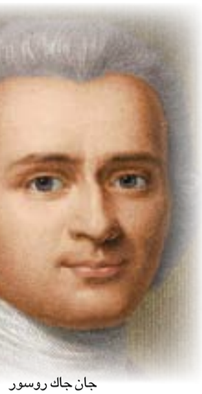
جان جاك روسو

والسبب في رأبي ليس طول الالفه وكثرة الروايات ولا ضعف اهمية الأدب التقليدي المعروف ولكن اليوميات وكتب السيرة والمراسلات تزود القارئ بالخفي، هي، وبخاصة السيرة، تستجيب لحاجة الناس الى النفاذ وراء المرئي ووراء ما تتداوله او تعلقه الاخبار. هنا نعرف ما وراء الاحداث وما وراء حياة الاسماء