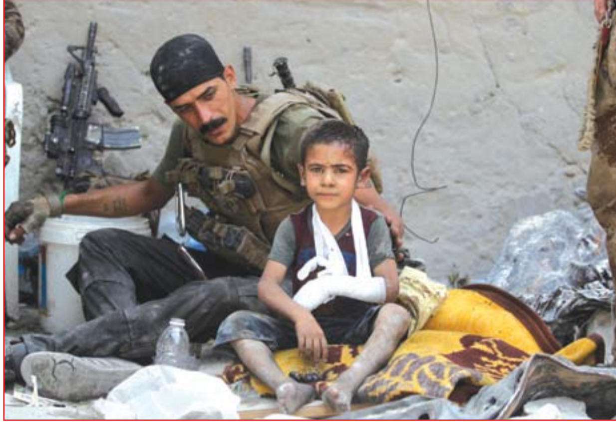
جندي يُظلي طفلاً مصاباً من الموصل القديمة .. أ.ف.ب

تحرير قوات الشرطة الاتحادية لمنطقة باب السراي في وسط المدينة القديمة ورفع العلم العراقي فوق مبانيها". وأضاف البيان إن "قطعات الشرطة الاتحادية حررت المرباب ذا الطوابق وجامع الخزام وساحة النقل الأيمن في المدينة القديمة"، مشيراً إلى أن "القطعات كبدت عناصر داعش خسائر كبيرة". وأكدت قيادة العمليات "اندفاع