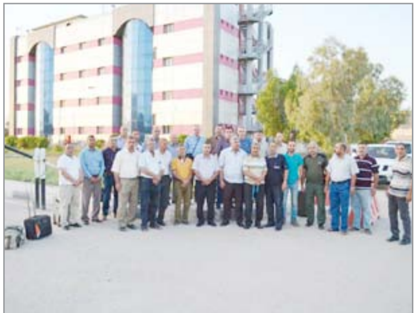
الكادر الطبي في الموصل