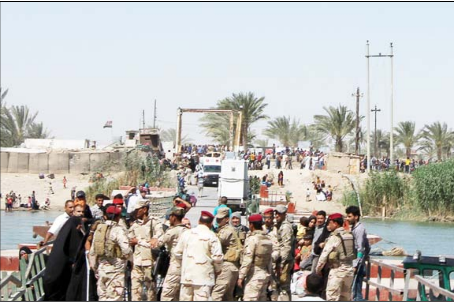
قوة عسكرية على جسر بزيين.