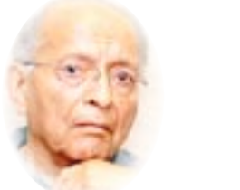
□ د. رفعت السعيد

ثم يتحدى سلامة موسى الجميع فيكتب كتيبا صغيرا من ثلاثين صفحة عنوانه "الاشتراكية" (عام ١٩١٣) ويتبدى الكتابة فيه قائلاً: يدعوني إلى كتابة هذه الرسالة الوجيزة كثرة السخافات والغبوات التي تحكي عن الاشتراكية. فغرضي الأول منها تنوير الرأي العام عن ماهيتها مع بيان اغراض الاشتراكيين في أوروبا وأميركا ونكر ماأثرهم في التشريع وما وصلت اليه حالة العمال من الرفاهية بمساعيهم ولكننا من البداية نقرر اننا ازاء كتابة فابية تنفي عن نفسها اية مسحة ثورية، فهو يبدأ كتابه قائلاً "ولست طامعا أن تعد هذه الرسالة دعوة للجمهور الي الاشتراكية ولا أن تكون سببا في تأليف حزب أو جمعية، ولكني اطرحها امام الجمهور القارئ عسى أن تكون خميرة تختصر بها الأفكار إلى حين تستعد البلاد للاشتراكية(ص5). ونقرأ في فابية تأثر بها تأثرا مباشرا ومكثفا من برنارد شو، فهو يعتبر تملك الحكومة المصرية لمرافق السكك