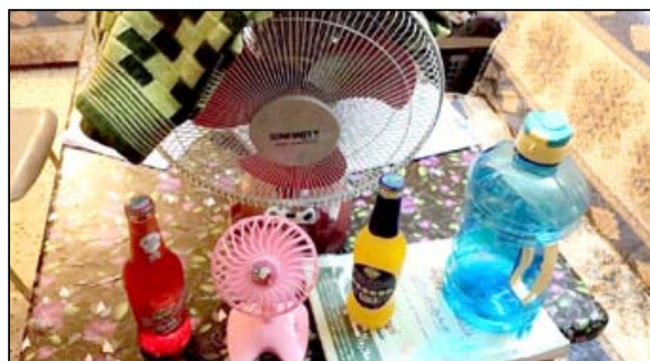
بعض مما يحتاجه الطلبة في الامتحانات

يفترض أن يكون توقيت امتحانات السادس كما كان معمولاً به سابقاً مع امتحانات الثالث المتوسط وبالتناوب ( بين يوم ويوم ). لأن عديد ايام المراجعة الطويلة تصيب طلبة السادس بالملل والفتور، والنسيان لبعدها المراجعة عن يوم الامتحان