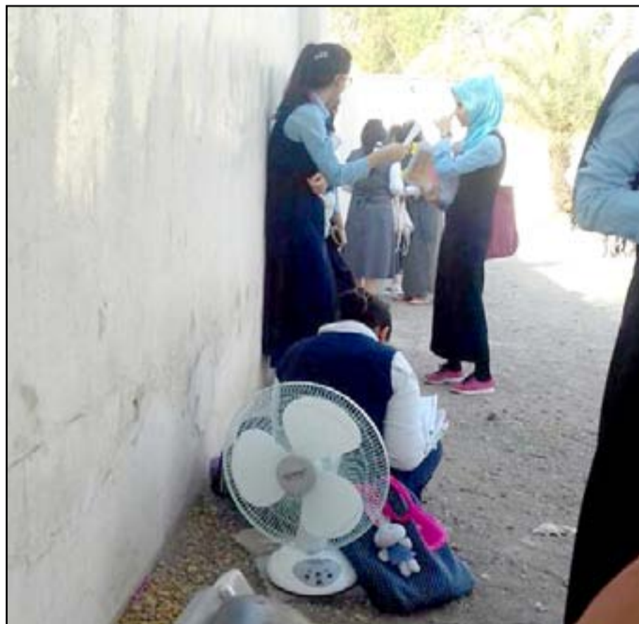
المرحة المشحونة من ضروريات الامتحان النهائي

وقال المتحدث باسم وزارة التربية إبراهيم السبتي، في بيان صحفي، إن استخدام تلك الأجهزة من شأنه أن يحذ من