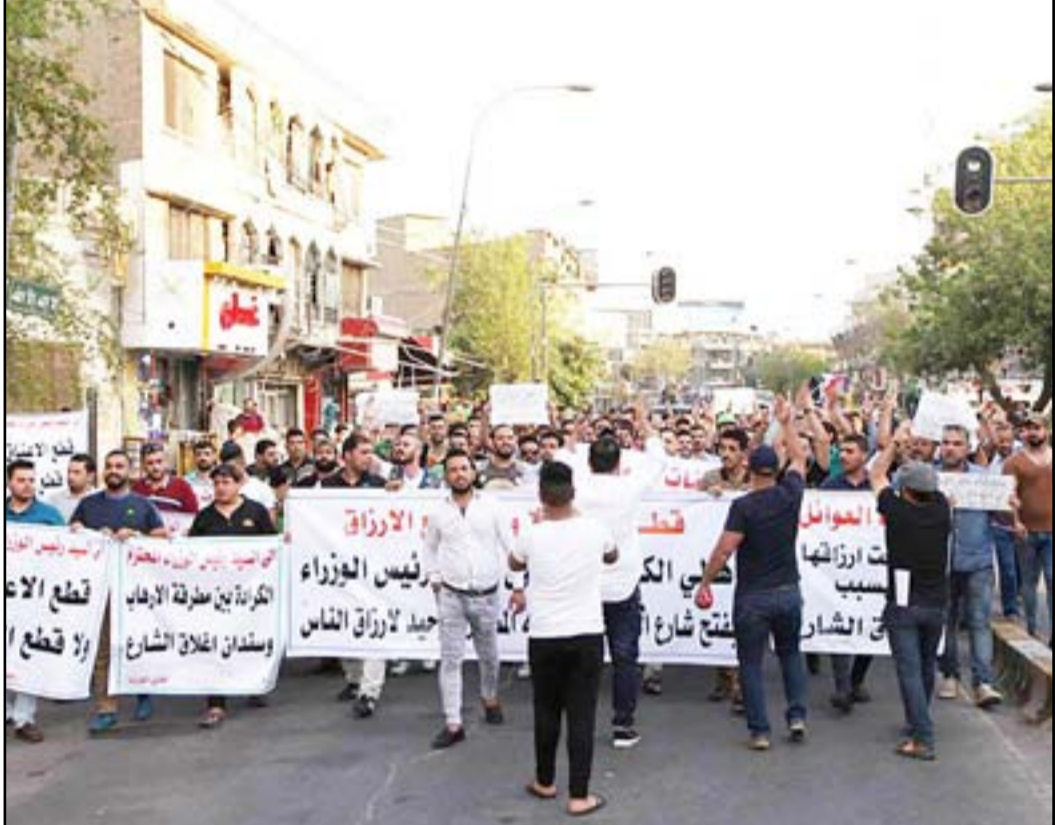
كراةيون خلال تظاهرة... أرفيف