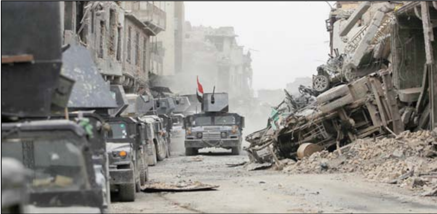
رتل من مكافحة الارهاب في الموصل القديمة امس... ا.ف. ب

تخوض قوات مكافحة الإرهاب والشرطة الاتحادية آخر معارك الموصل القديمة بعد أن نجحت بتحرير حي الميدان وشارع النجفي وقتلت العشرات من مسلحي داعش بينهم قيادات بارزة باتوا محاصرين في جيوب بمحاذاة نهر دجلة . في هذه الاثناء أعلنت قيادة الشرطة الاتحادية، عن إنجاز مهامها القتالية في مدينة الموصل، بالترزامن مع تحرير عدد من المناطق .