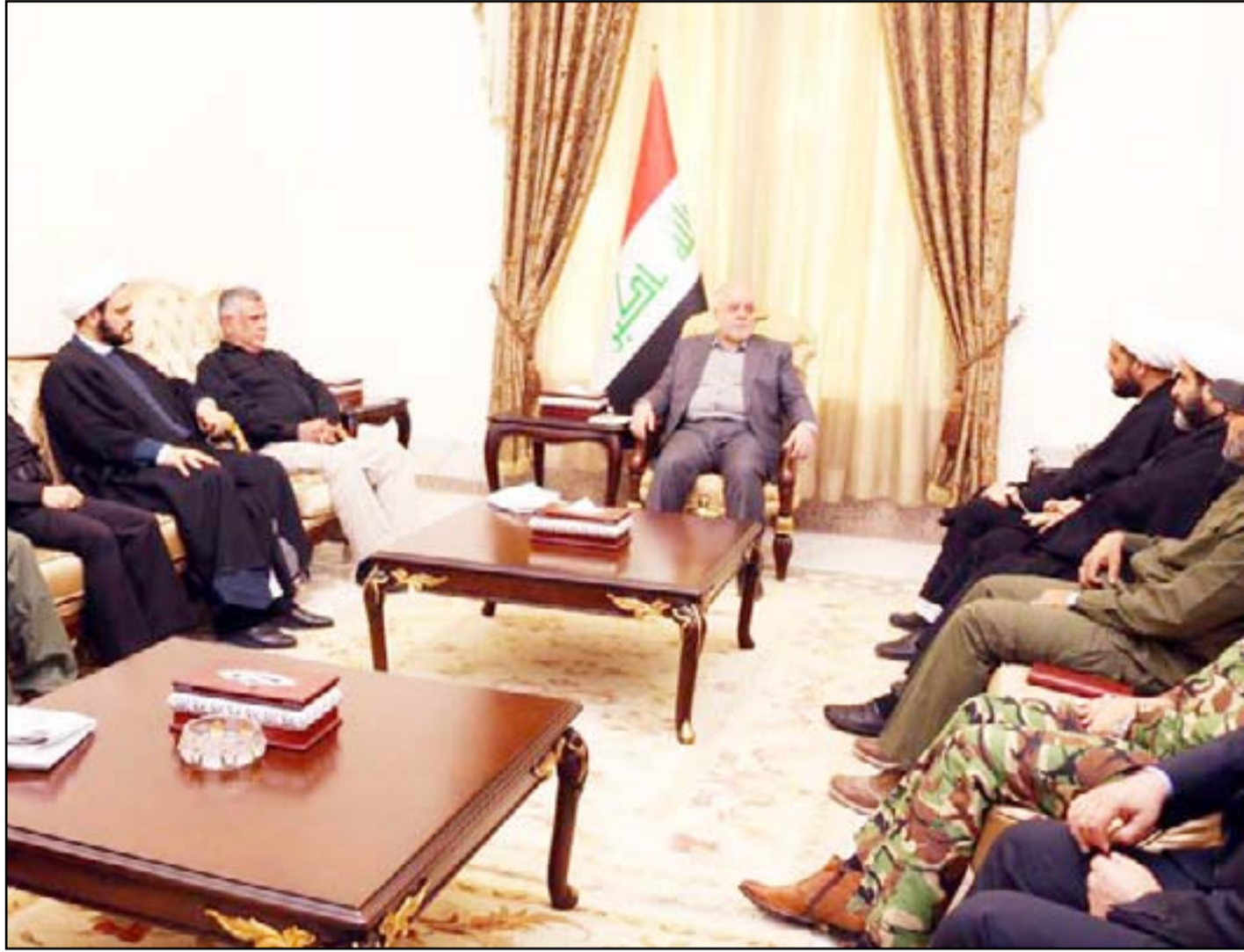
العبادي وقادة الحشد الشعبي في لقاء سابق

إعمار البنية التحتية وإنشاء مرافق خدمية بالإضافة إلى تأمينه تمهيداً لإعادة افتتاح المفذ. وتتحدث المصادر عن وجود مخاوف من عدم احتواء الإزمة لاسيما مع رغبة العبادي بتقليص أعداد الحشد الشعبي إلى (٨٠) ألف مقاتل وتسريح كبار العمر والمتطوعين من الموظفين. وتتوقع المصادر أن تظهر الخلافات بين العبادي وقادة الحشد بشكل أوضح بعد إكمال تحرير المدن العراقية من سيطرة داعش. وتقول المصادر "هناك فصائل تريد التحرك من دون الرجوع إلى القائد العام للقوات المسلحة، ماثار حفيظة العبادي الذي يريد ان تكون الإدارة لكل القطعات العسكرية مركزية". وكشفت المصادر أن "الولايات المتحدة الأمريكية ودولا خليجية تدفع باتجاه حل هيئة الحشد الشعبي". واتهم نائب رئيس الحشد الشعبي أبو مهدي المهندس، مؤخرًا، الولايات المتحدة بشن حملة "تفسيه"، وصفها بـ"الشديدة"، تستهدف بث الفرقة بين صفوف الحشد والضغط باتجاه تقليصه. وأكد المهندس أن الحشد مؤسسة رسمية لن تدخل الانتخابات باستثناء بعض الأحزاب التي هي أصلاً مشتركة في العملية السياسية. وتؤكد المصادر أن "العبادي بدأ يدرس في الوقت الحالي إصدار تعليمات لتطبيق قانون الحشد الشعبي، وفي حال عدم تمكنه سيرسل التعديل الأول على قانون الحشد للبرلمان من أجل إجراء بعض التعديلات وإضافة صيغ جديدة تمكنه من حل هذه التقاطعات. وتشكل قيادة هيئة الحشد أبرز نقاط الخلاف التي تواجه رئيس الوزراء. وتقول المصادر "هناك خلافات حادة حول رئاسة هيئة الحشد الشعبي في حال صدرت التعليمات لتنفيذ القانون، فهل ستكون شخصية سياسية أو عسكرية". ووضحت المصادر ان "قادة الحشد يرغبون في إناطة القيادة لشخصيات سياسية، أما العبادي فيريد تعيين شخصيات عسكرية تتمتع