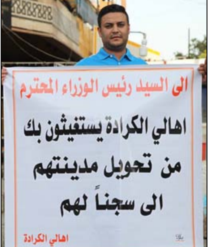
كراةيون خلال تظاهرة...