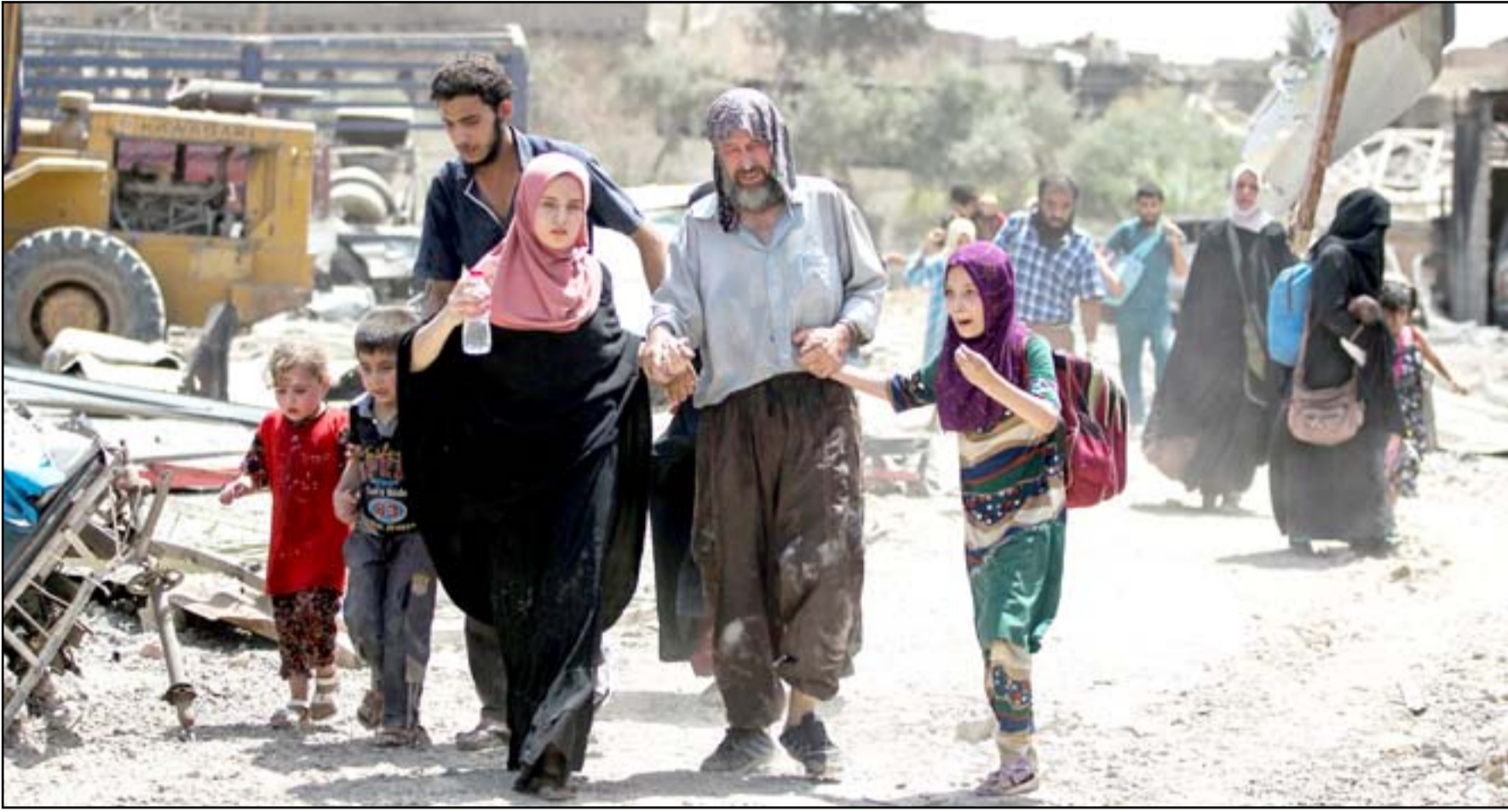
مدينون يحاولون الخروج من الموصل القديمة..