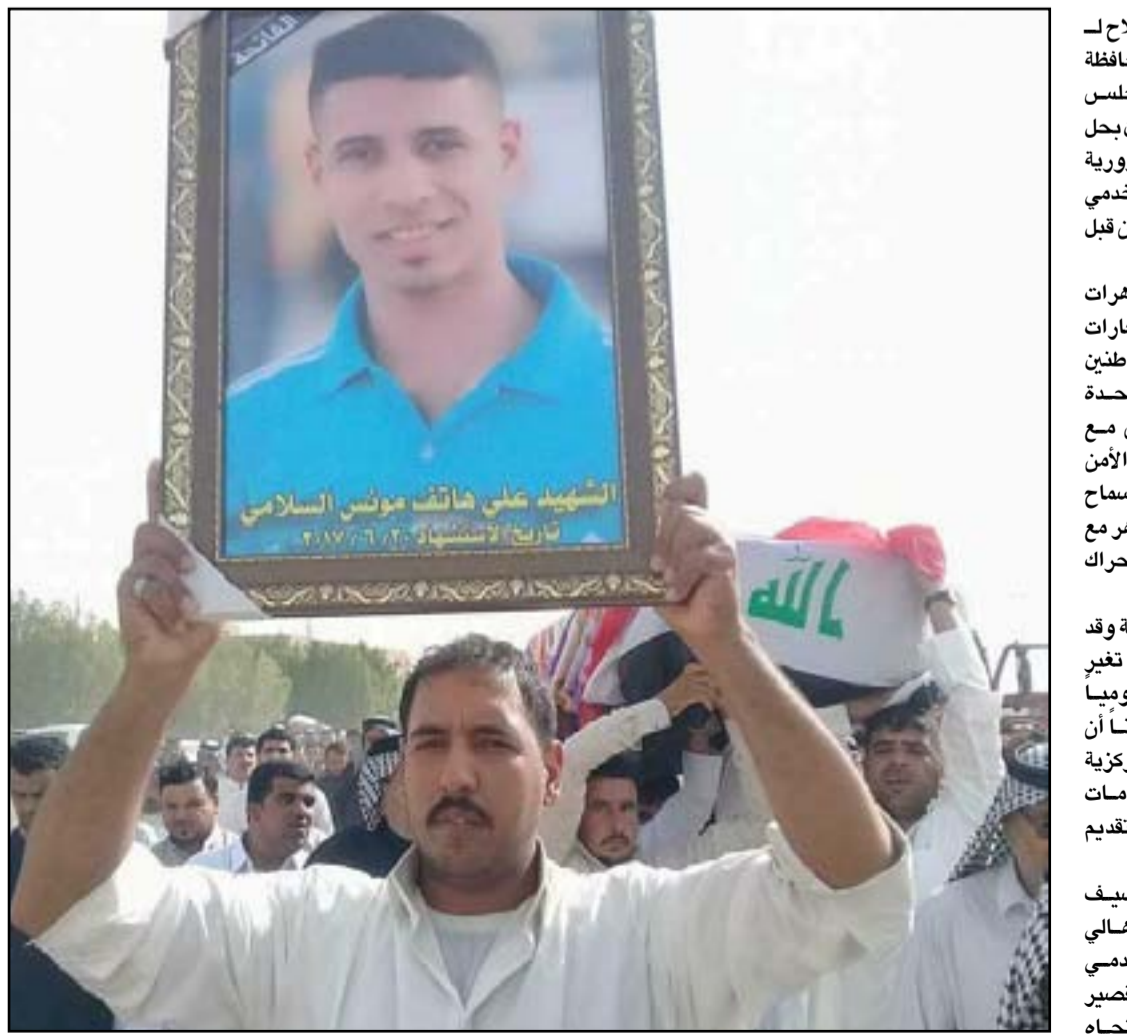
تشيع لاحد ضحايا تظاهرات النجف .. ارشيف

تظاهر المئات من أبناء محافظة بابل، أمس الجمعة، للمطالبة بتحسين الواقع الخدمي بالمحافظة، محمليين الحكومتين المركزية والمحلية مسؤولية تردى الطاقة الكهربائية وتفاقم أزمة المياه بمختلف مناطق المحافظة، فيما طالبوا بفتح ملفات الفساد المالي والإداري بشأن هذا الصدد.