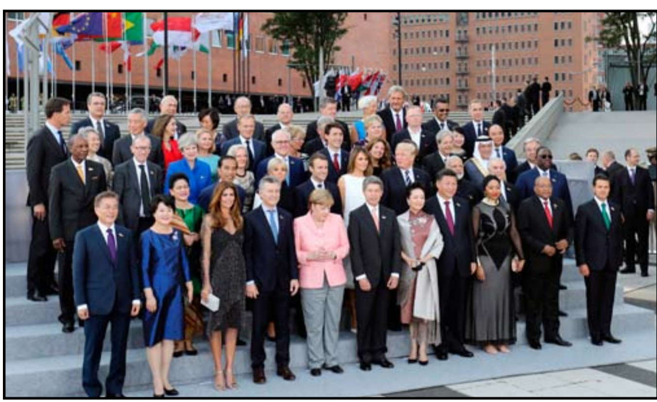
قادة قمة العشرين في صورة تذكارية

وتسعى ميركل أيضا إلى التوصل "لحل وسط" في ما يتعلق باتفاقيات الاحتباس الحراري والبيئة. فالولايات المتحدة، وفقا لأمر رئاسي من ترامب، انسحبت من اتفاق باريس للتغير المناخي الشهر الماضي، لأنه يعتقد أن هذه الاتفاقية تضعف الولايات المتحدة