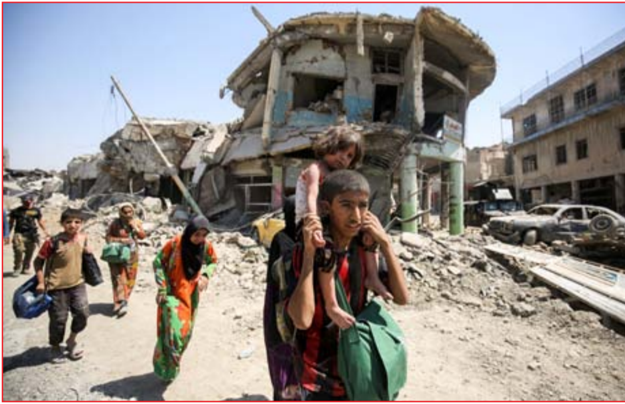
مدنيون أثناء مغادرتهم أحياء الموصل القديمة

متظاهرو بابل يهددون بالتصعيد بسبب أزمة الكهرباء والماء