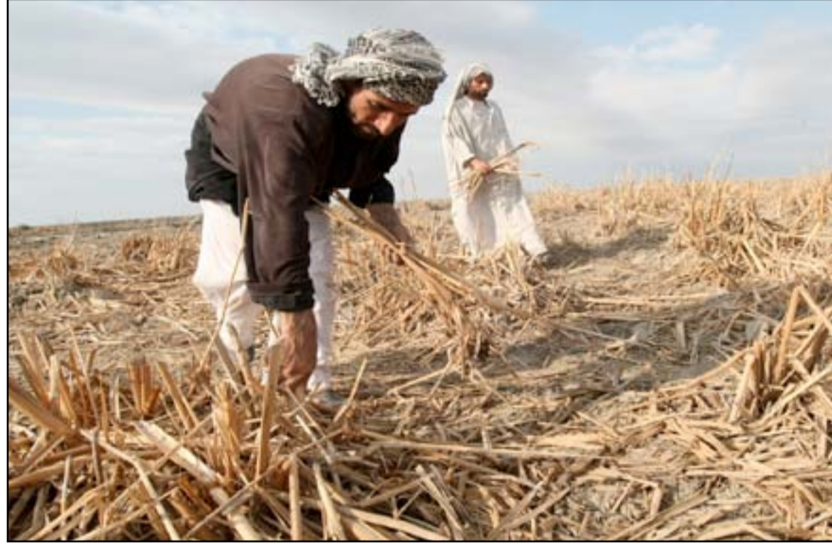
الجفاف يضرب الاهوار في جنوبي العراق .. ارشيف

اسباب اخرى للموت وجدت لها مكانا خلال هذا الاسبوع كوفاة شرطي مرور في البصرة تحت تأثير موجة الحر لوقوفه عدة ساعات في حرارة الشمس التي بلغت درجتها اكثر من ٥٠ درجة مئوية بملابس غير مناسبة وفي مكان خال من المظلات المرورية .. وهذا الرجل لم يقتل بيد مجرمة بشكل مباشر لكنه ذهب ضحية الإهمال الحكومي فلا من تقلص لساعات عمل شرطة المرور في الظروف الجوية ولامن عالية صحية تقههم عوارض التعرض لضربة الشمس أو التشنج...وإذا كان يمكن لاسرة قتل الصقور أن تحصل على فصل عشائري من اسرة المنتسب فمن سيدفع ثمن حياة شرطي المرور ؟... انه الموت -السهل- الذي ينتقل كالشمس بيننا في العراق ليختطف ارواحا بريئة تحت مسميات واسباب مختلفة كالقتل الطائفي ، واختلاف الافكار، والانجسار ،بينما تبقى الضحية واحدة دائما ..(المواطن العراقي .. يكون مكشوف الظهر)!!