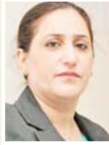
أشواق الجاف حقوق الإنسان التيابية

"الوضع الإنساني للعوائل النازحة في المخيمات وصل إلى حالة مأساوية بسبب درجات الحرارة المرتفعة التي قد تتسبب بحالات وفاة لبعض الأطفال في المخيمات، وبالتالي فأنتنا نوجه استغاثة فورية إلى رئيس مجلس الوزراء لتوفير كرفانات للعوائل التي لديها أطفال بدل المخيمات التي لا تقاوم ارتفاع درجات الحرارة العالية، وضرورة مخاطبة ومفاتحة الدول التي تقدم مساعدات للنازحين بهذا الشأن.