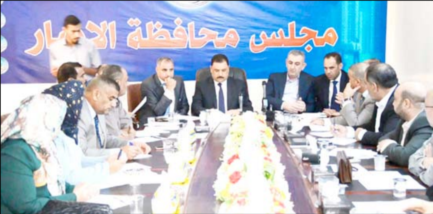
اجتماع سابق لمجلس محافظة الانبار