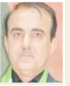
أريز عبدالله الطاقة النيابية

"لجنة الطاقة الوزارية عليها تحمل مسؤولياتها لحل أزمة الكهرباء في ظل الارتفاع الشديد في درجات الحرارة، وما رافقها من أزمة حادة في نقص تجهيز الطاقة الكهربائية، وما لذلك من تأثير مؤلم على أبناء شعبنا وخصوصاً عوائل ذوي الدخل المحدود، فلجنة الطاقة النيابية ومنذ بداية عملها، ما زالت تتبنى متابعة هذا الملف الحساس والمهم من خلال استضافة الوزراء المعنيين والمسؤولين، لوضع الخطط الكفيلة والبرامج الحديثة التي تنهي ملف أزمة الكهرباء.