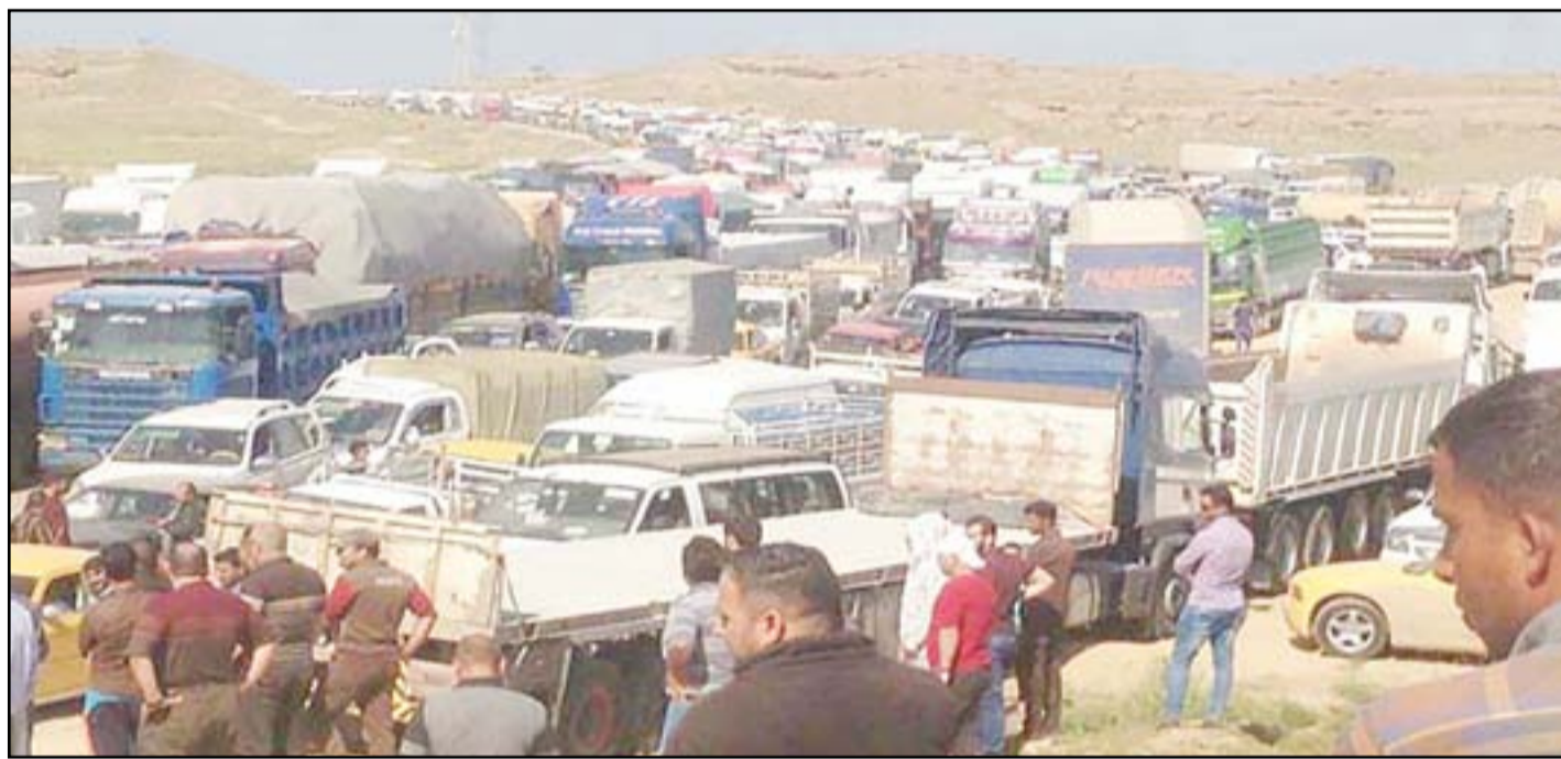
طابور طويل للشاحنات في معبر الصفرية بين كركوك وديالى... أرشيف

مصدر: عدم حصول المحافظة على مستحقاتها المالية يجبرها على اللجوء ل موارد اخرى