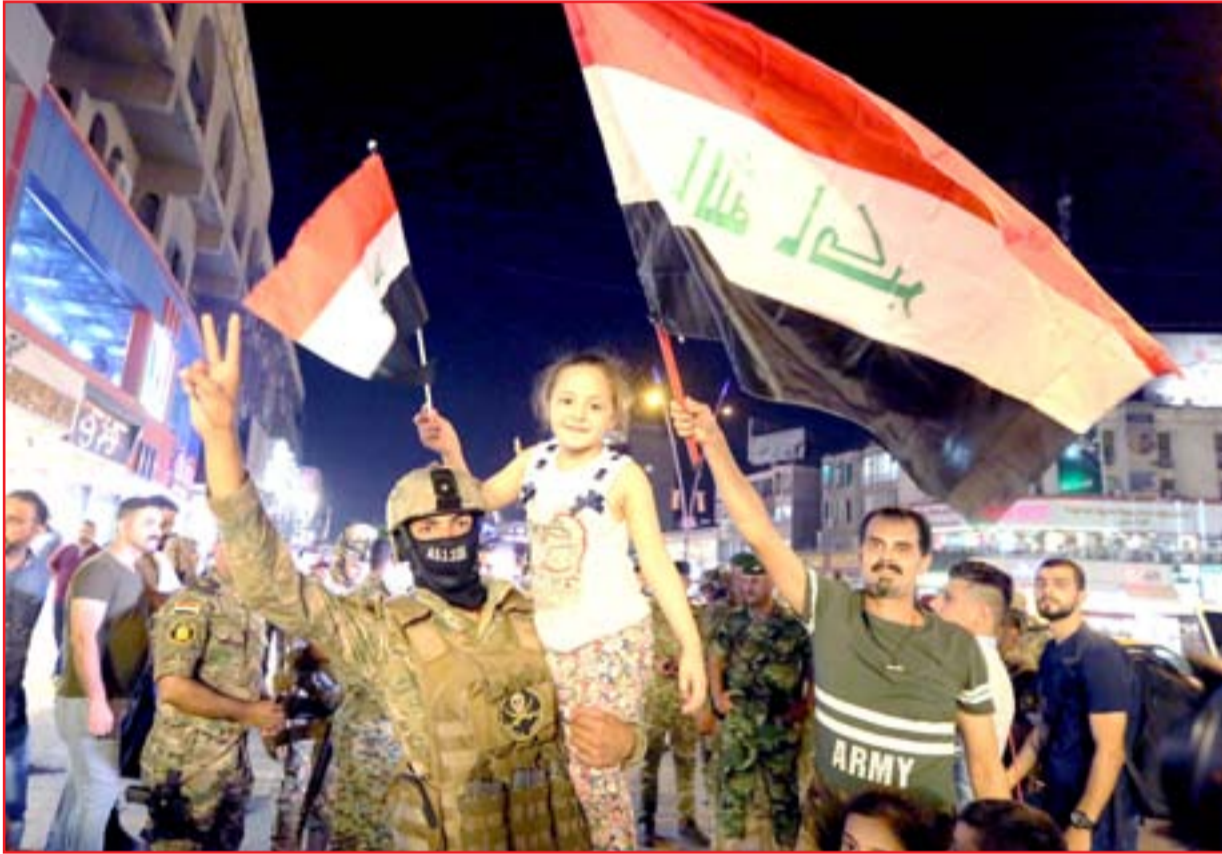
مدنيون وجنود يحتفلون بتحرير الموصل في شوارع بغداد