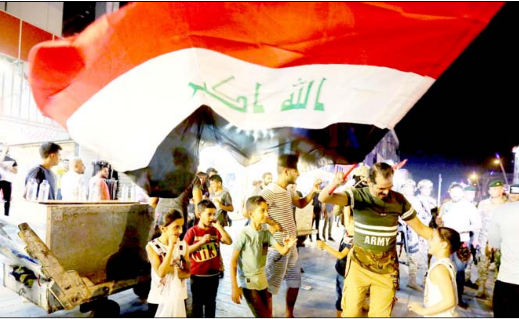
مواطنون يحتفلون بتحرير الموصل غربي بغداد... محمود رؤوف

أشرف في حديثه إلى وجود جيوب لتنظيم داعش تعمل القوات العسكرية على القضاء عليها قبل إعلان التحرير بشكل كامل. وأضاف الحيدري أن رئيس مجلس الوزراء أكد للتحالف الوطني ان الموصل محررة من الناحية العسكرية إلا أنها بحاجة إلى تطهير بعض الجيوب الموجودة في المدينة القديمة التي تتطلب مزيداً من الوقت من أجل