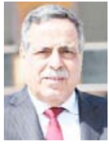
قاسم الزهراوي وزير الكهرباء

"نود أن نوضح للرأي العام ماهية العقد الذي أبرمته محافظة البصرة مع شركة داو الجميخ الإماراتية عام ٢٠١٣، لشراء الطاقة الكهربائية من الوحدات التوليدية الغازية في محطة الهارثة الاستثمارية، التي تبلغ قدرتها (١٠٠) ميكاواط، والذي سددت مبالغ الشراء للشركة في السنوات الماضية من تخصيصات البترول والخاصة بمحافظة البصرة، وكان دور وزارة الكهرباء هو استلام الطاقة المنتجة وتوزيعها في المحافظة.