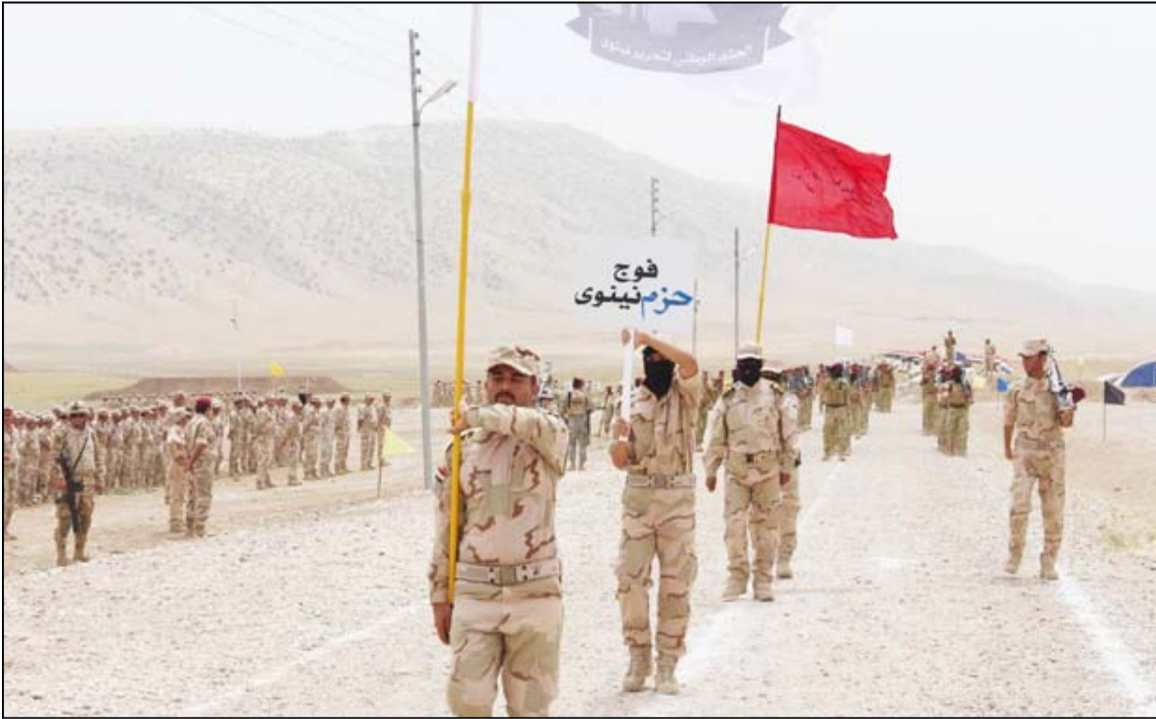
استعراض عسكري لحشد النجيفي.. ا.رشيف