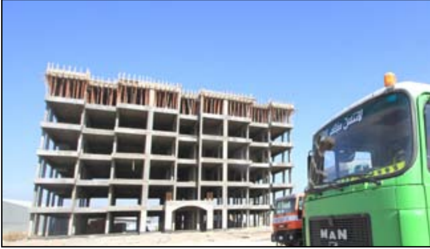
□ بغداد / المدى