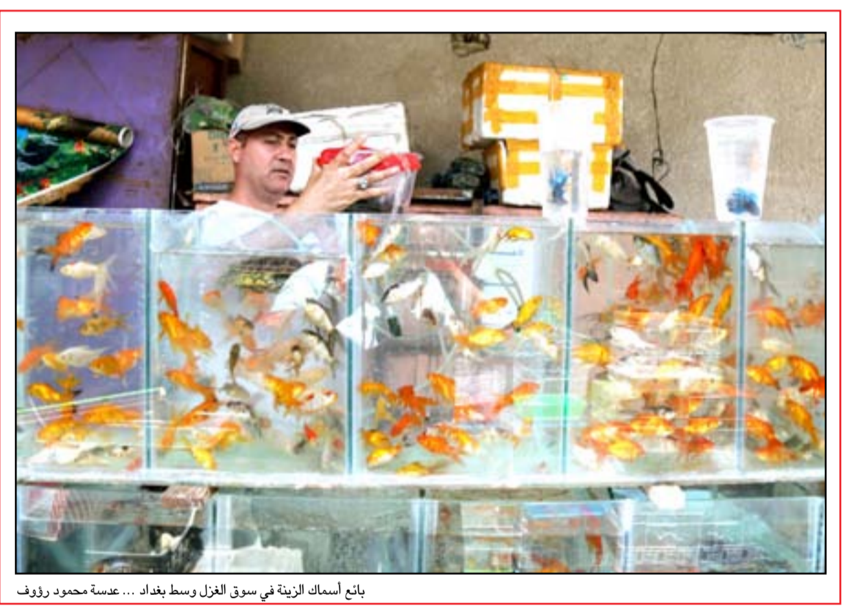
باتع أسماك الزينة في سوق الغزل وسط بغداد