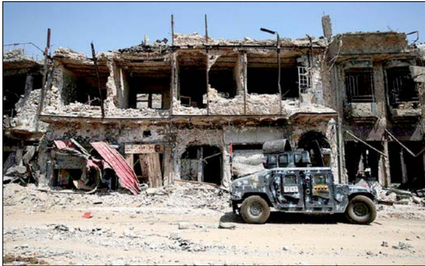
دمار خلفته معارك الموصل..

قال نائب القائد العام لقوات التحالف في العراق الجنرال أندرو كروفث انه ساعد في ادارة وتنسيق الحملة الجوية في الموصل، مستذكرا بان التحدي الذي واجهته الحملة الجوية تمثلت بتنفيذ عمليات في مدينة ذات تعداد سكاني يبلغ 1.8 مليون نسمة بحجم مدينة فيلادلفيا وان العدو كان يختبئ بين السكان المدنيين.