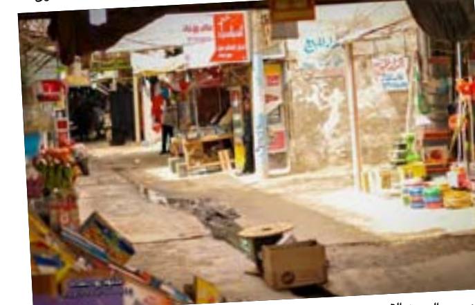
جانبا من السوق القديم