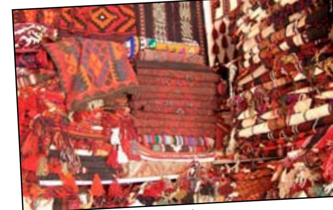
صناعة السجاد والفروشات التي يشتهر فيها السوق

عاشت في سوق مدينة الحي منذ "انتي مينا" وحتى الآن اجيال متعددة تاركة أثارها في مسقافته التي لاتزال كما هي تحتفظ بكل التفاصيل رغم تغيرات الزمن وتعاقب الدهور الحزينة، وانت تسير في السوق الكبير لمدينة الحي يمكنك أن تتحسس خطوات العلماء والكتاب والمشايع والشعراء والساسة والثوار والجدد والمخبرين، ويمكنك أن تتجاذب اطراف الحديث مع من تشاء من اصحاب الدكاكين والباعة، وتصبح على الفور صديقاً كريماً لهم يتمسكون في صداقتك الى الأبد. من بالقرب منه الملك فيصل الثاني والوصي عبد الإله والرئيس عبد السلام عارف، وبار فيه الوريدي والجواهري ومظفر النواب أثناء تخفيه الدائم من السلطة، وكذلك مشى على أرضيته حضيري ابو عزيز وداخل حسن وياس خضر وحسين نعمة ورضا الخياط. تجول في أروقتة الكثير من المهتمين بالسجاد الجياوي الشهير والسروج وأغطية الأسلحة المتنوعة وأدوات الزراعة التقليدية مثل المرواح والمناجل والمساحي، يشعرك هذا السوق بالسحر والعفوية، وتشم من حناياه طيبة أهله التي يصاحبها