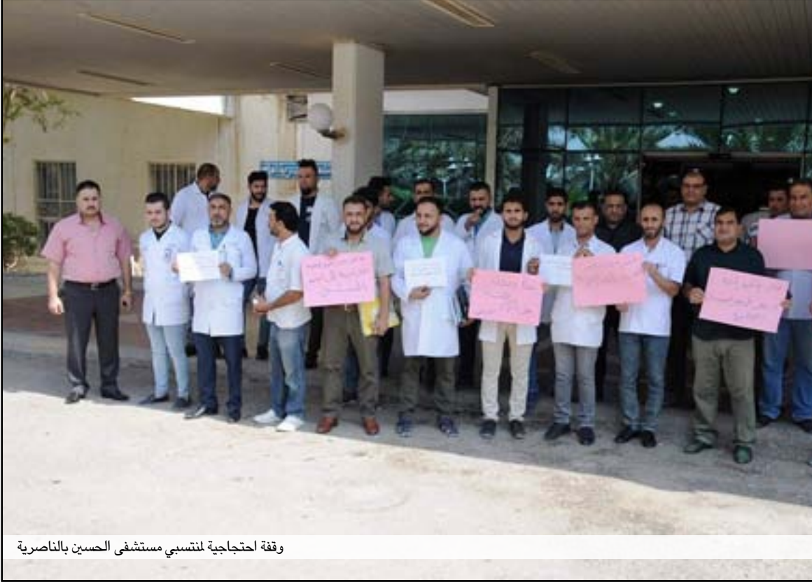
وقفة احتجاجية لمنتسبي مستشفى الحسين بالناصرية

□ الاطباء يتظاهرون لتعزيز الأمن في الدوائر الصحية في المحافظة