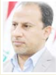
يحيى الناصري محافظ ذي قار

"إن ما أقدم عليه أحد عناصر الشرطة عندما حاول الاعتداء على امرأة عراقية في منطقة الطارمية يجسد أقيح صورة يمكن ان نتصورها لرجل كنا قد وضعنا جميعا ثقنا به كحامي للمواطنين وممتلكاتهم وأعراضهم، ان هذا الفعل المشين، لا يمكن ان يمر دون عقاب ولا يمكن التسرير عليه بأي حال من الأحوال خصوصا وان هذا العنصر السيئ المسيء، حاول أن يستغل وظيفته لا يذاه الناس والاساءة لأقرانه في الوظيفة".