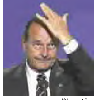
موقف مماثل. وفي اعلان رسمي، اكد شيراك انه "اخذ علما بالقرار السيادي" للفرنسيين.

استقالة دعا سياسيون من اليمين واليسار الى استقالة الرئيس الفرنسي جاك شيراك بعد رفض غالبية الفرنسيين الدستور الاوروبي. وشكل رفض الشعب الفرنسي للدستور الاوروبي ضربة قوية لشيراك