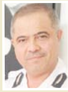
العميد عمار وليد إعلام المرور العامة

"إن الأنباء التي تتحدث عن رفع سعر الغرامة من ٣٠ ألف إلى ١٠٠ ألف أو أكثر غير صحيحة، وهذا الموضوع سابق لأوانه"، إن مقترح المرور الذي أرسل الى الحكومة يحتوي على العديد من النقاط التي تخص المرور، وإن الحكومة تدرس النقاط من بينها رفع سعر الغرامة لردع المخالفات، إن القانون لم يتم الموافقة عليه في الوقت الحالي ولا يمكن الحديث عن هذا الموضوع .