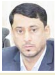
حميد الفزري رئيس مجلس محافظة ذي قار

"ان حصة العراق الإضافية والبالغة خمسة آلاف ، والذين تم تقديمهم من الفائزين بقرعة الحج لعام ٢٠١٨ ، فقد استكملت البعثة جميع الاجراءات المتعلقة بسفرهم للديار المقدسة وستبدأ عملية تفويجهم الاثنتين وفق جدول زمني محدد بعد إكمال الحصول على تأشيرة الدخول من سفارة المملكة العربية السعودية في عمان".