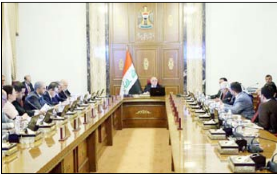
اجتماع مجلس الوزراء... ارشيف

الحكومة تؤكد شمول محدودي الدخل من العمال بالحقوق التقاعدية