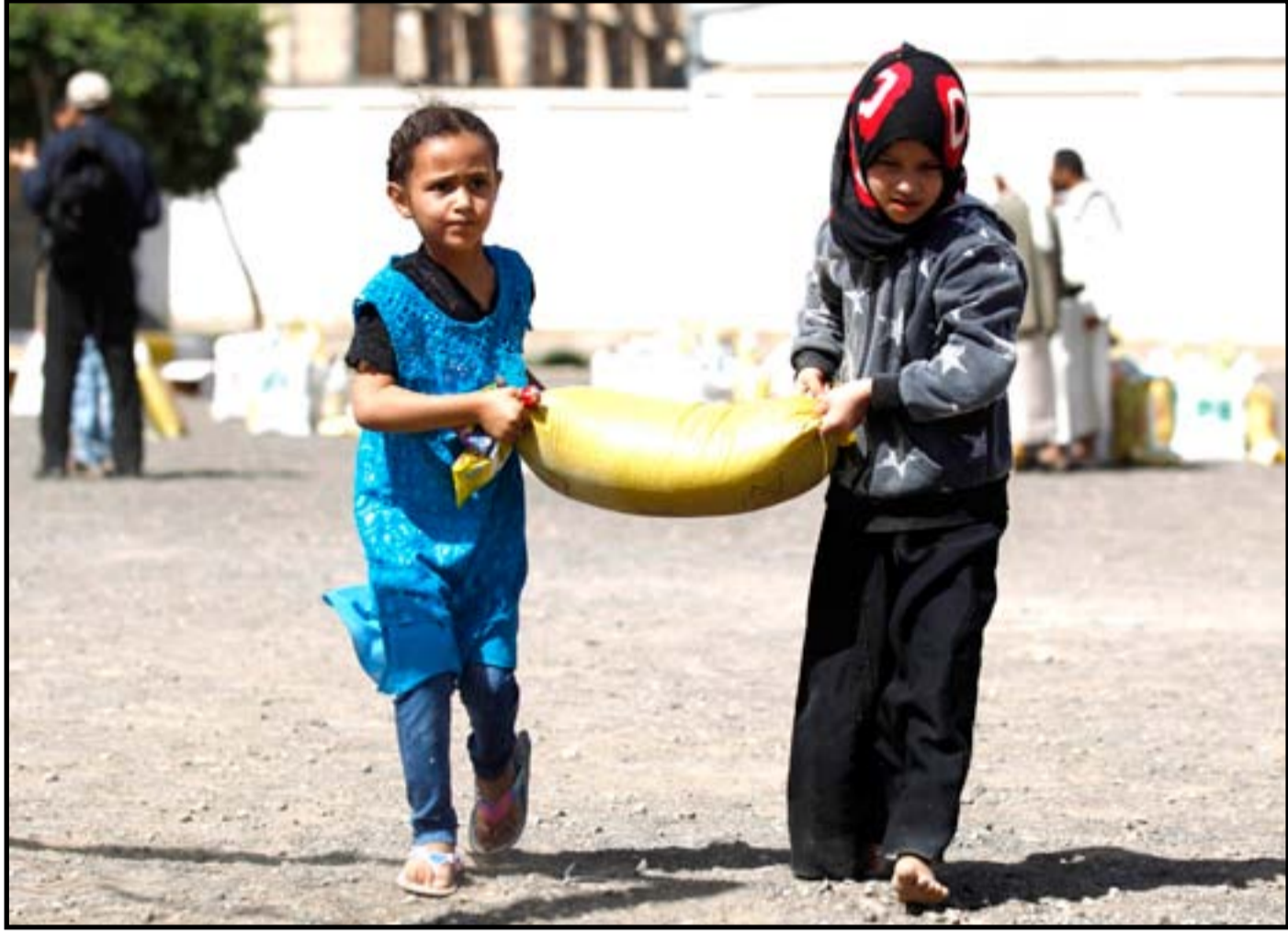
أطفالا يمنيون وهم يحملون مساعدات غذائية توزعها جمعية خيرية محلية في العاصمة صنعاء... أ.ف.ب

شدت رئيسة حزب «ميرتس» الإسرائيلية زهافا جلزون أمس (الأحد) على ضرورة إنهاء احتلال جيش بلادها للأراضي الفلسطينية، وإقامة دولة فلسطينية مستقلة على حدود عام ١٩٦٧. كلام جلزون نقلته وكالة المعلومات والأخبار الفلسطينية (وفا) خلال زيارتها على رأس وفد ضم عضو الكنيست عن حزبها عيساو فريخ، إلى رام الله حيث استقبلهم الرئيس محمود عباس. وقالت جلزون: (إننا نحضر إليكم اليوم، لأننا نؤمن بوجود قيادة فلسطينية معتدلة، ولا يوجد فرق بين أرائنا كشركاء للسلام، لأننا نؤمن بضرورة إنهاء الاحتلال، وإقامة الدولة الفلسطينية المستقلة على حدود العام ١٩٦٧). وأطلع عباس الوفد على آخر مستجدات العملية السياسية، مؤكدا (الدور المهم الذي تؤديه قوى السلام في إسرائيل من أجل تحقيق السلام) على صعيد آخر، ذكر موقع «عرب ٤٨»، أمس، أن شركات أجنبية تعمل في إسرائيل بينها فرنسية وصينية، امتنعت «لأسباب سياسية» عن التقدم إلى أربع مناقصات طرحها إسرائيل الأسبوع الماضي لبناء مقاطع من جدار تبنيه عند الشريط الحدودي مع قطاع غزة. ونقل «عرب ٤٨»، عن صحيفة «ذي ماركي» في تقرير نشرته أمس، أن عالم الجيولوجيا النرويجي في الاحتياط في الجيش الإسرائيلي يوسي لغوفتسكي الذي شغل منصب مستشار رئيس أركان الجيش الإسرائيلي لتهديد الألفاق، يقول إن «حواجز تحت الأرض من أجل منع التسلل عبر الأفاق ليست مجدية سوى لفترة زمنية محدودة فحسب. هذا كان رأيي الذي قدمته إلى جهاز الأمن منذ العام ٢٠٠٥»، معتبرا أن (بناء حاجز بتكلفة مليارات الشواقل هو إثبات على فشل جهاز الأمن، الذي لم ينجح طوال ١٥ عاما في التغلب على تهديد الألفاق).