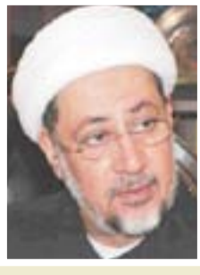
خالد العضية رئيس هيئة الحج والعمرة

"إن الأنباء التي تتحدث عن رفع سعر الغرامة من ٣٠ ألف إلى ١٠٠ ألف أو أكثر غير صحيحة، وهذا الموضوع سابق لأوانه"، إن مقترح المرور الذي أرسل الى الحكومة يحتوي على العديد من النقاط التي تخص المرور، وإن الحكومة تدرس النقاط من بينها رفع سعر الغرامة لردع المخالفات، إن القانون لم يتم الموافقة عليه في الوقت الحالي ولا يمكن الحديث عن هذا الموضوع .