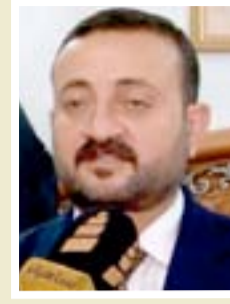
فارس القارس نائب في البرلمان

"يرفض تماماً المساس بحقوق ومكتسبات الأساتذة الجامعيين، لما تمثله هذه الشريحة في بناء البلاد وإعداد الأجيال المتعلمة وفي مختلف المجالات، أن قانون التأمينات الاجتماعية يلحق الغبن والأذى بأصحاب العقول والكفاءات العراقية من حملة الشهادات العليا، استغراب من صدور مثل هكذا قوانين، تسهم في هجرة الكفاءات والعقول والتي تسعى العديد من الدول الأخرى لاستقطابها".