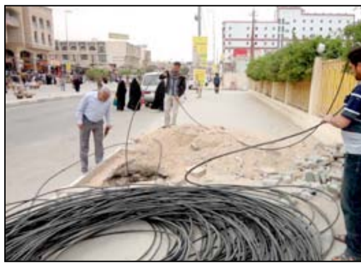
تجهيز مناطق بغداد بالكابل الضوئي