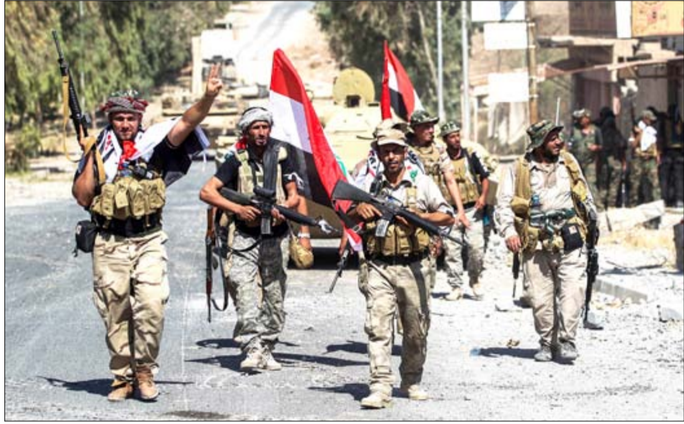
مقاتلون يحتفلون بالنصر وسط مدينة تلغفر

أحكمت القوات المشتركة، أمس، قبضتها على أغلب مناطق مدينة تلغفر في مؤشر على انهيار مقاومة مسلحي تنظيم داعش، في معركة توقع لها أن تكون شرسة وطاحنة. وحتى مساء أمس، انحصرت تواجد المسلحين في أجزاء قليلة من المنطقة الصناعية شمالي تلغفر، وناحية العياضية التي تقع خارج حدود القضاء.