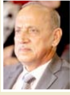
كازم فتنان الجمالي وزير النقل

"يرفض تماماً المساس بحقوق ومكتسبات الأساتذة الجامعيين، لما تمثله هذه الشريحة في بناء البلاد وإعداد الأجيال المتعلمة وفي مختلف المجالات، أن قانون التأمينات الاجتماعية يلحق الغبن والأذى بأصحاب العقول والكفاءات العراقية من حملة الشهادات العليا، استغراب من صدور مثل هكذا قوانين، تسهم في هجرة الكفاءات والعقول والتي تسعى العديد من الدول الأخرى لاستقطابها".