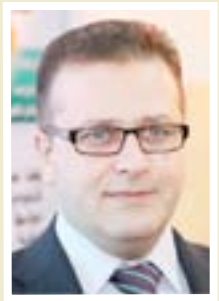
محمد اقبال وزير التربية

تم افتتاح اكثر من ٥ آلاف مركز لمحو الأمية في جميع المحافظات العراقية، وتم تخريج اكثر من مليون دارس من مرحلة الأساس، إن الوزارة أطلقت ضمن الحملة مشروع القضاء على الأمية في المؤسسات الحكومية المختلفة، إذ تم فتح أكثر من ١٨٠ مركزاً، وتخريج أكثر من (٦٩٣٨٩) من الموظفين لجميع الدوائر، وقد تم شمول النازحين بهذا المشروع، عن طريق فتح أكثر (١٥٥) مركزاً لهذا الغرض.