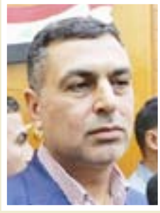
أسعد العبداني محافظ البصرة

إن الاهتمام بالاقضية والنواحي التابعة للمحافظة من ضمن الأولويات ولا صحة لنا وجهنا بشأن الاهتمام الأكبر يكون لمركز المدينة، وسنعد عدة اجتماعات قريبة مع المسؤولين بدوائر بلديات الأفضية ونضع الخطط المناسبة لتنظيمها من النفايات، أذعو المواطنين الى التعاون مع الجهات المعنية للحفاظ على نظافة البصرة لكي نمارس المسؤولية سوية من أجل بقاء المحافظة أزهي وأجمل.