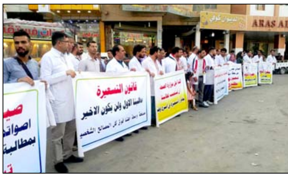
تظاهرة صيادلة ذي قار

الصحة. مضيفاً، فال مواطن عند وجود التسعيرة على عبء الدواء يصبح بإمكانه محاكاة الصيدلي في حال التلاعب بالأسعار ورفع سعر الدواء، مشيراً إلى أن تحديد سعر الدواء سيجد بصورة كبيرة من الصفقات بين الصيدلي والطبيب. مبيناً أن بيع الدواء بالسعر الرسمي، سيضطر الصيدلي إلى دفع ثمن الصفقة من ماله الخاص وليس من الأرباح الناتجة عن زيادة سعر الدواء عند عدم وجود التسعيرة.