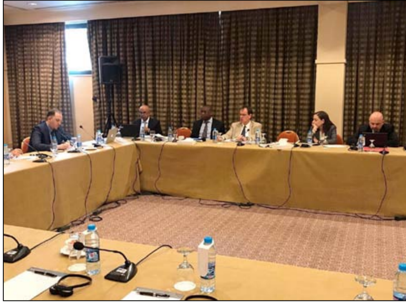
رابعة المصارف الخاصة تطلب الحكومة أن تقسح المجال أمام العمل المصرفي الخاص

أكدت المستشارة الألمانية أنغيلا ميركل، ضرورة الالتزام الصارم بالعملة، وذلك في تعقيبه على مقترح رئيس المفوضية الأوروبية جان-كلود يونكر بشأن تطبيق عملة اليورو في جميع الدول الأعضاء بالاتحاد الأوروبي. وقالت ميركل أمس الجمعة في تصريحات تلفزيونية "بصورة مبدئية ينبغي أن يكون (تطبيق) عملة اليورو متاحا للجميع، ويتعين في الوقت نفسه تحقيق الشروط اللازمة لذلك، وسيظل الأمر على هذا النحو في المستقبل أيضا". وبددت ميركل مخاوف من إمكانية حدوث أزمة ديون على غرار اليونان حال توسيع منطقة اليورو، وقالت: "لدينا معايير واضحة تماما تحدد متى يمكن لدولة الانضمام إلى اليورو". وفي الوقت نفسه، حذرت ميركل من النظر إلى كل الدول في الاتحاد على حد سواء، موضحة أن بلغاريا على سبيل المثال لديها سياسة موازنة تقليدية، كما أن جزها في الموازنة ضئيل للغاية، وذكرت ميركل أن الأمر أيضا يتوقف على رغبة بعض الدول في الانضمام إلى منطقة اليورو، وقالت: "أعلم أنه لا يوجد دافع حاليا لذلك في بولندا والتشيك". واستقبلت ميركل في وقت لاحق أمس رئيس الوزراء الفرنسي إدوار فيليب في برلين، خلال زيارته الأولى للبلاد. ومن المتوقع أن تدور المحادثات حول مقترحات يونكر بشأن توسيع منطقة اليورو. كما رحب وزير المالية الألماني فولفجانج شوبله بمبادرة رئيس المفوضية الأوروبية جان-كلود يونكر لتطبيق عملة اليورو في جميع الدول الأعضاء بالاتحاد الأوروبي، مؤكدا في الوقت نفسه ضرورة الالتزام بالقواعد السارية في هذا الأمر.