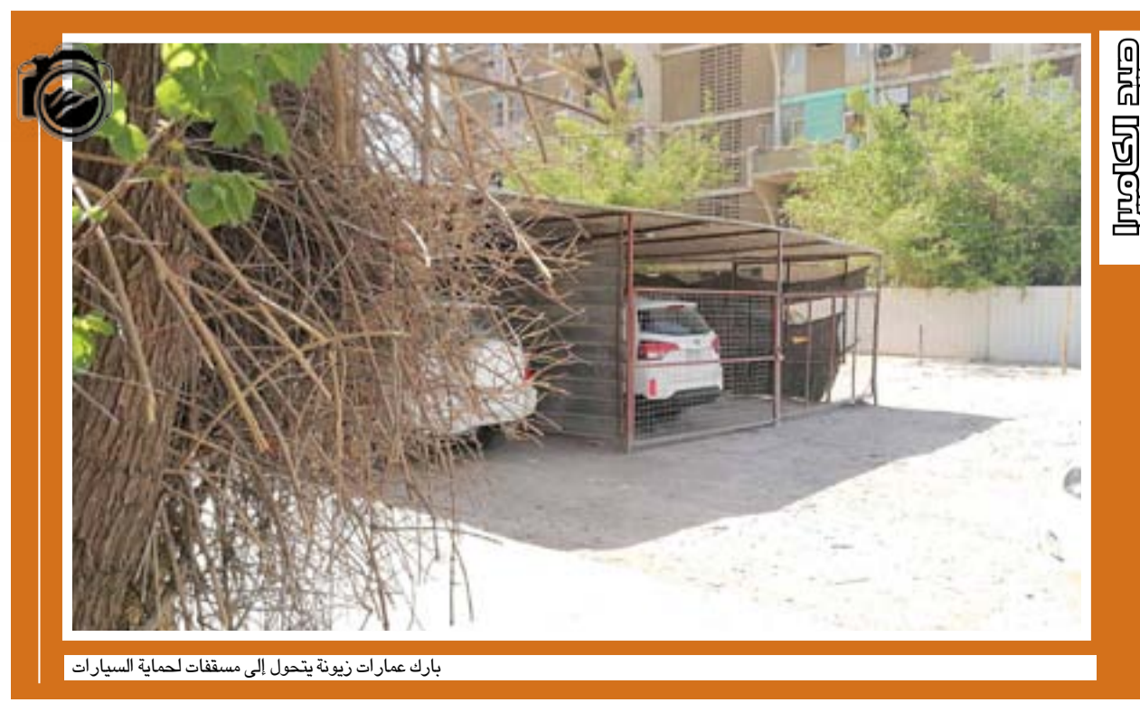
بارك عمارات زيوثة يتحول إلى مسقفات لحماية السيارات

نعم هناك ضغط على رجال المرور بسبب زخم السيارات والمخالفات لعدد من السائقين وعدم التقيد بالقانون. لكن سيارات التاكسي، تحل محل سيارات الحمل الصغيرة بنقل البضائع، كما توضح الصورة، حيث تقوم سيارة "سايبا" بنقل مواد كهربائية قابلة للكسر. ربما يشكو البعض من سائقي سيارات التاكسي كثرتهم في الشارع تزامناً مع قلة العمل، لكن هذا لا يعني أن تكون التاكسي وسيلة أذى في الشارع، معرضة حياة الآخرين للخطر... متابعة هذه القضية، مع دعوة مديرية المرور العامة الشكر الجزيل.