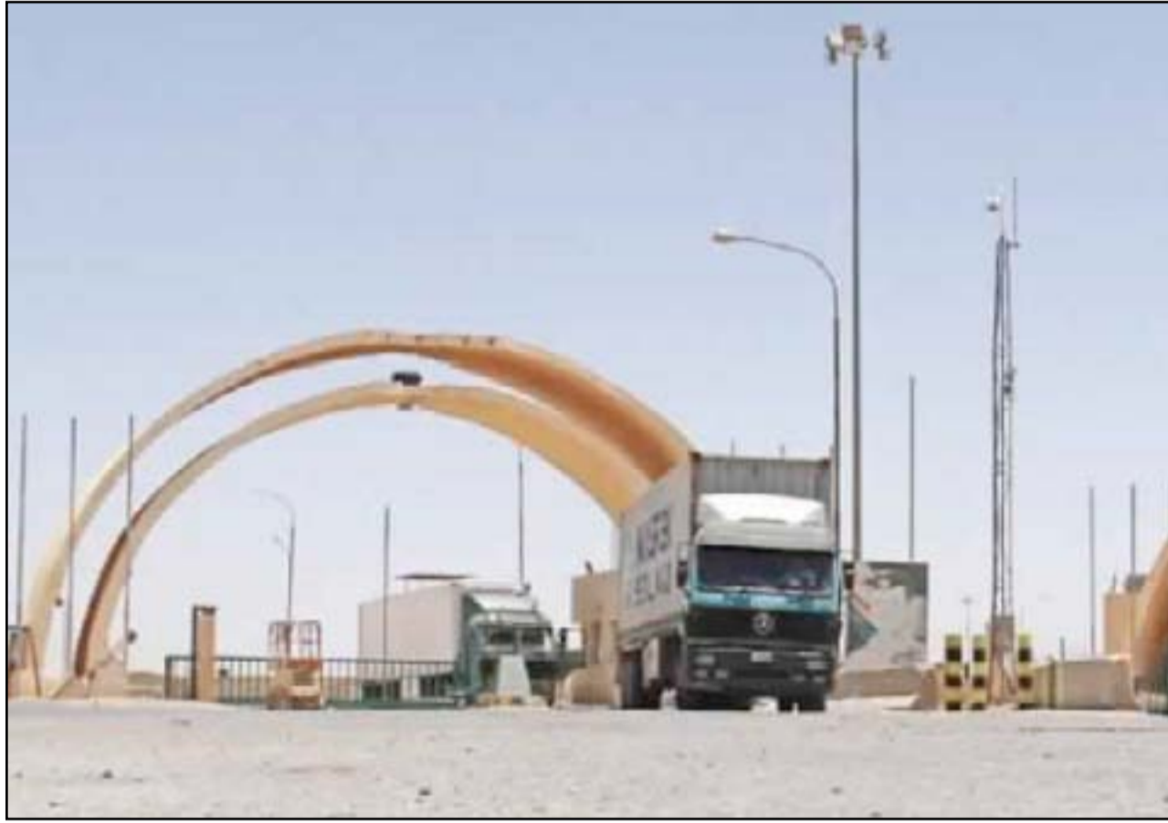
منفذ طريبييل بعيد تنشيط الحركة التجارية بين العراق والأردن

اقامتها قرب مراكز المحافظات، وليس بمسافة 400 كيلو متر عن العاصمة وهي مسافة بعيدة جداً، لان الصناعي العراقي اليوم أحوج ما يكون إلى إقامة منطقة صناعية قريبة من المحافظات، من جانب آخر كان أولى بنا اليوم الاهتمام بالصناعيين العراقيين في الداخل فنحن لدينا العديد من المعوقات في إقامة المشاريع الصناعية وصاحب المشروع الصناعي العراقي اليوم لا يستطيع متابعة مشروع في محافظة بغداد نفسها أو في بابل أو في اية محافظة أخرى، كما ان هناك معوقات كثيرة تواجه إقامة اي مشروع صناعي أهلي ومثال على ذلك فان مشروع إنتاج حديد التسليح في منطقة خور الزبير واجه العديد من المعوقات التي أدت إلى عدم استمراره، وكان من الأولى أن يتم إقامة مناطق صناعية قرب مراكز المحافظات على أن تكون كاملة الخدمات.