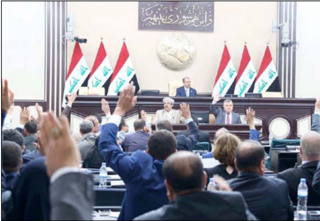
بغداد / محمد صباح

يُتوقع أن يُغيّر مجلس النواب جدول أعماله لجلسته المقررة اليوم الإثنين، ليخصصها مناقشة استفتاء إقليم كردستان الذي فشلت مباحثات بغداد وأربيل بتأجيله. وانتهى اجتماع وفد التفاوض الكردي مع نظيره في التحالف الوطني إلى تمسك الطرفين بمواقفهما إزاء استفتاء إقليم كردستان. ووصف الوفد الكردي المفاوضات التي عقدها مع التحالف الوطني بـ"الحوارات الصريحة" لكنه جدد الالتزام بموعد إجراء الاستفتاء.