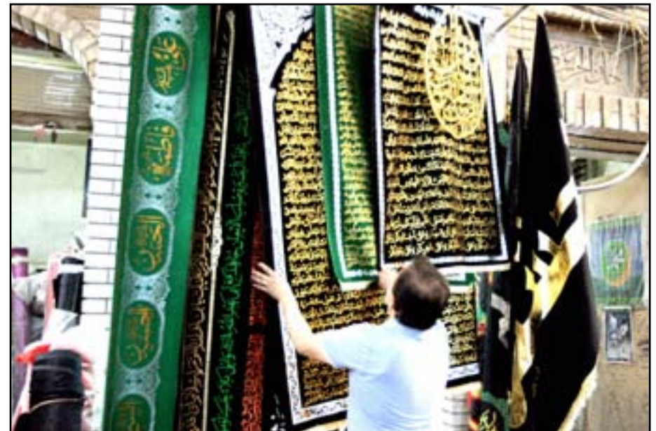
محل لبيع الرايات الحسينية وسط بغداد...

كشفت قيادة عمليات بابل، عن معلومات استخباراتية تؤكد تخطيط تنظيم داعش الإرهابي لشن هجمات ضد المطاعم الخارجية والأماكن المزدحمة في المحافظة، في حين وجهت أصحاب الكافيتريات ومحطات الوقود والمقاهي والأسواق بضرورة التعاقد مع أفراد يتولون مهام الرصد والحماية مقابل الحصول على رخصة لحمل السلاح داخل أماكن عملهم فقط. جاء ذلك على هامش اجتماع أممي موسع عقده قيادة عمليات بابل بحضور قادة الأجهزة الأمنية وأصحاب المطاعم ومحطات الوقود والمقاهي والأسواق لتدارس تعزيز