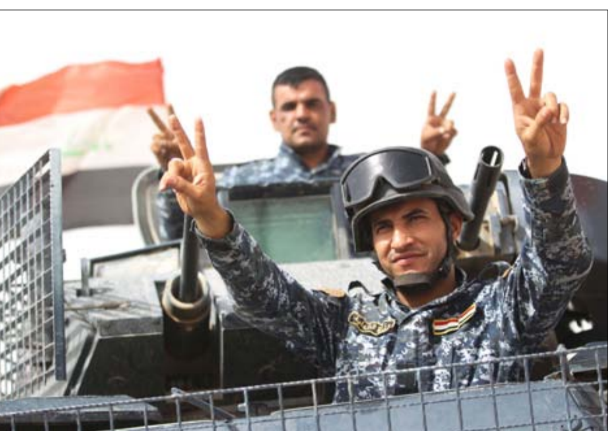
جنود يلوحون بعلامة النصر قرب الحويجة... أ.ف.ب