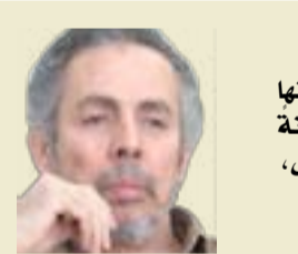
هل يحدث كل هذا مع "العزلة" لأنها خيار داخلي حر؛ أو لأن فيها ضماناً لهذا الحوار البالغ العمق مع النفس، ومع الإنسان المُفترض.

في مرحلة متأخرة وردت هذه الأبيات في واحدة من قصائدي: "إركب بصرًا، خذ خاطرة، خذ طائرة، خذ مركبة لفضاء، واختر لبحرا، بلاداً دون حدود خذت فوق الماء، خلق كالنسر على القمم، وأقم في رجم الأرض جنباً للبركان / بين الحمم، ستعود بألف قناع / يخفي أظراً من وجه ضاع..." واضح أن هذا النص وليد حالة من "الوحدة"، لا "العزلة". ما من رحابة ورضى هنا، وما من أسى كاسى المحب، بل لحظة إحباط باردة تملئها الأفتنة الألف، وهي تخفي الأثر الذي خلفه الوجه الضائع.