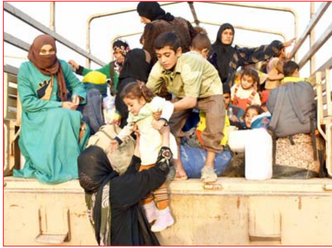
نازحون في البية عسكرية غربي الحويجة... أ.ف.ب