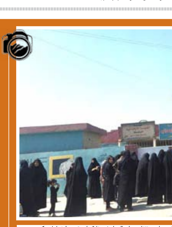
ثلاث مدارس تتناوب على الدوام في بناية واحدة وسط تجاهل حكومي مريب