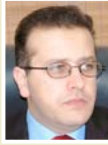
محمد إقبال وزير التربية

"وقعنا أمس الثلاثاء، اتفاقية لخدمات النقل الجوي بين العراق وأفغانستان والتي ستتيح إعادة الحركة الجوية المنتظمة بين البلدين، أن الاتفاقية تنص على تبادل الرحلات الجوية بين البلدين، وهناك أهمية كبرى لهذه الاتفاقية التي من شأنها توثيق العلاقة الاقتصادية الثنائية وتعيدها الى فترة الازدهار التاريخي الذي اتسمت به سابقا، لقد أكد الجانب الافغاني الرغبة في تحسين العلاقات مع الحكومة العراقية وفتح آفاق تعاون جديدة بمختلف مجالات النقل والتجارة".