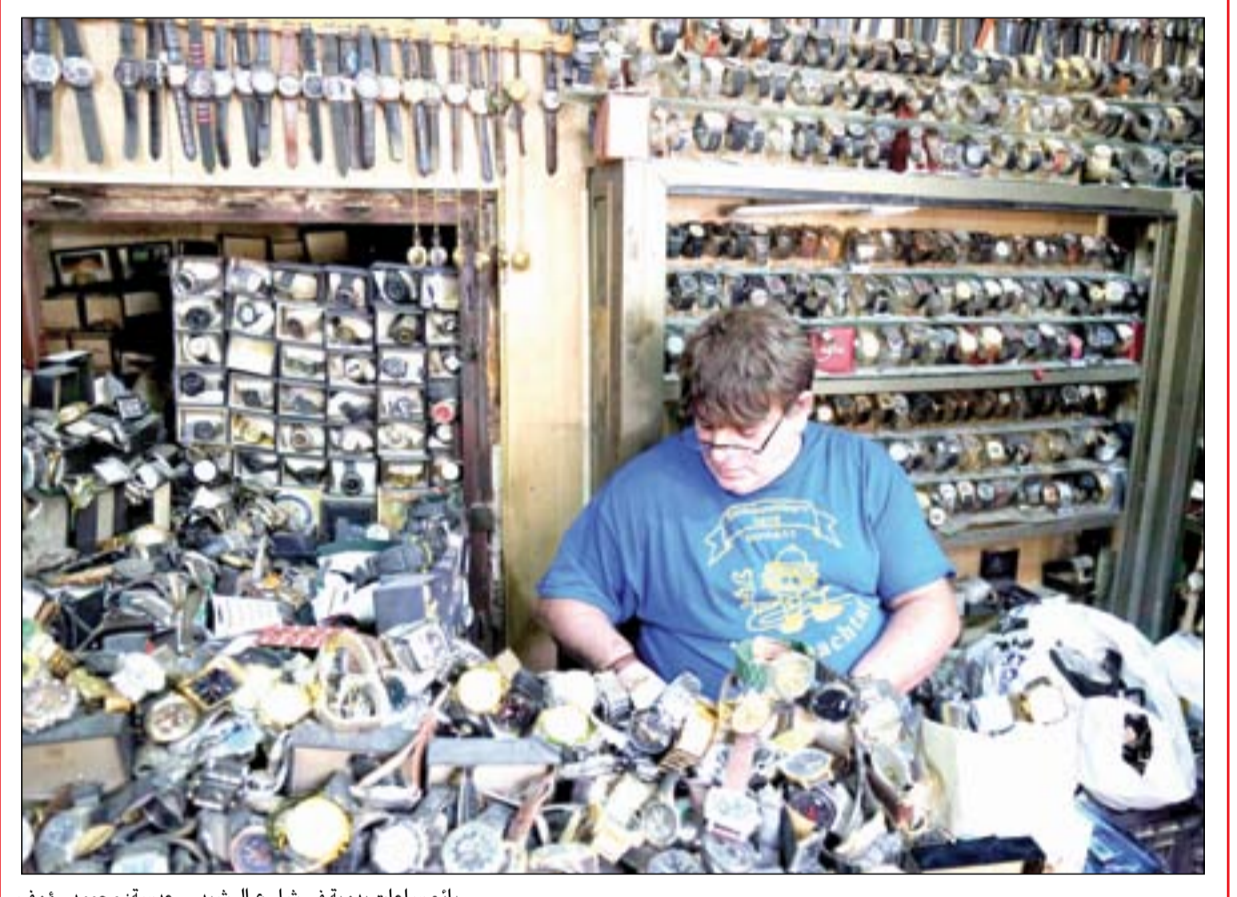
بائع ساعات يدوية في شارع الرشيد...