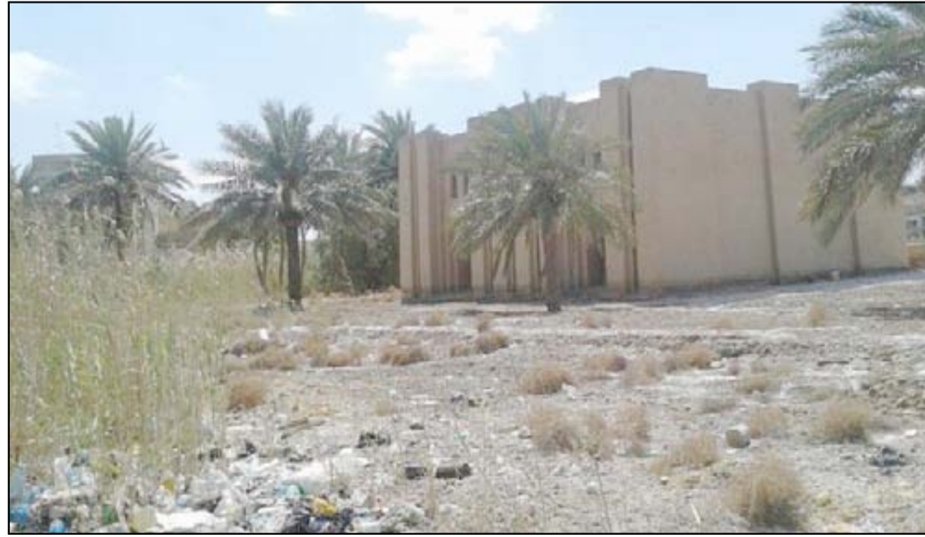
اثار تل حمرل في بغداد

□ أكثر من 325 موقعا معرض لسرقة بسبب غياب الحماية □ مجلس المحافظة يحمل الثقافة مسؤولية ضياع تراث العاصمة