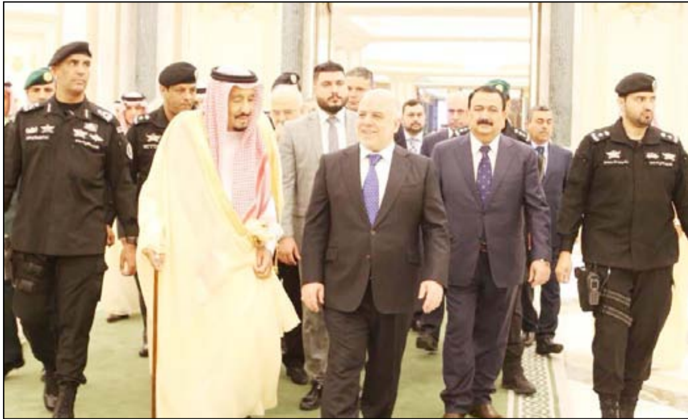
بغداد / المدى

أنهى رئيس الوزراء حيدر العبادي، أمس الأحد، زيارة قصيرة إلى السعودية للمشاركة بانعقاد المجلس التنسيقي بين البلدين الذي حضره وزير الخارجية الأمريكية ريكس تيلرسون - ووصل رئيس الوزراء، مساء السبت، إلى السعودية على رأس وفد رفيع المستوى يضم عدداً من الوزراء والمستشارين.