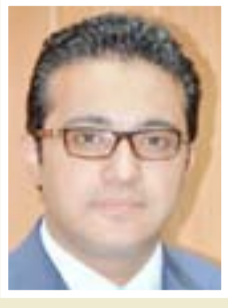
حيدر العبودي المتحدث باسم وزارة التعليم

مجلس محافظة كربلاء عقد جلسته طارئة بحضور جميع الأعضاء وكذلك بحضور المحافظ وقائد شرطة المحافظة وقائد عمليات الرافدين، إن المجلس صوت وبالأغلبية المطلقة على الخطة الأمنية الخاصة بزيارة الاربعة والتي تم مناقشتها من كافة الوجوه ومعالجة الثغرات إذا وجدت وتصحيحها بالتنفيذ على الأرض من قبل الجهات الأمنية كذلك تم استعراض الأعداد والقواطع والاطواق الأمنية للمحافظة وأسماء الضباط المسؤولين عن هذه الأماكن .