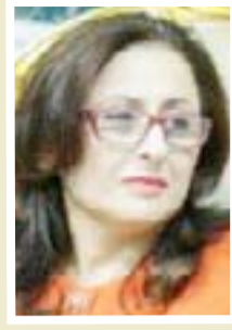
أن أوسي وزير الاعمار والبلديات

إن مديرية بلديات كركوك التابعة لمديرية البلديات العامة إحدى تشكيلات الوزارة باشرت بتوفير جميع الاحتياجات من تخصيصات وآليات من أجل الاسراع في إعادة العوائل النازحة الى القضاء، إن الحملة ستبدأ من مركز قضاء الحويجة ومن ثم الانتقال الى النواحي التابعة لها الرياض - العباسي - الزاب - وناحية الرشاد، تؤكد على ضرورة الاسراع في تقديم الخدمات وإعادة الاعمار في المناطق المتضررة في محافظة كركوك .