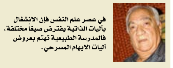
في عصر علم النفس فإن الانشغال بأليات الذاتية يفترض صيغاً مختلفة، فالدراسة الطبيعية تهتم بعروض أليات الإيهام المسرحي.

وإذا كان هذا المسرحي العراقي يريد من عروضه أن يعبر عن ذاته ويكتشف عن مركزه الفني إلى جمهوره، عندئذ سيكون من جملة مبتدعي الميثا ثياتر.