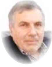
□ د. محمد توفيق علاوي

التزوير في الانتخابات، يمثّل أعلى درجات انتهاك حقوق الإنسان، لأنه يعني فرض أشخاص محتالين ومخادعين لتمثيله ويعني إزاحة الممثلين المخلصين والحققيين للشعب. للأسف نكتشف أن الإجراء الذي اتخذ مؤخرا من قبل مجلس النواب في اختيار مفوضية الانتخابات على أسس المحاصصة السياسية، يتنافى مع ما يأمله المواطن من تحقيق أسس العدالة والذي كان يمكن أن يتحقق من خلال إشراف ثلثة من القضاة النزيهين على مفوضية الانتخابات كما كان مقترحا من قبل عدّة أطراف.