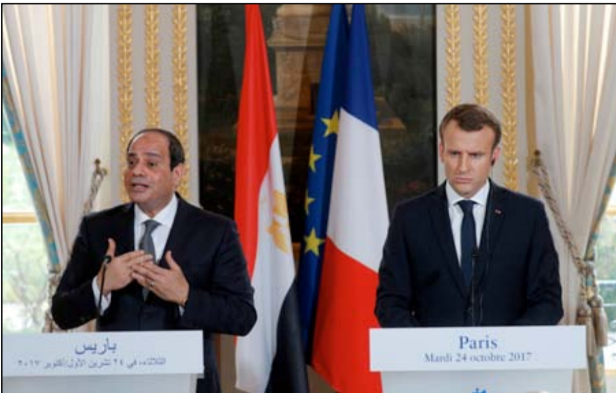
السيسي مع الرئيس الفرنسي في مؤتمر صحفي.. أف ب.

وتابع في معرض تعليقه على مقتل 16 شرطياً مصرياً الجمعة الماضي بهجوم استهدفهم في صحراء مصر الغربية على طريق الواحات البحرية: «لا أحد يستطيع تأمين حدود تمتد 1200 كيلومتر في مناطق صحراوية مئة في المئة»، في إشارة إلى الحدود المصرية مع ليبيا. وردا على سؤال عما إذا كانت لديه معلومات عن الجهة التي تقف وراء هذا الاعتداء، أجاب: «ما زلنا في بداية التحقيقات». وأوضح الرئيس أن هناك «تسنيقا