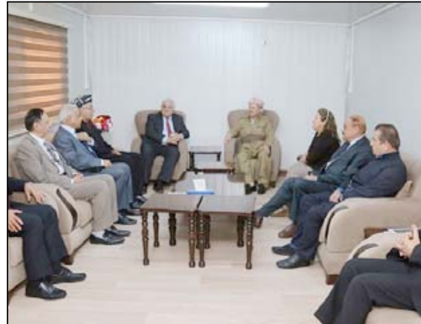
وفد من الحزب الشيوعي خلال لقائه بارزاني..إرشيف

الطوعية لمكوناته"، معتبراً أن ذلك "يعني ضمناً أن من حق أي مكون أن يعيد النظر في اختياره، بالاستناد إلى الدستور. وهو ما لا نتمناه بالطبع وما ندعو الى الحرص على ألا تنصل الأمور بهذا المكون - أيّاً كان - إلى درجة الإقدام عليه". وختم الحزب بالقول "لابد من التنبية التي حقيقة أن الإجماع الإقليمي والدولي على تأييد الحكومة الاتحادية في رفضها إجراء الاستفتاء، لا ينسحب تلقائياً على موقفها الراهن إزاء المباشرة بالحوار". وأكد أن الأمر الذي عكسه خصوصاً وبجلاء البيان الصادر الخميس عن مجلس الأمن الدولي، والذي دعا إلى بدء الحوار بين الحكومة الاتحادية وحكومة الإقليم، ووفقاً لجدول زمني محدد.