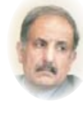
□ د. نجم عبدالله كاظم

من الوزير الحالي اتخاذ قرارات بدت حازمة وحاسمة ومنها عدم اعتماد الدور الثالث وعدم إعادة الطلبة المرقتة قيودهم، كما نقل مؤخراً على شبكات التواصل الاجتماعي قوله: "على الأساتذة السادة التدريسيين عدم محاسبة الطالب على الحضور وترك عملية تسجيل ومتابعة أسماء الطلبة الحاضرين للمحاضرة وكذلك ترك محاسبتهم". فمع نفي الناظر باسم وزارة التعليم العالي الدكتور حيدر محمد جبر، أن يكون السيد الوزير قد وجه بمثل هذا، نجد أن مثل هكذا توجيه، لو صح صدوره عن الوزير، صحيح تماماً، فليس من شأن الأستاذ محاسبة الطالب على الحضور وعدم الحضور، عدا الدراسات العليا، وذلك لأن هناك نظاماً للمحاسبة وهو ليس من شأن الأستاذ. ولكن، وهنا نأتى إلى المهم، ما يؤخذ على هذا النظام، أو بالأحرى على المسؤولين على تطبيقه، أنهم لا يفعلونه ولا يطبقونه، خصوصاً حين تكون السنة الدراسية في النصف الثاني من الفصل