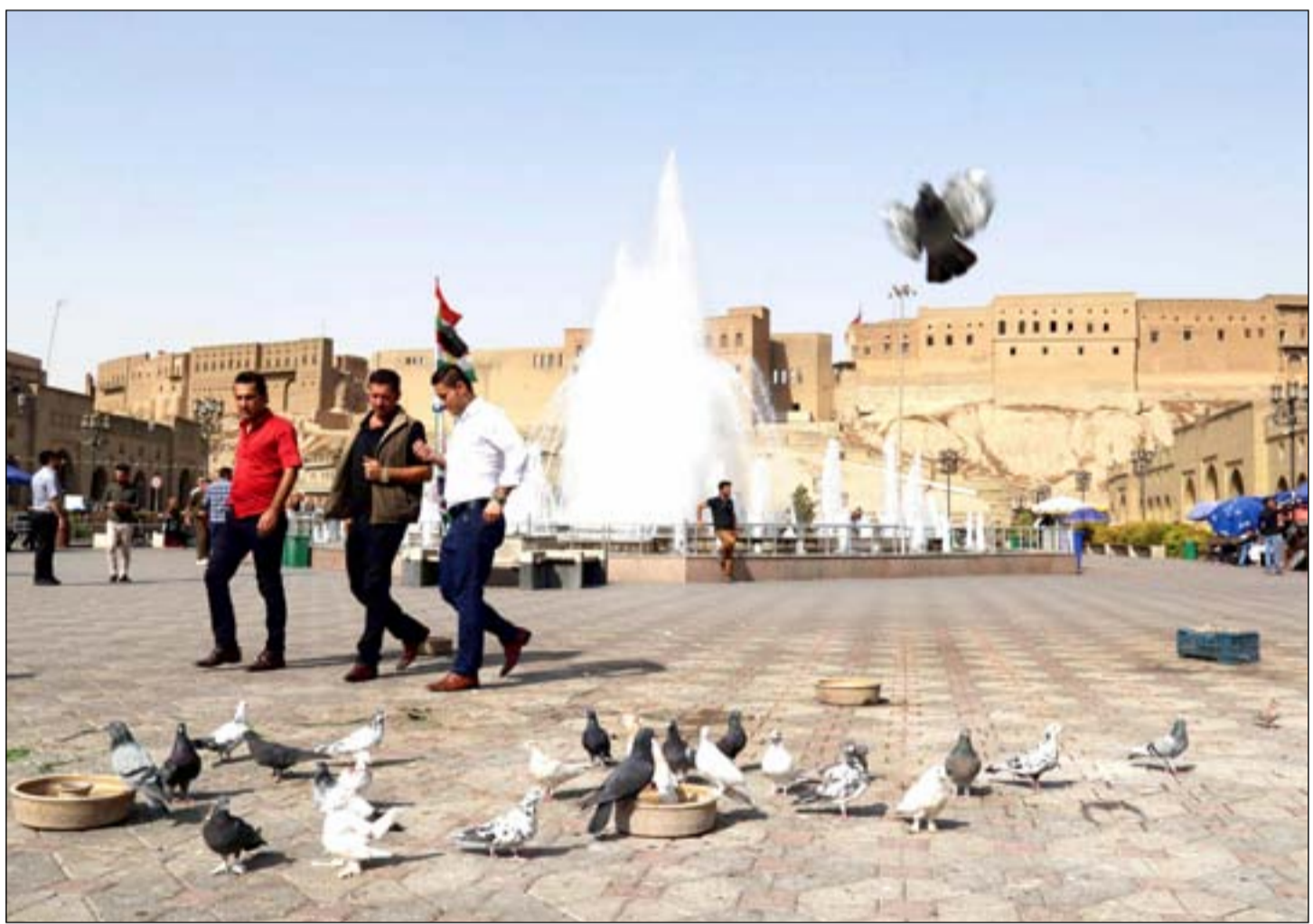
مواطنون قرب قلعة أربيل..