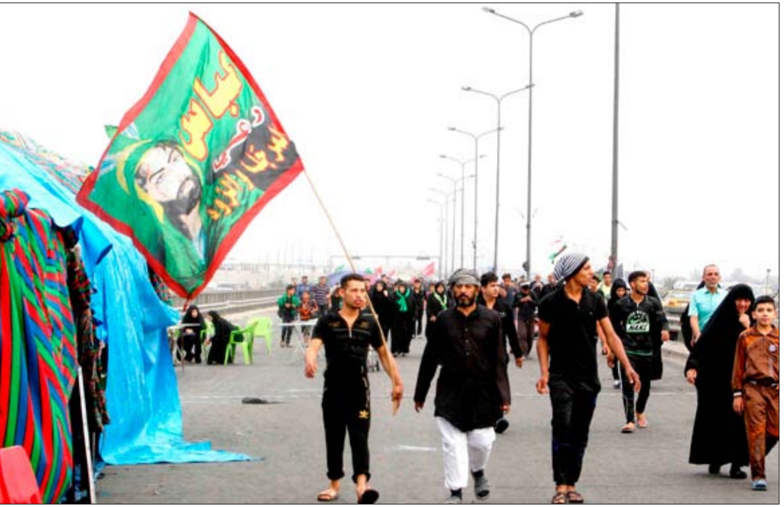
زوار عراقيون في الطريق إلى كربلاء... أ.ف.ب