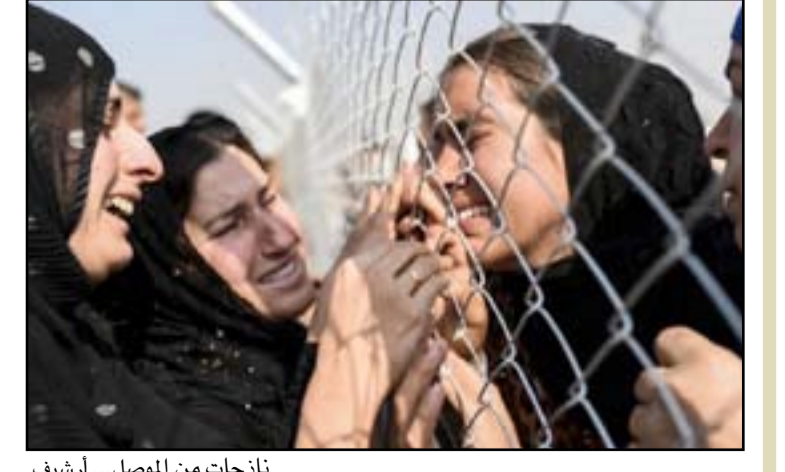
نازحات من الموصل... أرشيف

عثر على العديد من المقابر الجماعية التي تضم ما لا يقل عن ٤٠٠ جثة بالقرب من الحويجة، التي تمت استعادتها من داعش مطلع تشرين الاول. وفي العام ٢٠١٤ سيطر تنظيم داعش على نحو ثلث مساحة العراق ونصف مساحة سوريا المجاورة وعلن قيام "الخلافة". وارتكب التنظيم أعمالاً انتقامية مروعة في المناطق التي كانت خاضعة لسيطرته، تضمنت إعدامات جماعية وقطع رؤوس. غير أن التنظيم خسر معظم الأراضي التي كان يسيطر