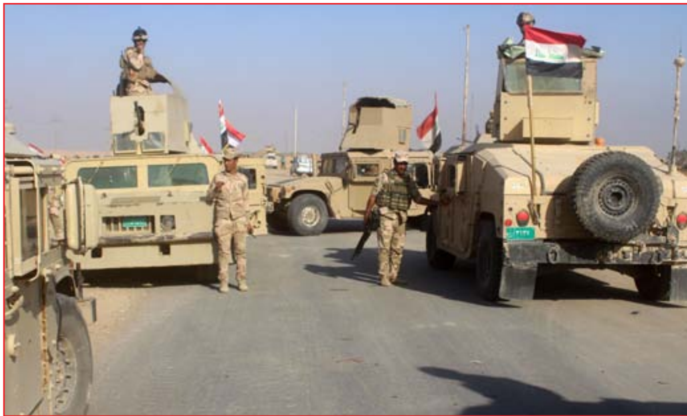
اليات عسكرية منشورة في راوة.. أ.ف.ب

■ العبادي: قواتنا حررت راوة بوقت قياسي ■ عملية خاطفة تنتهي بعزف النشيد الوطني على أبواب المدينة