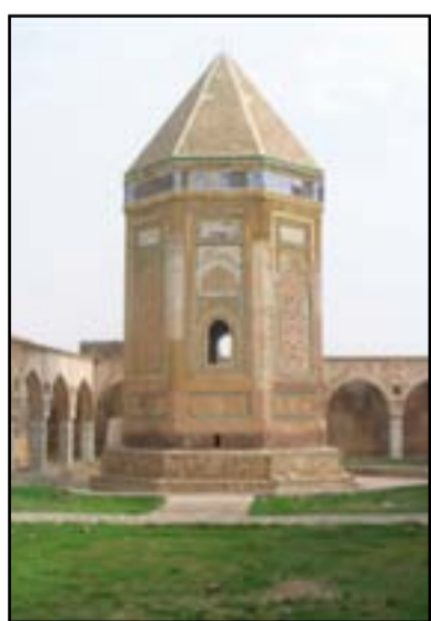
ضريح تاريخي في القلعة