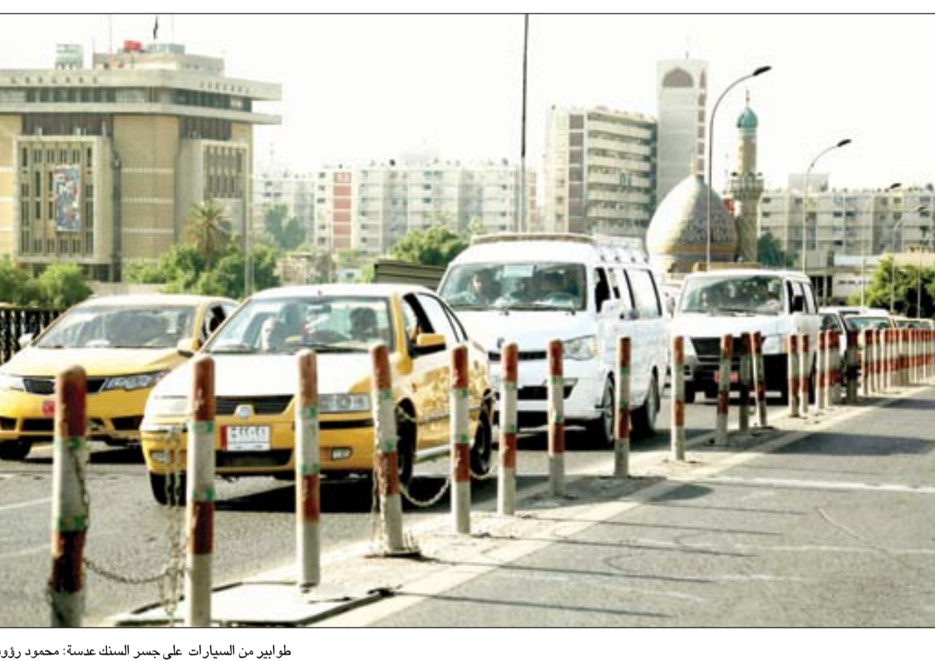
طوابير من السيارات على جسر السنك