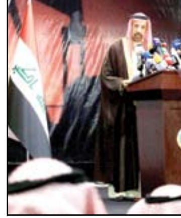
"خلال الشهرين الماضيين حققنا خطوات مهمة في مجال التعاون الملكية، ويحظى هذا الاهتمام برعاية ولي العهد"، مضيفاً أن

بين البلدين، وهي تشمل تشكيل لجنة للطاقة والصناعة للتواصل مع الجانب العراقي، كما تم حث الشركات السعودية على الإسراع بالدخول للسوق العراقية وتنفيذ استثمارات، وكذلك تم التوقيع على ١٣ مذكرة تفاهم بين شركات سعودية وعراقية للغاز والغاز. وتابع "تم افتتاح مكتب لشركة (طاقة) السعودية في العراق، وشركة (سابق) بصدد إعادة افتتاح مكاتبها في العراق، وكذلك تم تشكيل لجنة للعمل على مشروع عملاق للربط الكهربائي البلدين، وسوف يتم التواصل مع الجانب العراقي بهذا الشأن".