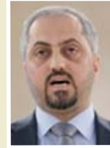
حيدر الزاملّي وزير العدل

"وجهنا مكتب المفتش العام في الوزارة لإكمال فتح فروع للمكتب في جميع محافظات البلاد وخاصة في المحافظات المحررة من الإرهاب، إن ذلك جاء لإسناد الدور الحكومي في مكافحة الفساد ومتابعة كل من تسول له نفسه المساس بمصالح المواطنين، خاصة وإن الدور الرقابي لمؤسسات الوزارة ومنها مكتب المفتش العام في هذه الفترة أدى الدور الكبير في مكافحة الفساد".