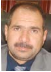
فرات التميمي نائب عن ديالى

"وجهنا مكتب المفتش العام في الوزارة لإكمال فتح فروع للمكتب في جميع محافظات البلاد وخاصة في المحافظات المحررة من الإرهاب، إن ذلك جاء لإسناد الدور الحكومي في مكافحة الفساد ومتابعة كل من تسول له نفسه المساس بمصالح المواطنين، خاصة وإن الدور الرقابي لمؤسسات الوزارة ومنها مكتب المفتش العام في هذه الفترة أدى الدور الكبير في مكافحة الفساد".