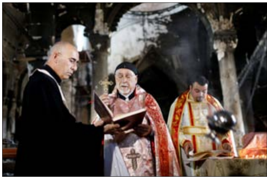
رجال دين يصلون في إحدى كنائس الموصل المدمرة.. أرشيف

□ جدد رفضه تدخل رجال الدين في العمل السياسي والنشاط القوم