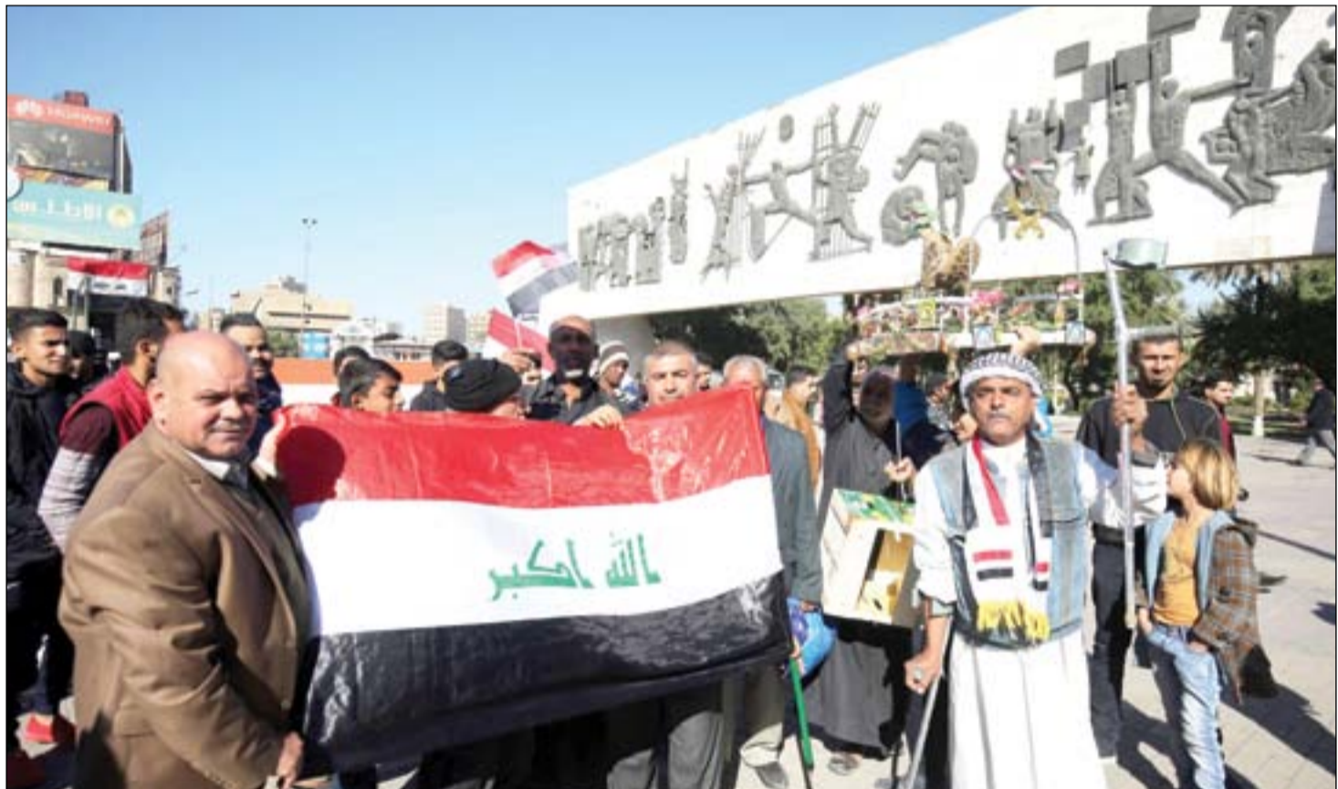
مواطنون يحتفلون بالنصر على داعش في ساحة التحرير أمس.. أ.ف.ب

العراق: سيترجع اعتمادنا على النفط إلى 15% خلال العقود القادمة