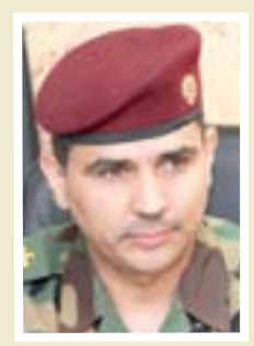
العميد سعد معن المتحدث باسم الداخلية

"إن مديرية الاحوال المدنية والجوازات والاقامة ستوقف عن استلام معاملات الخاصة بجوازات السفر في بغداد وجميع محافظات البلاد دون استثناء للفترة من ٢٥ ولغاية ٢٠١٧/١٢/٣١ وذلك لانتهاء السنة المالية، وإن ذلك إجراء طبيعي تقدم عليه المديرية في نهاية كل سنة أسوة بباقي دوائر ومؤسسات الدولة، وإن مديرية الاحوال المدنية قد حددت فتح نافذتين ستخصص للحالات الطارئة والإنسانية".