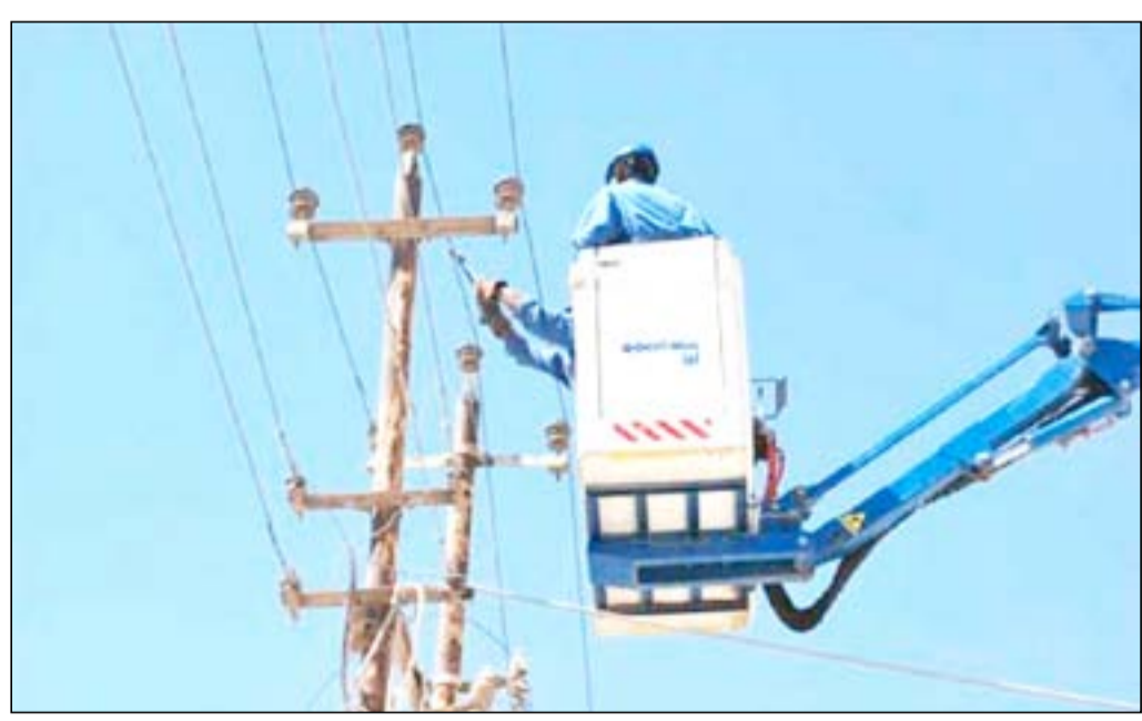
اعمال صيانة الكهرباء في كركوك

عزت إدارة محافظة كركوك، زيادة ساعات القطع بالتيار الكهربائي لعموم المحافظة ناجمة بسبب أعمال تخريبية ناتجة عن استهداف أبراج الضغط العالي بالقرب من قضاء الطلوز جنوب كركوك، في حين أشارت الى أن حصة المحافظة المجهزة عن طريق المستثمر في اقليم كردستان تقلصت في الأونة الاخيرة مما فاقم القطع المبرمج ليصل الى ١٩ ساعة يوميا.