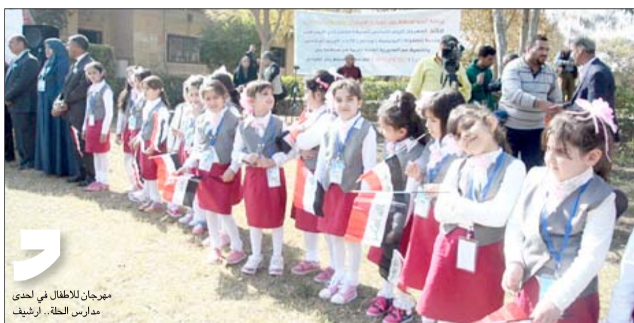
مهرجان للاطفال في إحدى مدارس الحلة.. أرشيف

يشار إلى أن منظمة الأمم المتحدة للطفولة (اليونيسيف) باشرت بشروع المدارس الصديقة للطفل في عام ٢٠١١ وبتمويل من الاتحاد الأوروبي، حيث تهدف المبادرة إلى ضمان جودة التعليم والتحاق جميع الأطفال بالمدارس والحد من ظاهرة التسرب والاسترشاد بثلاثة مبادئ أساسية هي الشمولية والتعليم المتفحور حول الطفل والتشاركية المجتمعية. يذكر إن المشروع شمل حتى الآن ٥٤ مدرسة من مدارس المحافظة بعد أن كان قد بدأ بعشر مدارس فقط.