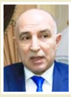
نوفل العاكوب محافظ نينوى

"إن أمانة بغداد أكملت نصب العوارض الحديدية لمنع مرور المركبات التي يزيد ارتفاعها على (٢,٥) مترين ونصف المتر والسماح للمركبات دون هذا الارتفاع بالمرور للحفاظ على سلامة الجسر، وسيكون افتتاح الجسر يوم الأحد المقبل، ولمرور العجلات الصغيرة فقط، وإن دائرة المشاريع تعمل أيضا على تثبيت العلامات المرورية والنشرات الضوئية لمنع مرور المركبات الكبيرة".