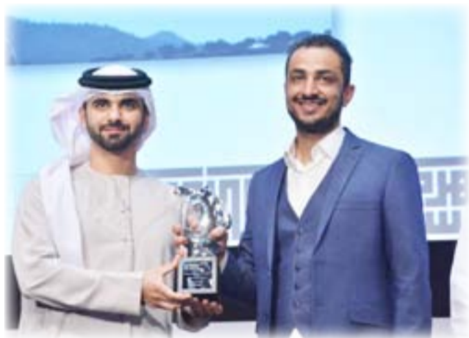
المخرج ضياء جودة

والزاماً بتعزيز نمو صناعة السينما المحلية والدولية، وزع المهرجان عدداً من الجوائز لمجموعة مختارة من