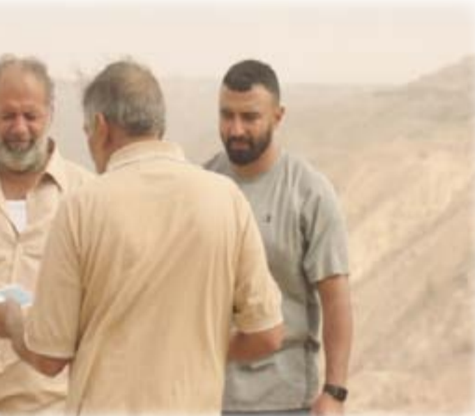
من فيلم (أرض الآباء)