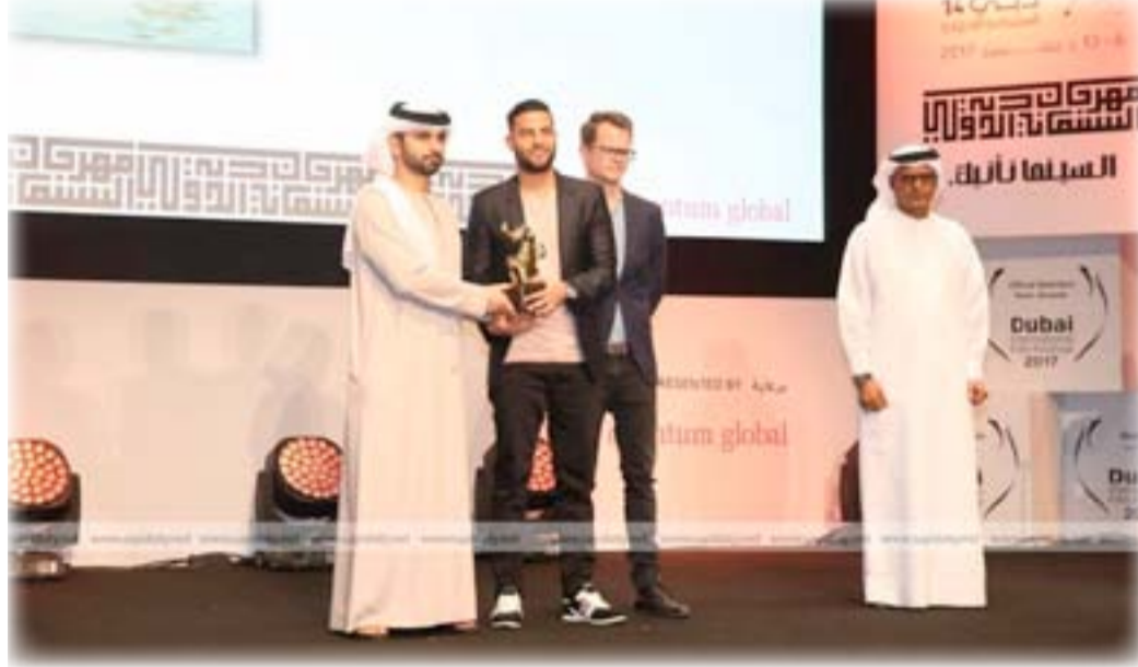
المخرج علاوي سليم يتسلم جائزته

والزاماً بتعزيز نمو صناعة السينما المحلية والدولية، وزع المهرجان عدداً من الجوائز لمجموعة مختارة من