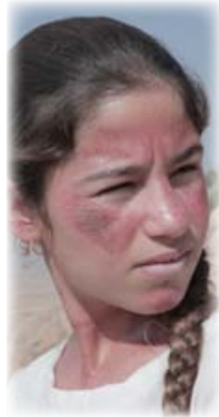
من فيلم (سببية)

الفني للمهرجان: «نمت مسابقة المهر مع الحدث، ومنذ تأسيسها شهدت التطور المستمر في تنوع وقوة المواهب من مختلف أنحاء المنطقة. وبالتأكيد أهدت لجنة التحكيم لاختيار الفائزين بجوائز المهر، نظراً للمستوى المرتفع للأفلام المشاركة هذا العام، وأود أن أتوجه بخالص التهنية إلى الفائزين الذين استحقوا الفوز عن جدارة وقدموا مشاريع جريئة وقصصاً رائعة، وعرضوا وجهات النظر من شتى أنحاء المنطقة، وساهمت رؤيتهم المبدعة في إغراء الجمهور. نحن متحمسون لرؤية نجاحاتهم مستقبلاً، وسنرحب بهم مرة أخرى في الدورات المقبلة للمهرجان.