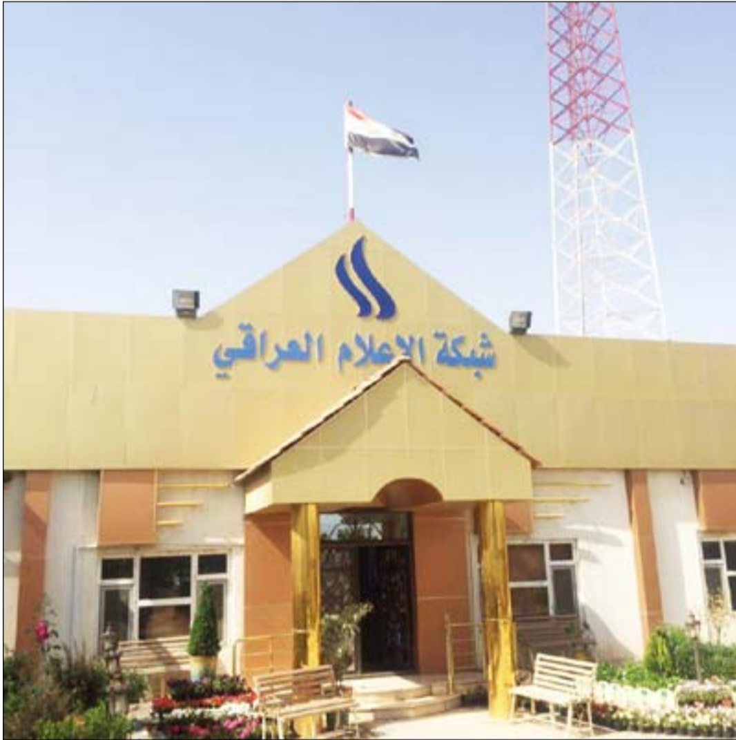
شبكة الاعلام العراقي

الوزراء الذي بدوره يقوم باختيار المرشح المناسب من بين عدد المرشحين وفق الآلية المذكورة في القانون . واعتبر البيان قيام المجلس بتسمية