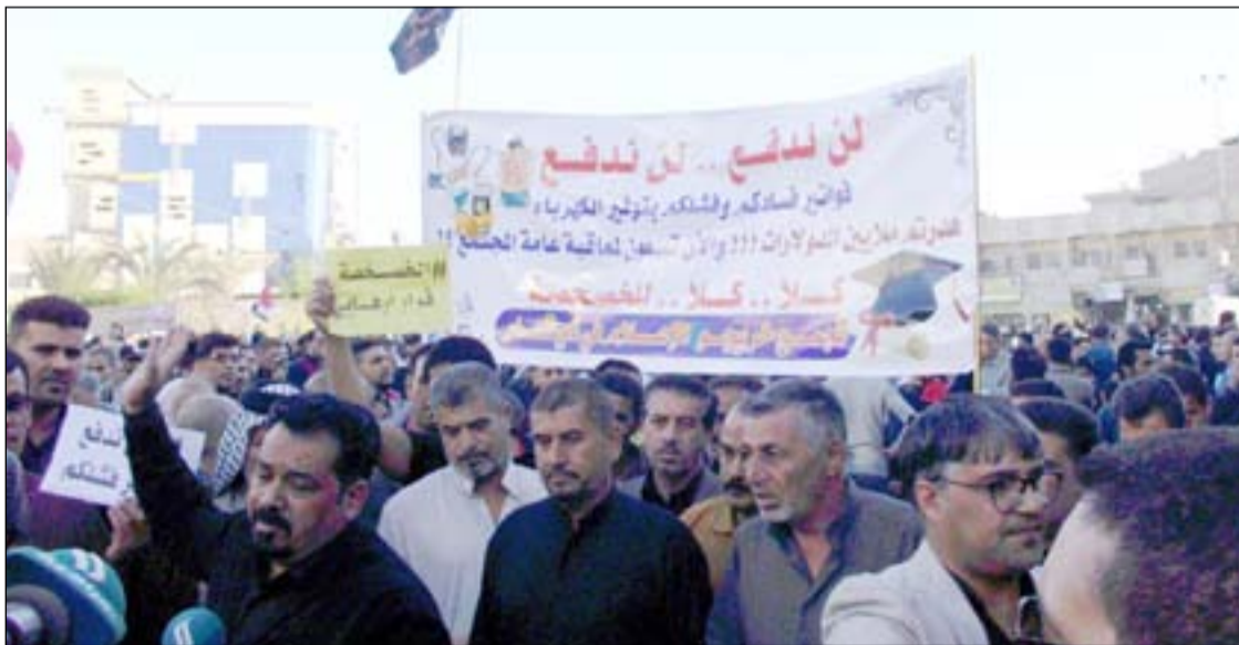
تظاهرات ذي قار