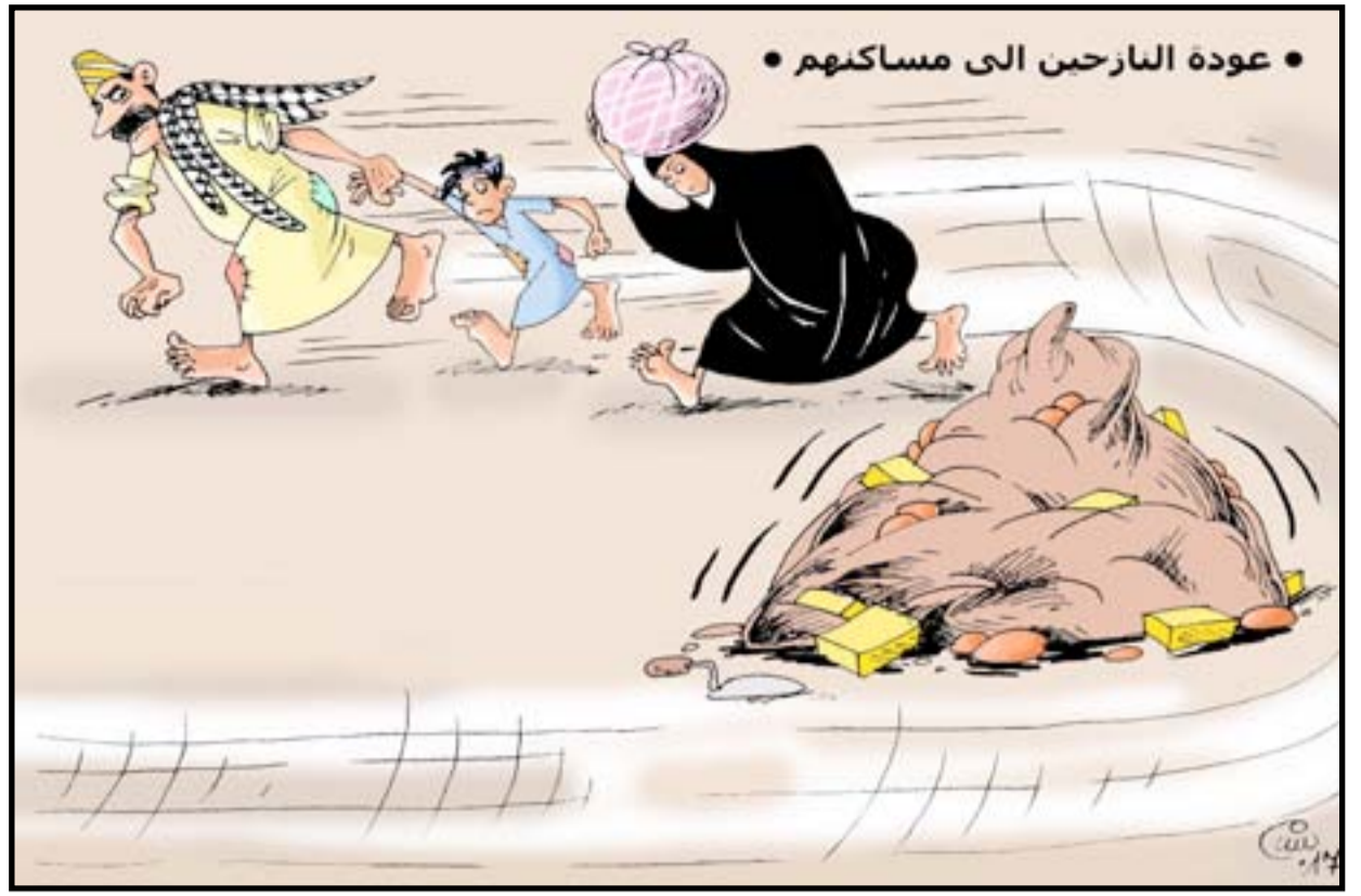
عودة النازحين الى مساكنهم

تصوّر رواية لويز م. الكوت نساء صغيرات الصادرة حديثاً عن دار المدى معاناة عائلة تقطن إحدى المدن الصغيرة، كان رب العائلة السيد مارش الذي يجعل ميسراً قد ترك زوجته وبناته الأربع لكي يلتحق بالجيش، حيث تجري جميع أحداثها أثناء تغيبه الذي دام مدة عام. أما المقولة التي تضمنتها القصة فهي أن تلك الفتيات الصغيرات السن كُنَّ بإرشاد والدتهن قد كرسن أنفسهن لمساعدة الآخرين وتخليهن عن التطلع إلى حياة الرفاهية التي تتطلع إليها من هن في سنهن، وكُنَّ رغم الصعوبات يُجنزن ما كان عليهن القيام به من أعباء ومن واجبات فرضتها عليهن ظروف الحرب وغياب الوالد والمعيل، ذلك لأنهن كُنَّ يعتبرن ذلك بمثابة السعي للوصول إلى مجتمع فاضل.