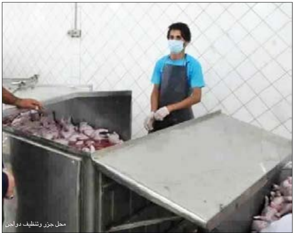
محل جزر وتنظيف دواجن

على حركة الدواجن والطيور ومنتجاتها بين المحافظات والمدن والإبلاغ عن الحالات المشتبه بها فوراً لاتخاذ ما يلزم بصدها، فضلا عن شرط الحصول على الشهادة البيطرية للدواجن الوافدة الى المحافظة. منوها الى أن الاجراءات اجراءات احترازية لتفادي انتقال المرض الى المحافظة، وذلك بعد تسجيل حالات اصابة بمرض انفلونزا الطيور في الدول المجاورة. وأشار الدخيلي الى جملة من الاجراءات اتخذتها المحافظة من بينها تشديد الاجراءات الرقابية