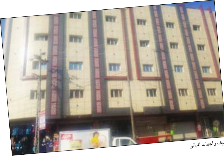
تغليف واجهات المباني