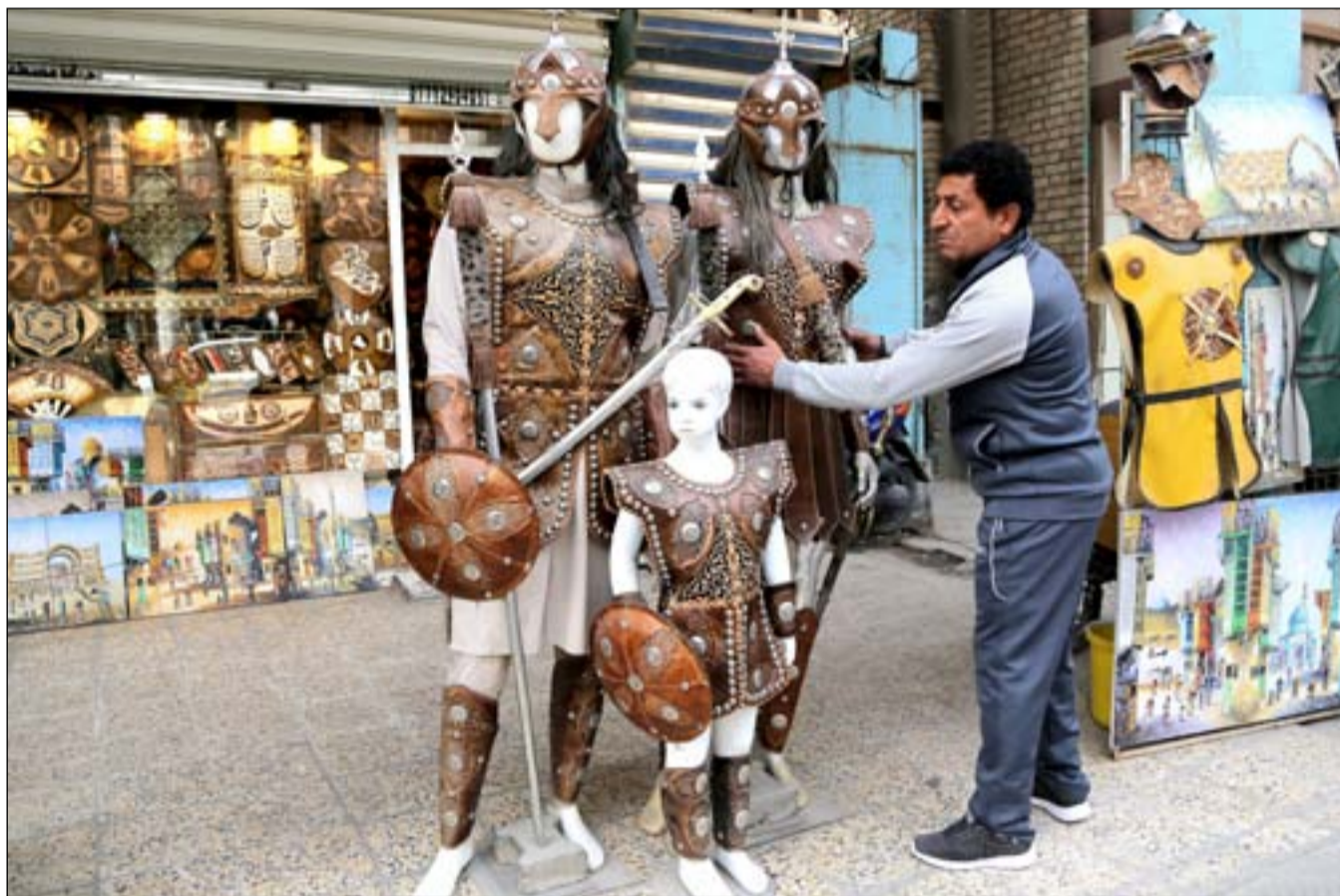
محل لبيع الأزياء المصنوعة من الجلد في شارع الرشيد وسط بغداد... عسدة / محمود رؤوف