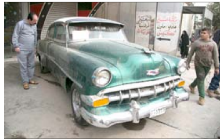
سيارات قديمة تعود لرحبة خمسينيات القرن الماضي عند احد هواة جمع العجلات الانتيكات يقوم بعرضها على ناصية شارع يقع قرب مهقي يديرها بمنظمة الاعظمية وسط بغداد...