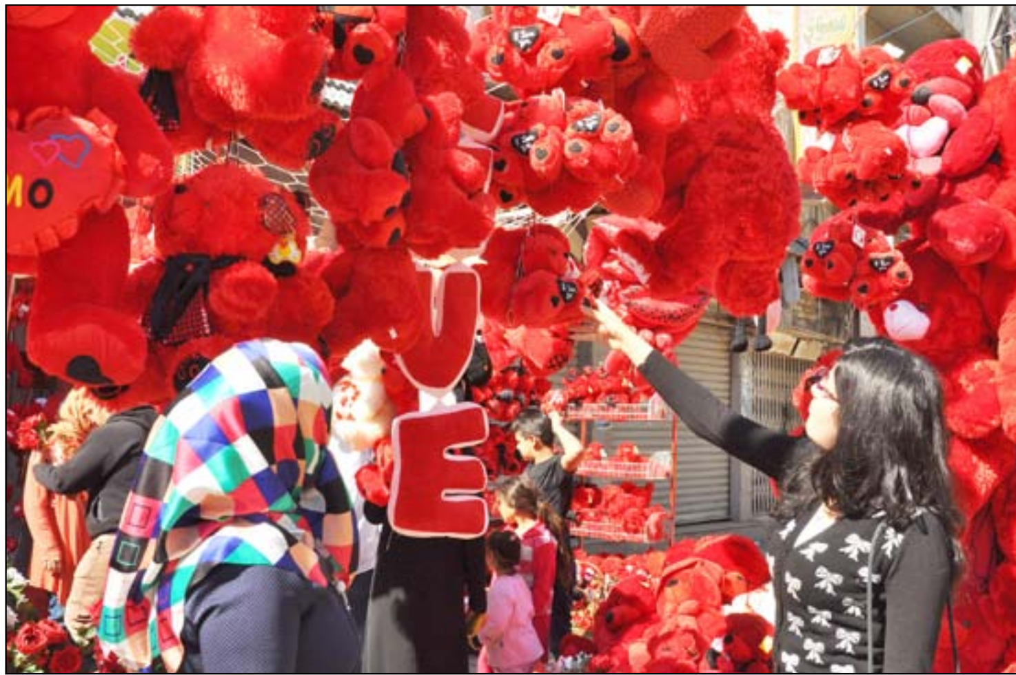
بغداد تحتفل بالفالانتاين على طريقتها الخاصة...