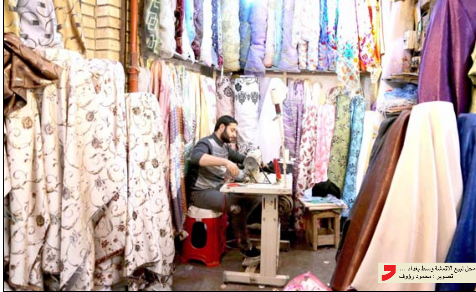
محل لبيع الأقمشة وسط بغداد ... تصوير : محمود رؤوف